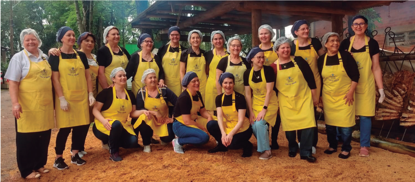
Mais uma vez as senhoras da Casa da Amizade arrasaram com as saladas no almoço do Costelão do Rotary, realizado no último domingo. Sabor, diversidade, tudo feito com muito capricho e amor. Parabéns!