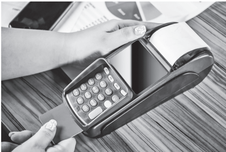
A medida também aumenta a transparência para os participantes do mercado quanto aos custos envolvidos na transação e facilita a supervisão da aplicação da regra

O BC esclareceu que, em relação à regulamen-