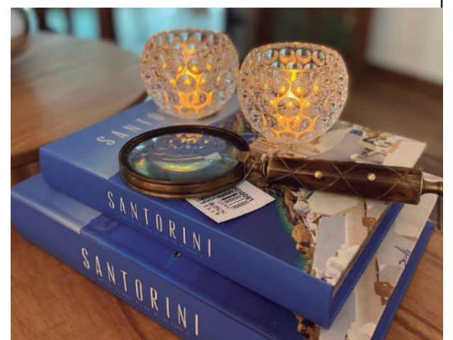
A DB Lare Móveis e Decoração tem peças lindas para compor seu ambiente. Ela sabe que a arte de moldar espaços reflete identidade, bem-estar e bom gosto. Faça uma visita e apaixone-se pelas peças exclusivas e pelo bom atendimento!