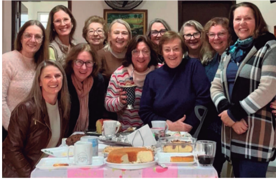
Um registro especial das ex-colegas professoras da "Setrenzinha", que continuam fortalecendo a amizade em encontros ao redor de uma boa mesa, regados de muita alegria e belas recordações