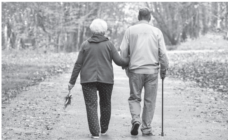
O câncer é uma das doenças que mais afetam a população idosa. Com o avanço da idade, as células do organismo passam por mudanças naturais, aumentando o risco de alterações que podem levar ao desenvolvimento de tumores

De acordo com a Estimativa 2026 de Incidência de Câncer no Brasil, elaborada pelo Ministério da Saúde em conjunto com o Instituto Nacional de Câncer (INCA), alguns tipos da doença apresentam maior probabilidade de surgimento a partir de determinadas faixas etárias.