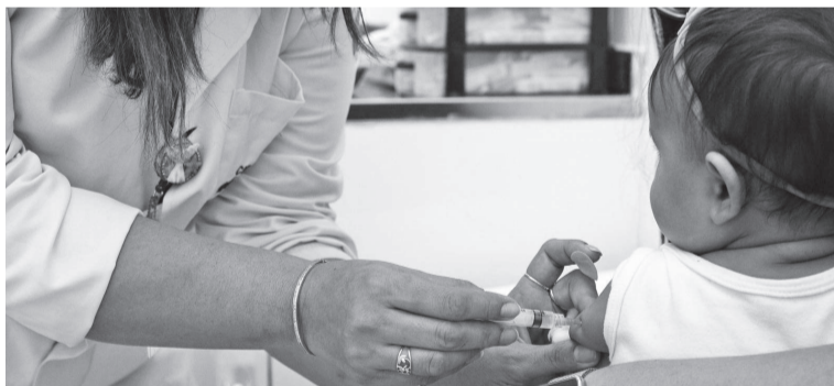
O esquema do Programa Nacional de Imunizações (PNI) passa a contemplar as doses aplicadas aos 2, 4 e 6 meses de vida, o primeiro reforço aos 15 meses e a dose adicional aos quatro anos

A partir de agosto, crianças de quatro anos deverão receber uma dose adicional da Vacina Inativada Poliomielite, medida que amplia a proteção e ajuda a manter o Brasil livre da doença. Sociedade de Pediatria do RS orienta famílias a manterem calendário em dia