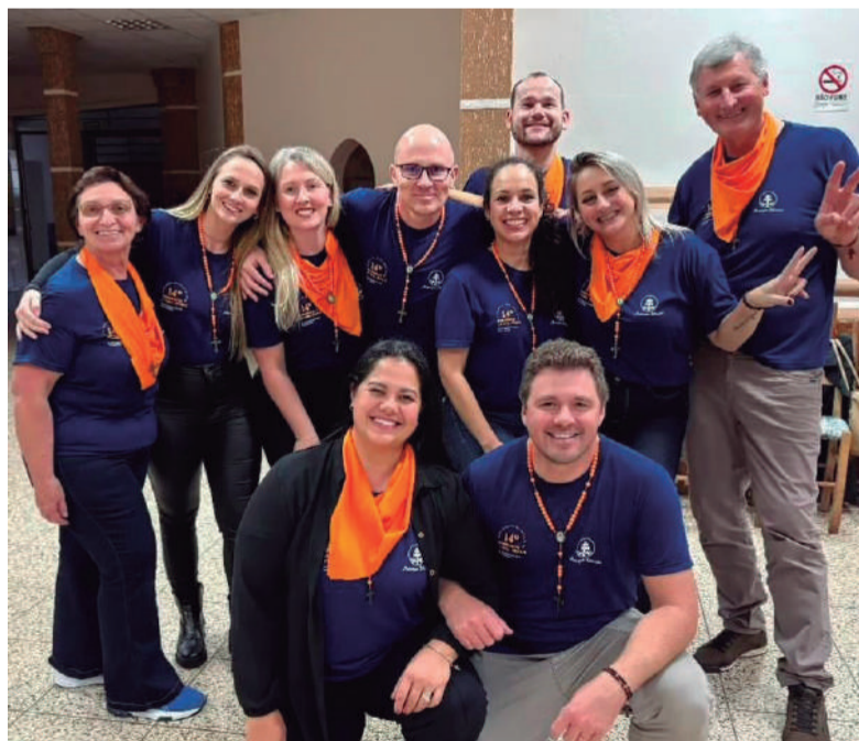
Encontro dos grupos do acampamento da Paróquia Nossa Senhora da Conceição, de Três de Maio. O registro foi no último final de semana.