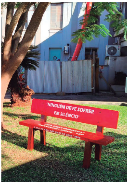
A instalação de bancos vermelhos - símbolo internacional ao combate à violência contra a mulher e ao feminicídio - é outro projeto desenvolvido pela Casa da Amizade

O banco é um símbolo internacional ao combate à violência contra a mulher e ao feminicídio.