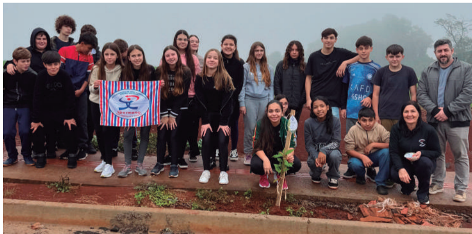
Alunos e professores participaram do plantio das árvores