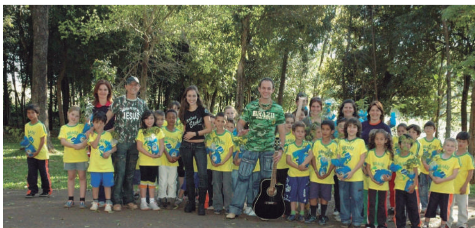
Registro de 2006, quando a turma da 2ª série da EMEF Germano Dockhorn participou da gravação do DVD do projeto "Plante uma Árvore", cantando com Mano e Matheus