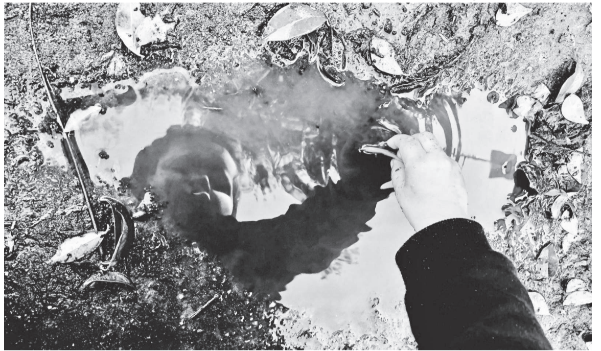
Diversos estudos mostram que as brincadeiras simples ao ar livre perderam espaço para telas