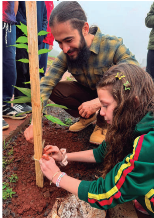
Alunos e professores participaram do plantio