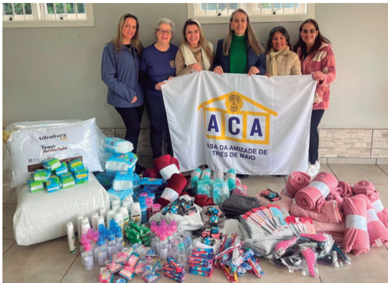
Produtos adquiridos com recursos do evento das patronesses foram entregues para Casa Abrigo Bojena Cereser