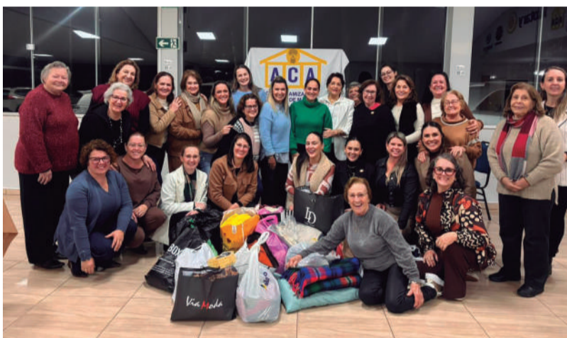
Integrantes da Casa da Amizade realizaram campanha interna para arrecadar doações de roupas e mantas para crianças e adolescentes da Casa Abrigo Bojena Cereser