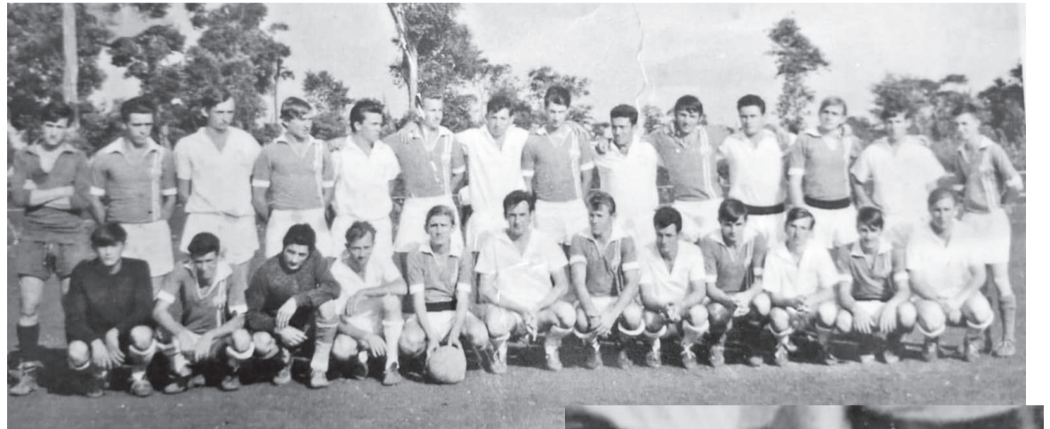
Time do Guarany Futebol Clube de Consolata (de camisas brancas) em registro feito por volta de 1965 quando a equipe viajou para fora do Estado pela primeira vez na carroceria de um caminhão a fim de disputar um amistoso contra um time do Paraná

Naqueles anos, um time com moradores da chamada Esquina Moranguieira vinha chamando a atenção de muitos pelo entrosamento de seus jogadores e incansável persistência em campo. O time havia surgido algum tempo antes, em um local pouco adiante do Lajeado Tarumã , subindo a lomba, onde havia um potreiro que alguns jovens utilizavam para jogar bola, e como haviam vários tocos espalhados ao longo do terreno - em decorrência da ruminância de animais que comiam pequenos arbustos deixando os tocos espetados sob a grama - seguidamente, chutes com pés descalços ocasionavam um jogador estendido ao chão com o pé machucado, e logo deram a esse time o nome provisório de " Arranca-toco ". Mas com a boa