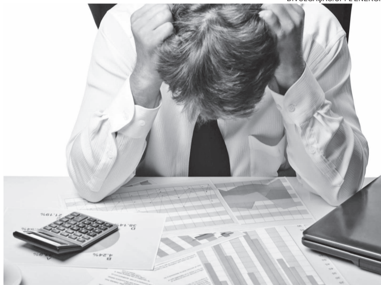
Em março de 2025, cada consumidor negativado de Três de Maio devia, em média, R$ 6.304,63. Em 2026, o valor chegou a R$ 9.235,52,

Em Nova Candelária, embora o número absoluto seja menor, o crescimento proporcional foi um