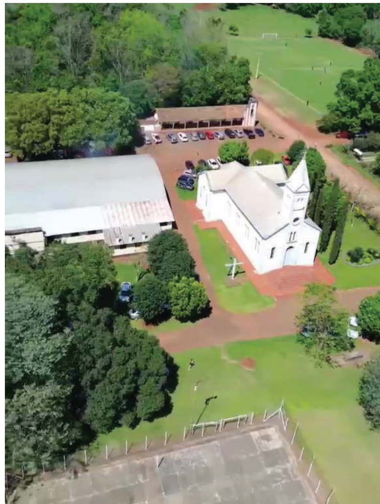
Foto aérea da comunidade de Rocinha