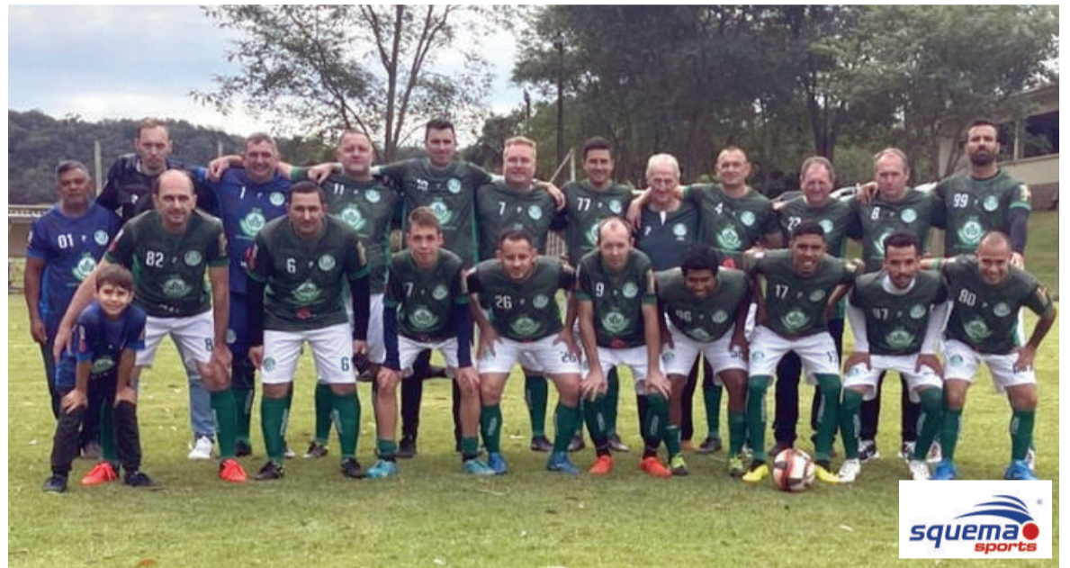
Palmeiras de Mato Queimado inaugurou novo fardamento no último final de semana