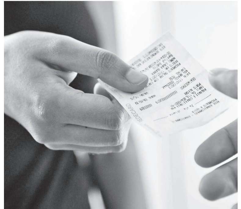
Campanha do Promocional Três de Maio É Show orienta empresas e clientes sobre a validação de notas fiscais para participação da Tenda da Sorte