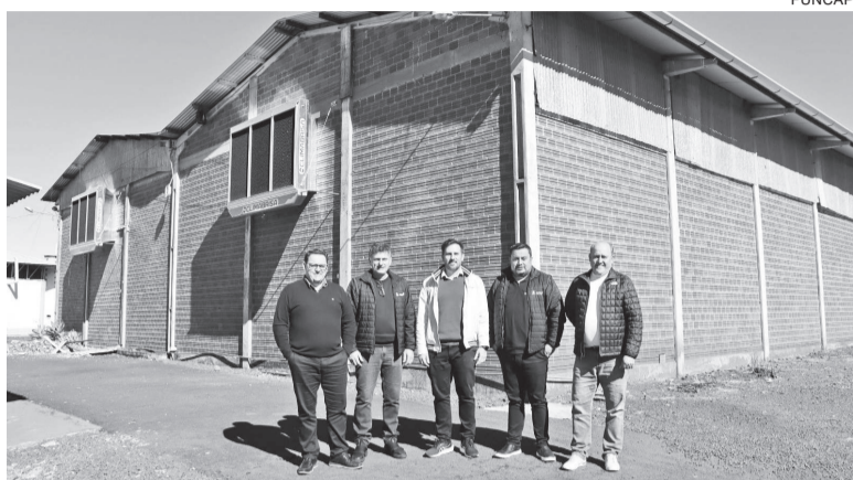
O parque de exposições é gerido pelo Conselho Gestor do Parque, composto pela Prefeitura de Três de Maio, Fundação de Capacitação e Desenvolvimento - Funcap e Associação Comercial e Industrial

Instalação dos equipamentos foi financiada com recursos obtidos em feiras realizadas no município