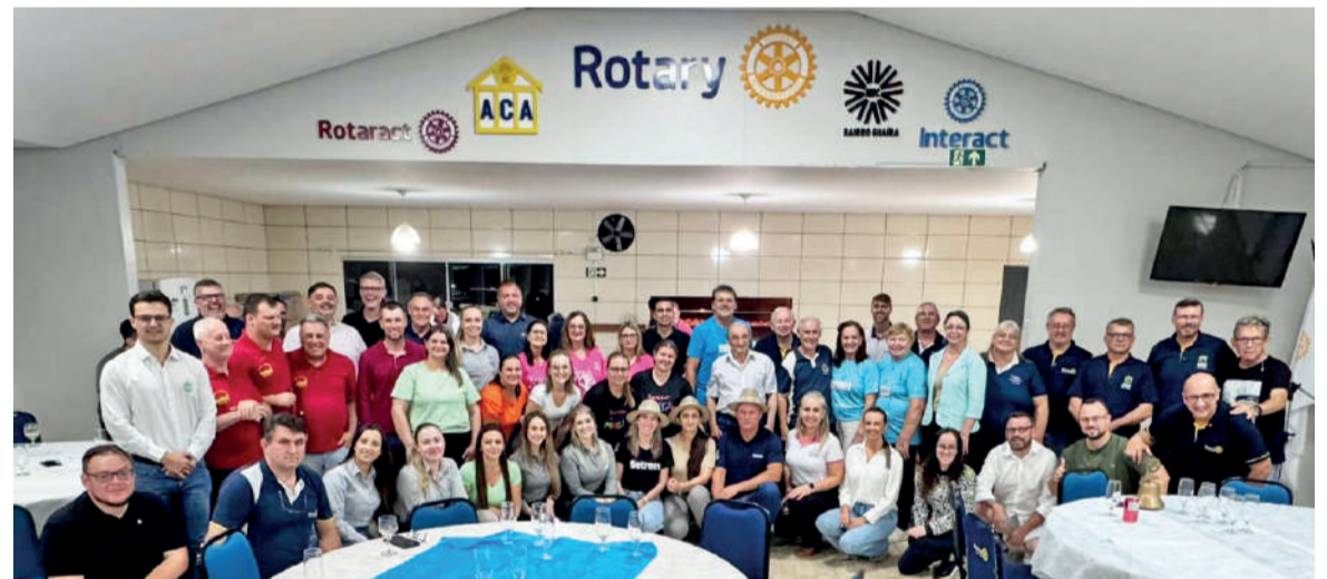
Representantes do Rotary Club de Três de Maio e integrantes das 18 entidades contempladas