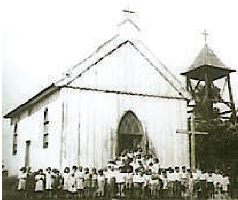
Registro da Igreja de Nossa Senhora da Saúde e moradores datada no ano de 1933