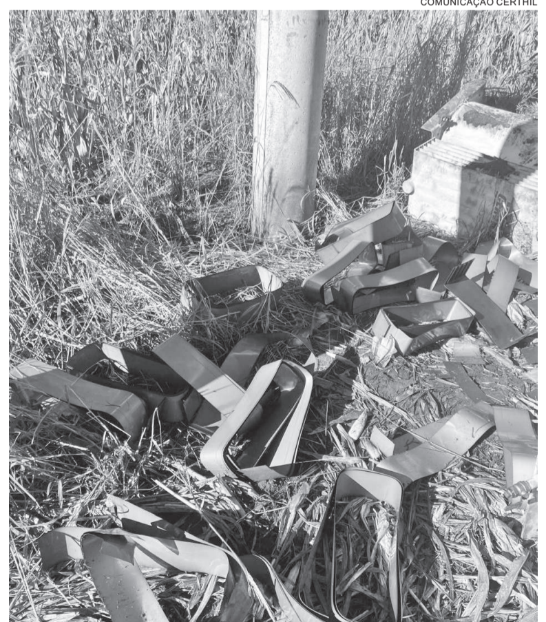
Furtos impactam nos custos operacionais do sistema que, futuramente refletem no valor das tarifas de energia, além de prejudicar o abastecimento aos consumidores

Ainda, a Certhil reforça que a colaboração da população é fundamental para auxiliar na identificação dos responsáveis e contribuir