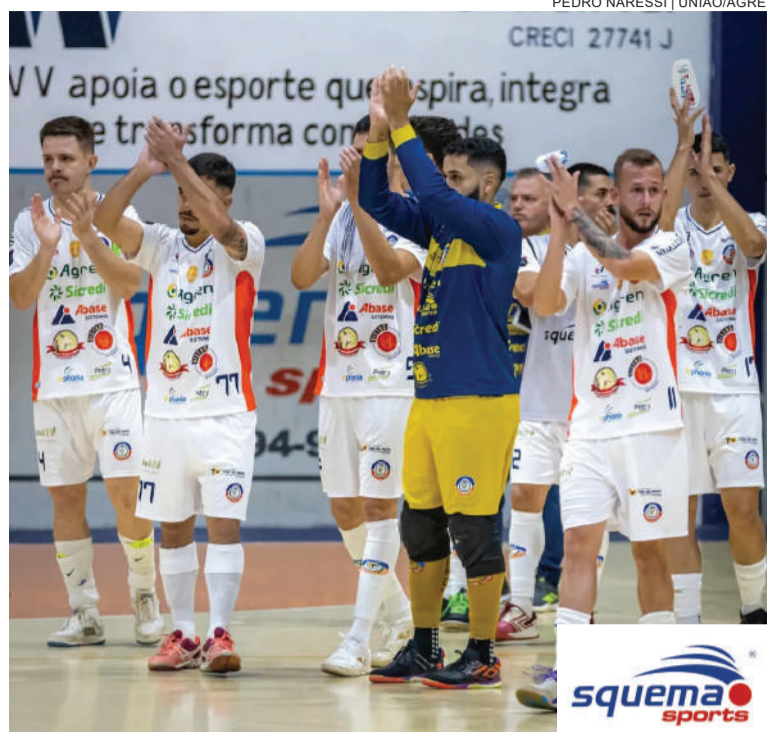
Na noite de sábado, União/Agren saiu derrotado do Ginásio da AABB pelo placar de 5 a 2. Jogo da volta é amanhã, em Uruguaiana