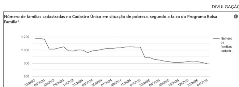
Número de famílias consideradas em situação de pobreza vem caindo ao longo dos anos em Três de Maio

ficativo de famílias em situação de vulnerabilidade. “Hoje, conforme a folha de pagamento de maio de 2026, são 907 famílias recebendo o Bolsa Família em Três de Maio. Ou seja, os números mostram uma redução em relação a 2023, mas ainda existe uma demanda importante de acompanhamento e apoio social às famílias do município”, finalizou.