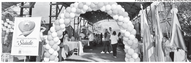
Evento foi realizado na Praça João Saffi

com a participação de empresas e entidades locais, fortalecendo o vínculo comunitário e ampliando o alcance das ações. O evento teve o apoio da Sicedi, SETREM e Cresol, que contribuíram para o fortalecimento da iniciativa.