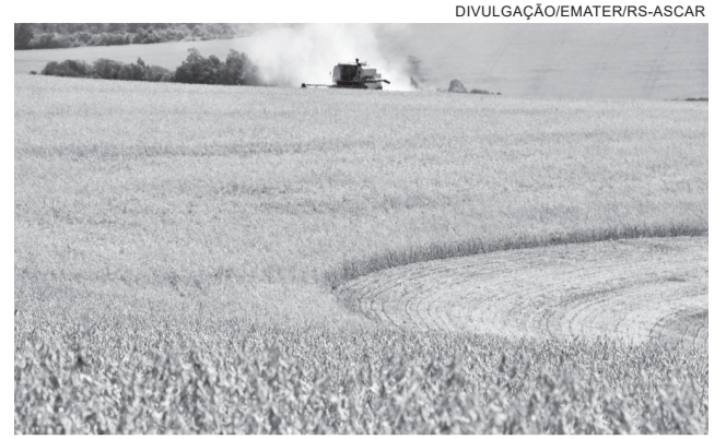
Colheita de soja se aproxima da fase final em Três de Maio

A soja safrinha praticamente não deve registrar perdas, porém, é uma safra que produz menos quilos por hectare. “As lavouras da soja safrinha apresentam um porte mais baixo, por vários motivos. Nesse ano o produtor atrasou a semeadura e, quanto mais tarde for a semeadura da soja safrinha, a planta perde em tamanho de desenvolvimento. Assim, as plantas têm um porte mais baixo, porém, a produção está dentro do esperado, que fica entre 25 a 40 sacas por hectare”, concluiu.