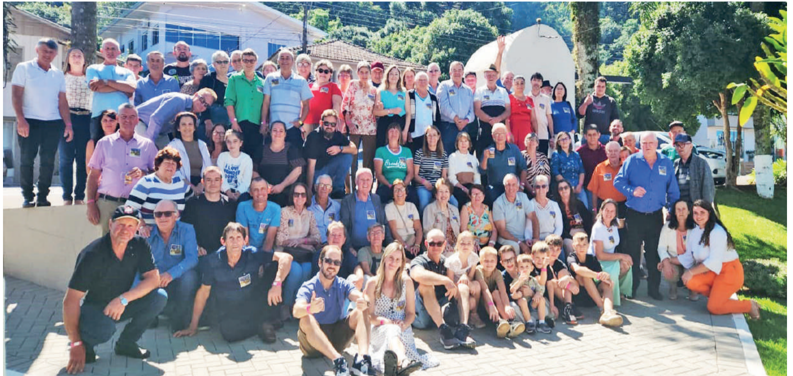
Próximo encontro será em Três de Maio, em março de 2027

Houve quem descobrisse primos que nem sabia que existiam e quem passasse o dia tentando entender como a 'semente' plantada por Karl Tesche, lá em 1859, em