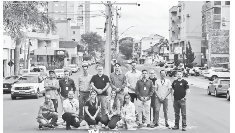
Um dos pontos instalados foi no entroncamento da Avenida Senador Alberto Pasqualini com a Avenida Buricá. No registro, representantes da empresa Nexus, das forças de segurança pública local e da Prefeitura de Três de Maio

SECRETARIA DE COMUNICAÇÃO DE TRÊS DE MAIO