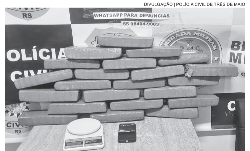
Operação resultou na apreensão de 22 tijolos de maconha em Três de Maio

ram o homem e o adolescente. O dono do bar, de 27 anos, que possuía uma tornozeleira eletrônica, também foi preso. No local, foram encontrados mais dez tijolos da droga, além de uma balança de precisão.