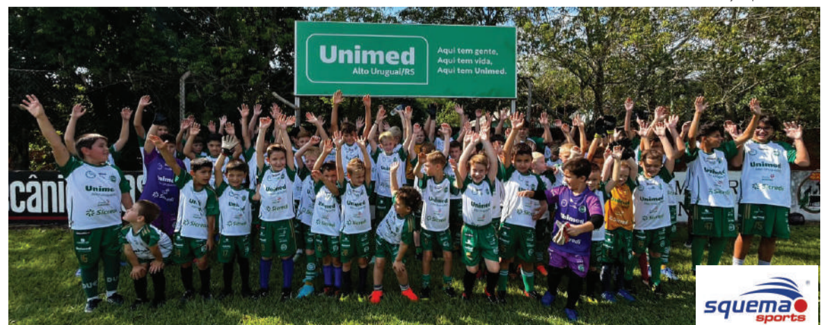
Categorias de base do Oriental receberam a doação de uniforme da Unimed Alto Uruguai RS