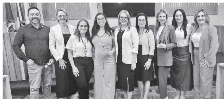
Lideranças da região participaram do evento de inauguração do novo espaço