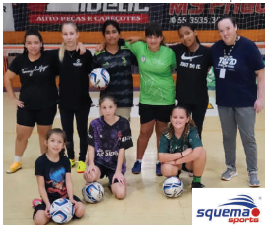
Registro do treino da última quarta-feira