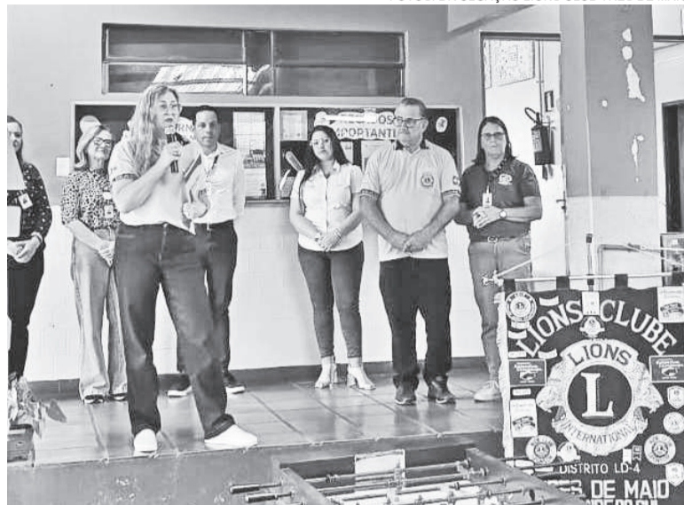
Entrega de premiações ocorreu no dia 9, na EMEF Frederico Lenz