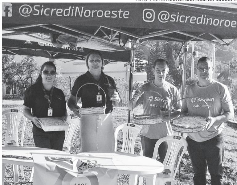
Ação em conjunto com Emater, Sicredi Confiança e Chás Erva da Mata distribuiu sementes de camomila e marcela na Sexta-feira Santa