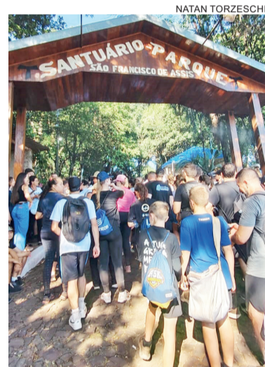
Fiéis foram recepcionados no Santuário Parque São Francisco de Assis