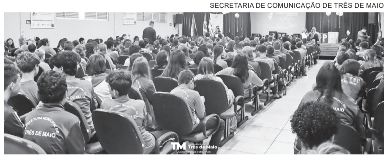
SECRETARIA DE COMUNICAÇÃO DE TRÊS DE MAIO

Atividade reuniu professores e alunos da rede municipal