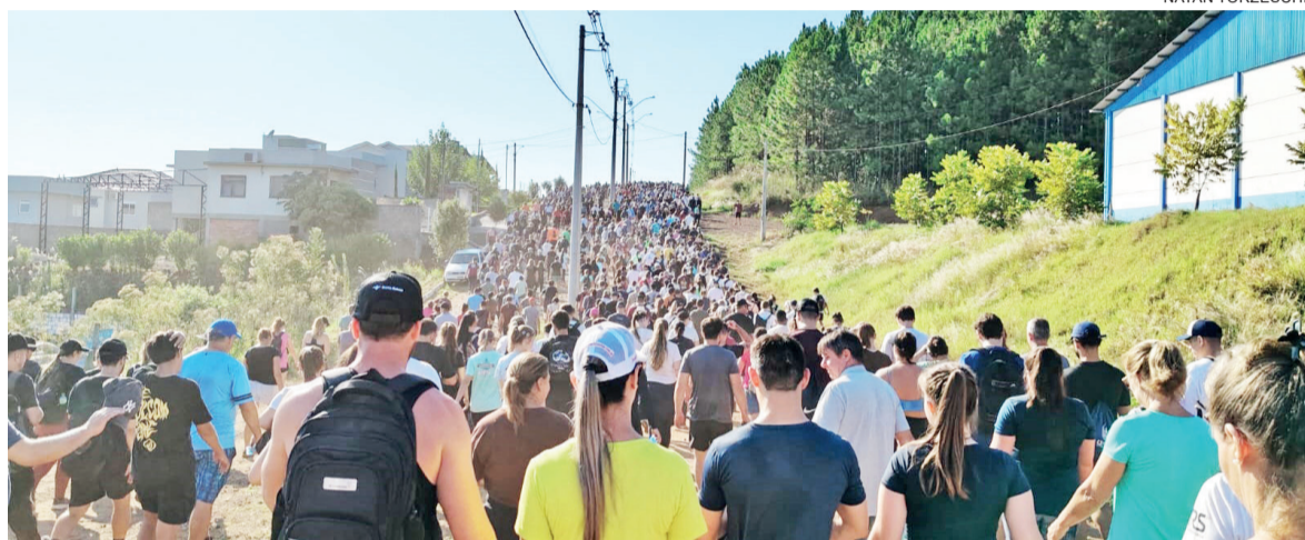
Centenas de fiéis percorreram o trajeto entre Três de Maio e São José do Inhacorá na Sexta-feira Santa