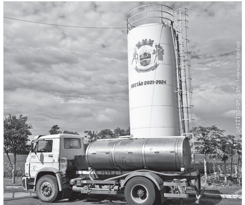
Abastecimento de água em Santo Antônio do Inhacorá

A soja concentra os maiores prejuízos com estimativa de redução de 45% na produtividade em relação à projeção inicial, o que representa cerca de 60 mil sacas que deixam de ser colhidas. O impacto econômico é de cerca de R$ 7,14 milhões a menos.