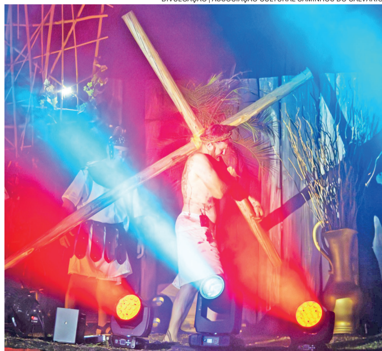
Encenação da Paixão e Morte de Jesus Cristo foi marcada de muita emoção