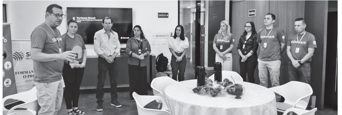
Café com os integrantes do Grupo Caminhos do Tempo contou com uma explanação da equipe da Sicredi Confiança sobre linhas de crédito e serviços da cooperativa voltados ao setor do turismo rural

Na segunda-feira (6), a Sicredi Confiança foi sede um Encontro com o grupo de turismo Caminhos do Sabor, Amor, Sabor e Tradição. O evento foi realizado pelo Sindicato Rural de Três de Maio, Senar RS, Sicredi Confiança e Prefeitura de Três de Maio, por meio da Secretaria da Cultura e Turismo.