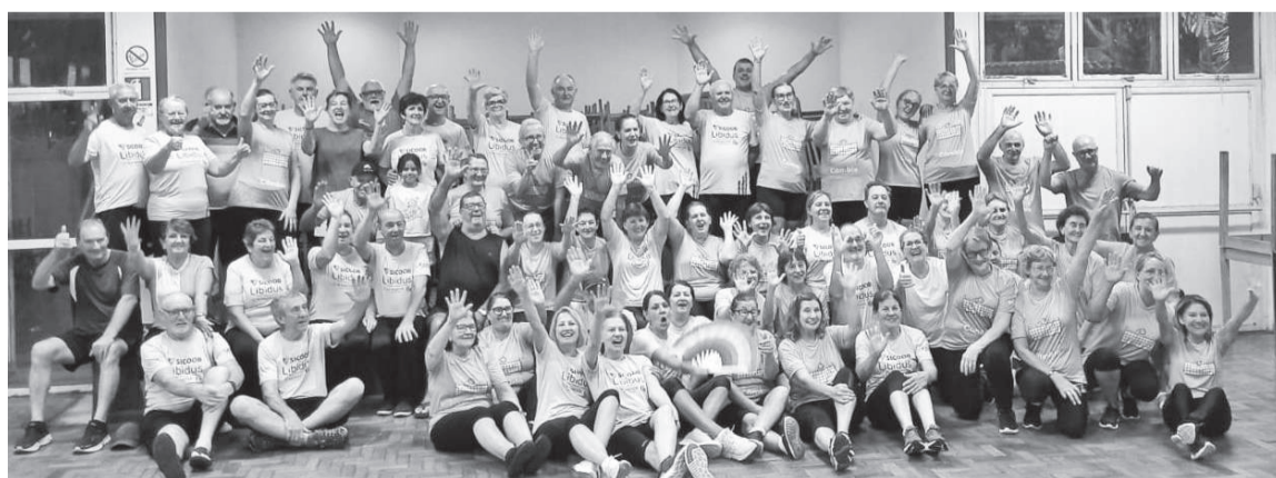
Encontro reuniu atletas dos grupos de Três de Maio e Santo Cristo

Confraternização reúne equipes de câmbio de Três de Maio e Santo Cristo