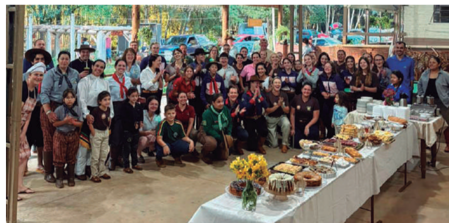
No domingo pela manhã, o Balneário Cascatinha — integrante da rota do turismo rural de Três de Maio — ofereceu um delicioso café colonial para mais de 90 pessoas, proporcionando mais um momento especial de integração entre as participantes