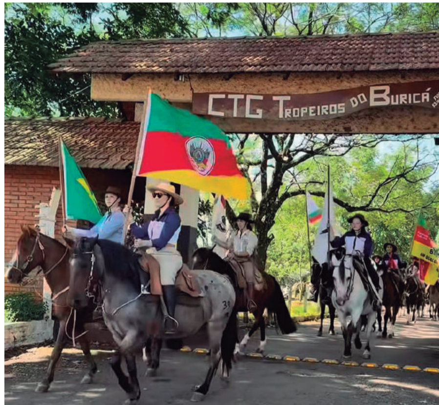
Cavalgada reuniu mais de 60 cavaleiras, integrantes da 20ª Região Tradicionalista