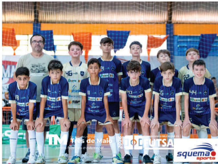
ASR, equipe campeã da Categoria Sub-13