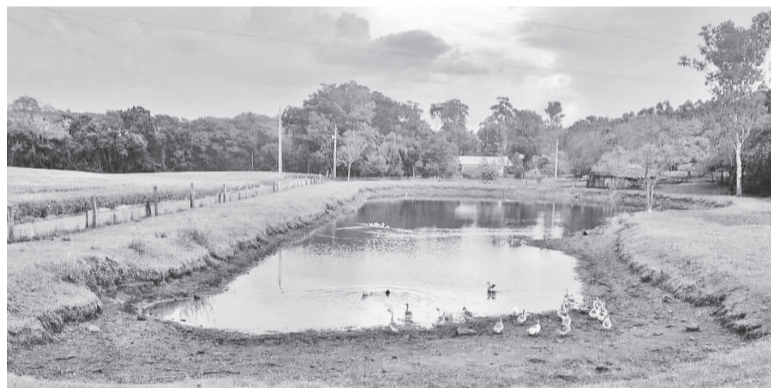
Na localidade de Caneleira, açude registra nível baixo de água

Foram adquiridos encanamentos, bombas hidráulicas e demais suportes para a instalação de um novo poço para abastecimento de água potável em Lajeado Lamberdor, o que aumentou em 95 m³/dia seu abastecimento. Além disso, foi possível fazer a abertura, limpeza e ampliação de tanques e açudes para abastecimento e dessedentação animal em 63 propriedades rurais.