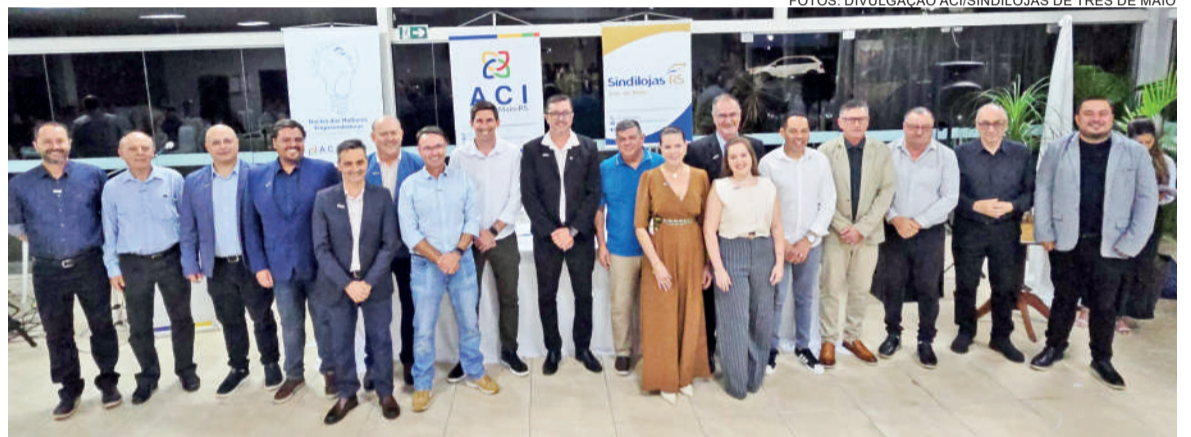
Integrantes da diretoria da ACI, presentes na posse