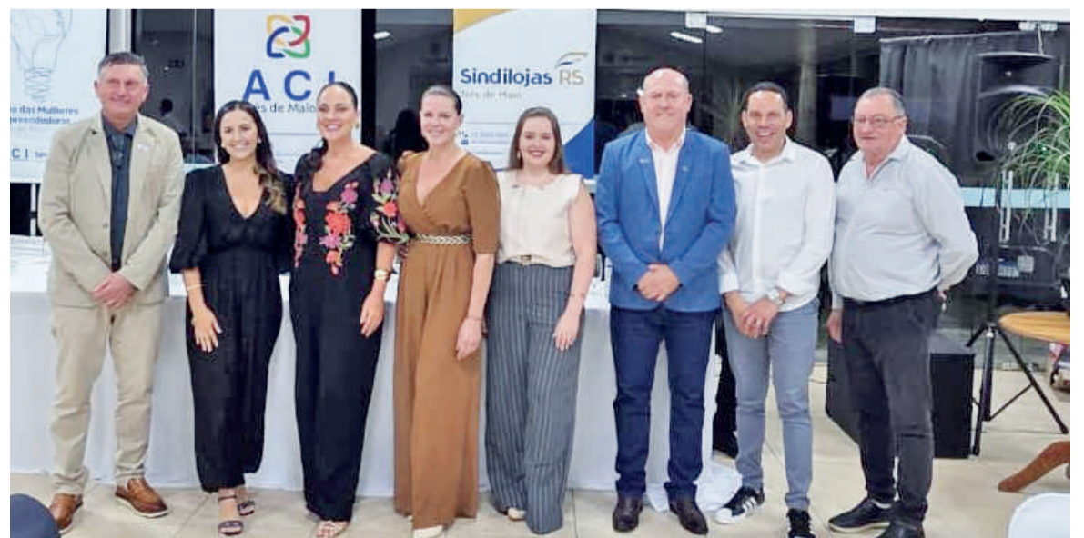
Integrantes da diretoria do Núcleo das Mulheres da ACI, presentes na posse