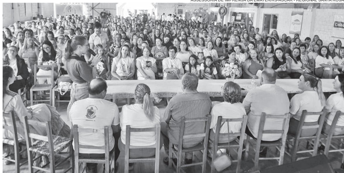
Mulheres participaram de momentos de reflexão pela manhã

Mais de 600 mulheres participaram da 29ª edição do Encontro Municipal de Mulheres de Independência, realizado no último sábado (7), na Esquina Budel. O evento contou com uma programação voltada à integração, reflexão e fortalecimento dos vínculos comunitários.