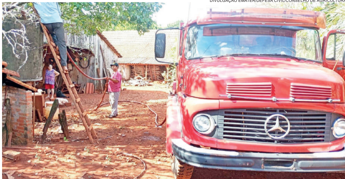
Em comunidades do interior, como Quaraízinho, famílias que enfrentam falta de água potável estão sendo abastecidas por caminhão pipa da prefeitura