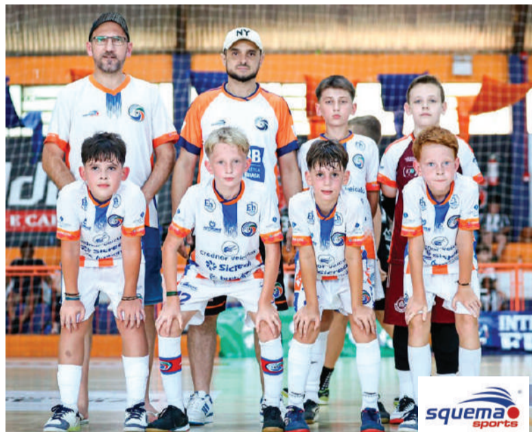
Crednor Futsal Branco, equipe campeã da Categoria Sub-11