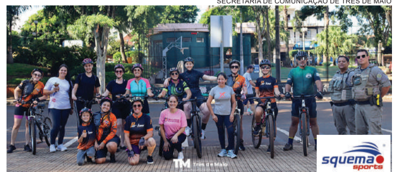
2ª Rota Ciclo Bike Pedal das Mulheres percorreu trajeto na cidade de Três de Maio na manhã do último domingo

A rota iniciou às 6h30, em frente ao Palácio Municipal, de onde as participantes deram a largada ao trajeto. O percurso seguiu em direção à Setrem. Durante o trajeto, o grupo foi recepcionado pelo CTG, em uma parada marcada pela acolhida e pela confraternização entre as participan-