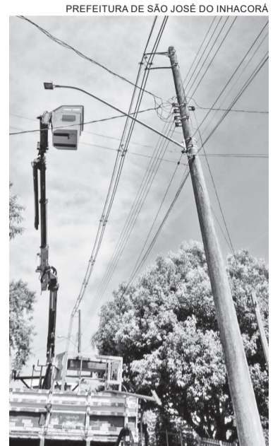
Equipes estão trabalhando para a substituição das lâmpadas antigas por luminárias de LED

Além disso, foi aprovada uma ampliação de 152 pontos, contemplando também as localidades de Ponte Alta, Mato Queimado, Esquina Wunsch e Santo Antônio do Inhacorá, além de outros pontos estratégicos da cidade. “A iniciativa visa não apenas a redução do consumo de energia elétrica, mas também a melhoria da qualidade de vida e o reforço da segurança pública através de uma iluminação mais