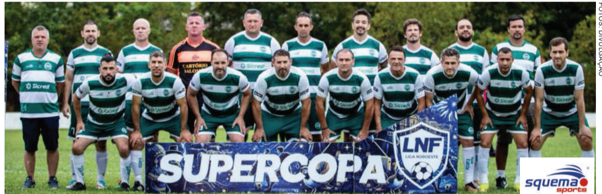
Equipe do Oriental Futebol Clube que disputa a Supercopa dos Campeões 40+

Na primeira fase, as equipes jogam entre si, dentro dos grupos. Os dois primeiros colocados garantem vaga direta para as semifinais. Já os times que terminarem em 2º e 3º lugares disputam uma partida de quartas de final para definir quem avança à semifinal.