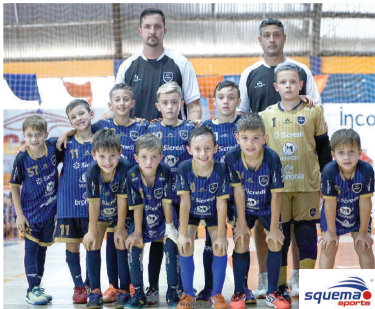
ASR, equipe campeã da Categoria Sub-9