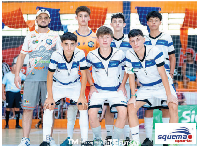
Crednor Futsal Azul, equipe campeã da Categoria Sub-15

Confira as classificações no box ao lado.