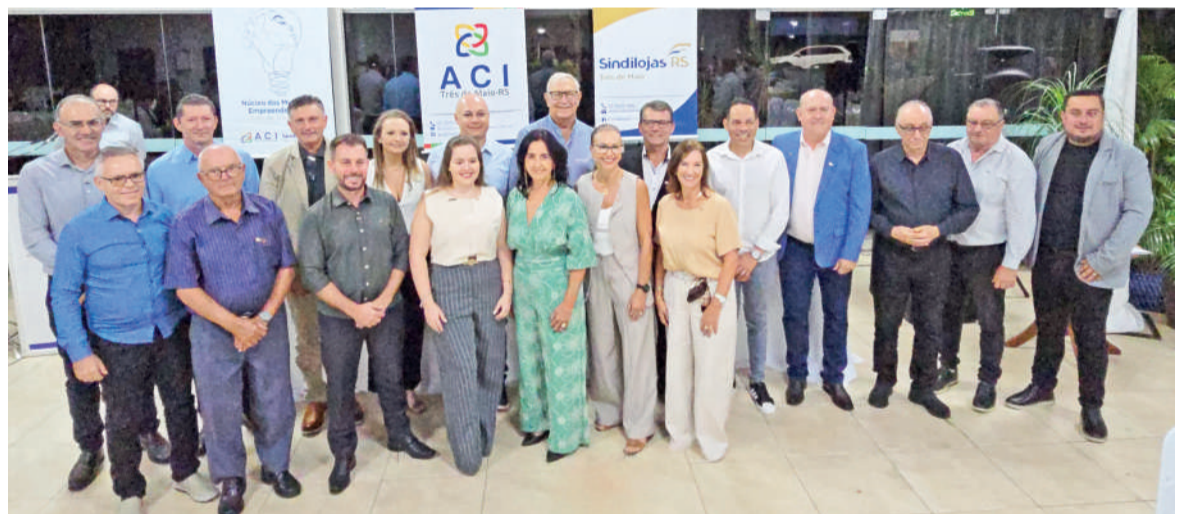
Integrantes da diretoria do Sindilojas, presentes na posse