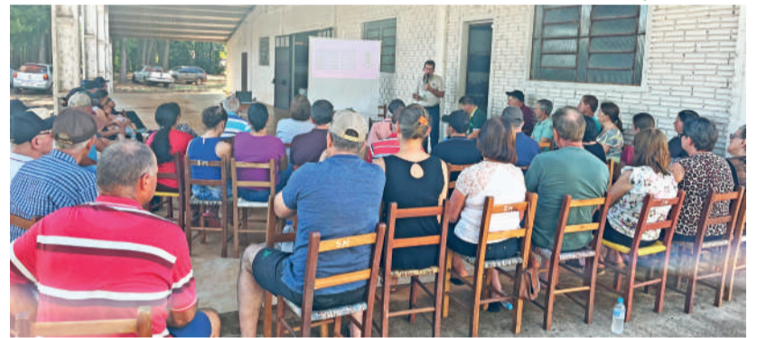
Pré-assembleia realizada em São Miguel, Independência. Em todos os encontros foram registradas 568 participações, 9% a mais que em 2025

LOCALIDADES ONDE OCORRERAM AS PRÉ-ASSEMBLEIAS DA CERTHIL Londero, Barra Mansa Alta, Lajeado Santos, Lajeado Seco, Lajeado Limoeiro, Lajeado Bordado, Barra Funda, Cascatinha, São Pedro, Cerro Alto, Sete de Setembro, Linha Ilha, Balneário Tio João, KM 13, Restinga Seca, São Miguel, Lajeado Martins, Colônia Medeiros, Vila Progresso, Santo Antônio e Caúna Baixa.