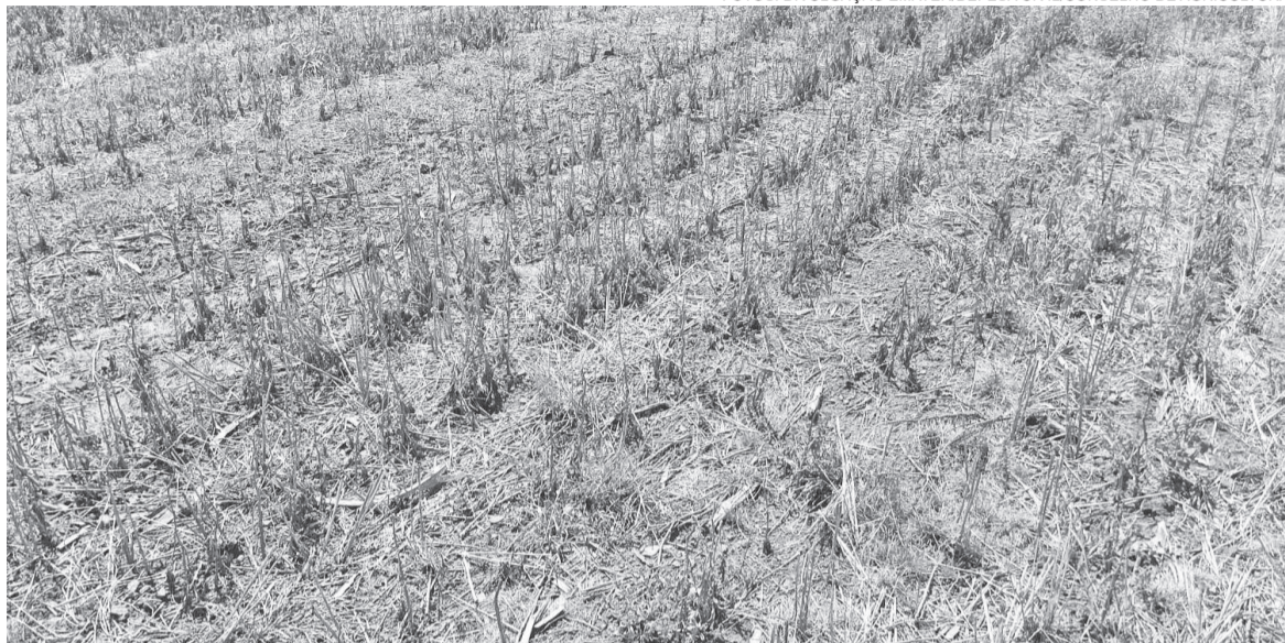
Lavoura na localidade de Nossa Senhora de Lurdes registra perdas irreversíveis em decorrência da falta de água