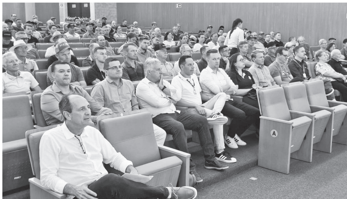
A pré-assembleia na região Noroeste foi realizada no auditório da Sicredi de Três de Maio

A região conta com 213 funcionários e capacidade de armazenagem de 3.394.000 sacas.