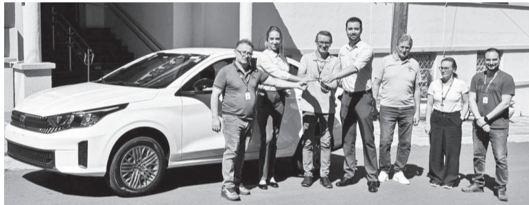
Pela primeira vez a Secretaria do Trabalho, Ação Social e Habitação terá um veículo exclusivo para atendimentos