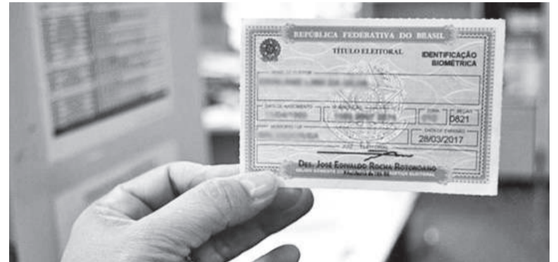
Para votar nas eleições de outubro, eleitores precisam regularizar sua situação até o dia 6 de maio

Através do site do TSE também é possível consultar a sua si-