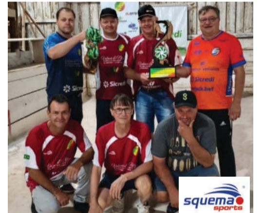
Esquina Bado conquista o 3º lugar