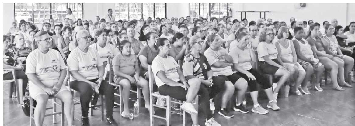
Nos encontros são apresentados hábitos saudáveis para a prevenção de doenças e equilíbrio emocional e os impactos positivos da convivência em grupo, como fortalecimento da autoestima e dos vínculos sociais

De acordo com a Administração Municipal, o programa integra a estratégia de atenção básica, com foco na prevenção, no cuidado integral e no fortalecimento dos vínculos sociais. A proposta é ampliar a participação ao longo de 2026 e consolidar o movimento como espaço permanente de promoção da saúde no município.