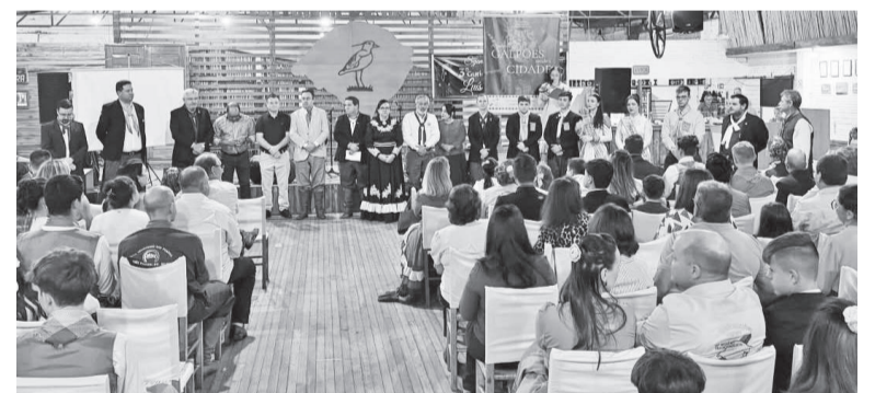
Atividade reuniu lideranças do tradicionalismo gaúcho em Independência

Evento será realizado em Santa Maria no mês de abril