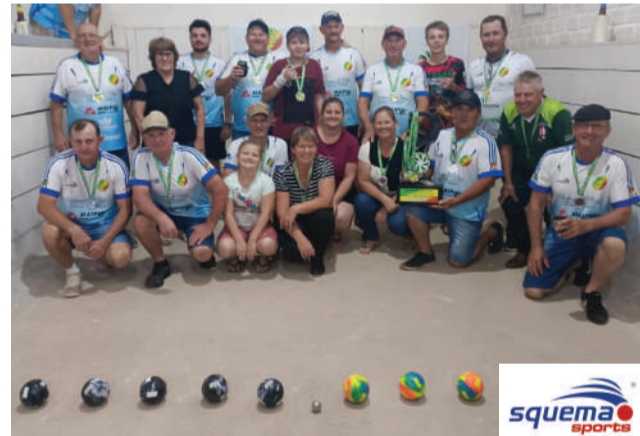
A equipe de Manchinha fica com o vice-campeonato

Ontem ocorreu mais uma rodada da Categoria Livre. No dia 12 será realizada a 5ª rodada, que encerra a primeira fase e define os classificados.