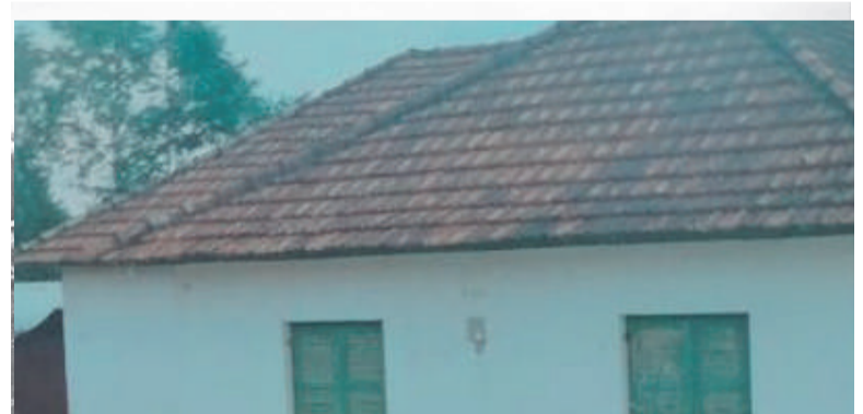
Primeira sede da Cooperativa Agrícola Mista São Caetano