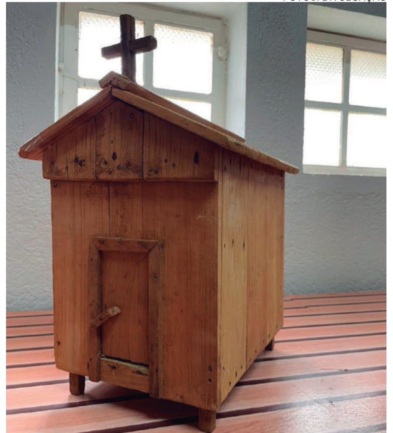
Réplica da primeira capela construída na comunidade

E assim a família fez. Por alguns dias, o fogo foi aceso e a não ouviram mais nada. Ao ficar sabendo que não ouviram mais os uivos do tigre, o gerente disse: "Se vocês conseguiram mandar embora o animal, eu já deixo para o lugar o nome de Lajeado Tigre".