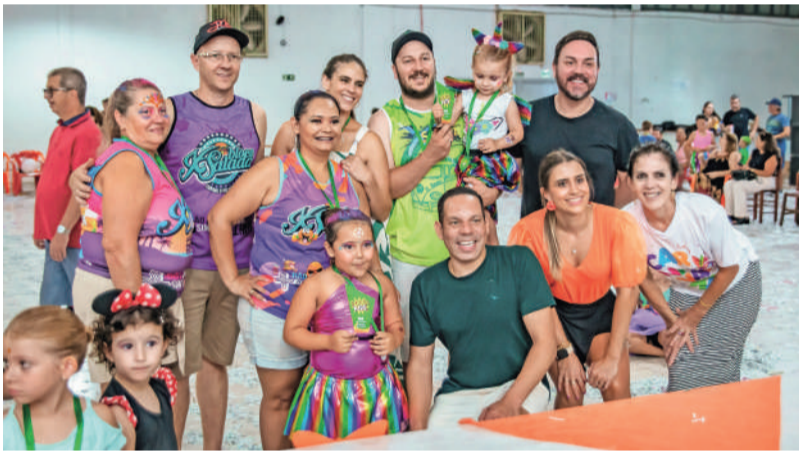
Bloco Xis Salada, da Família Muller, levou duas premiações nas categorias "Fantasia em Família" e "Bloco Família"