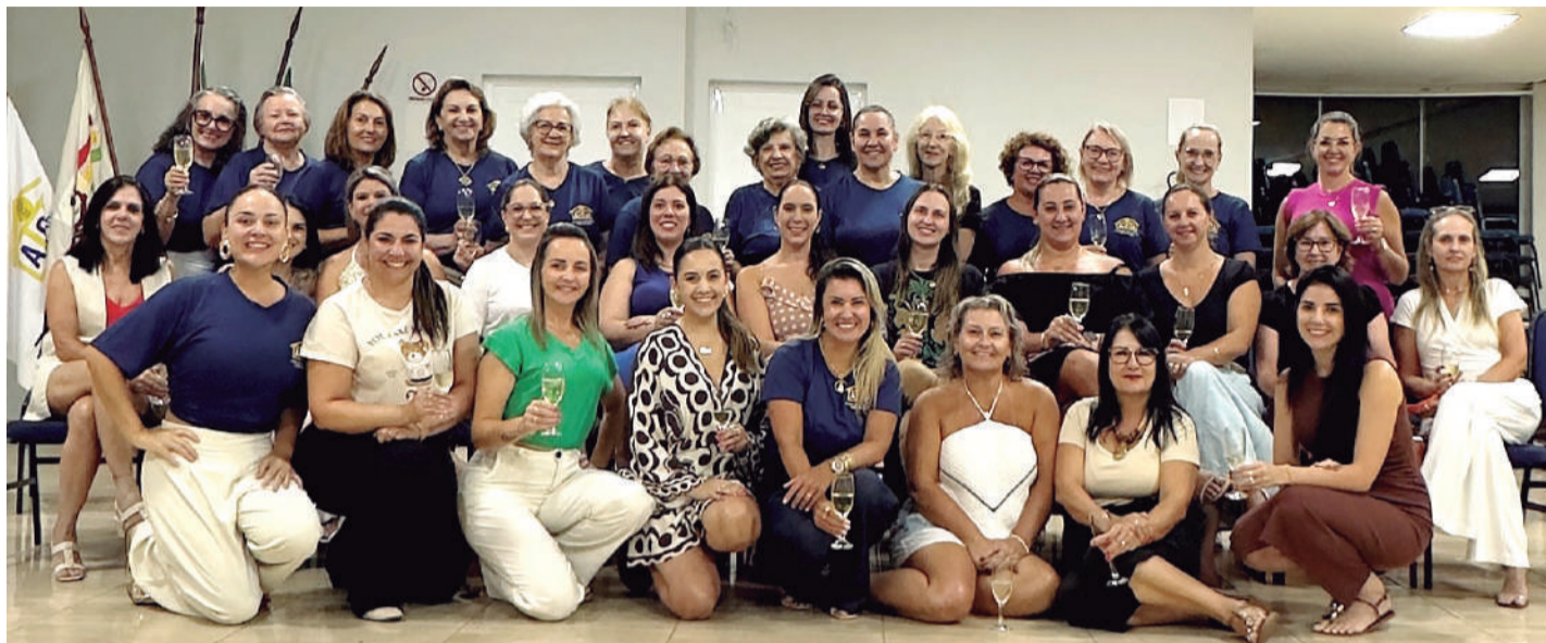
Na terça-feira, as patronesses foram recebidas pelas senhoras da Casa da Amizade para um momento de confraternização

Recursos arrecadados serão revertidos para projetos sociais realizados pelo clube de serviços