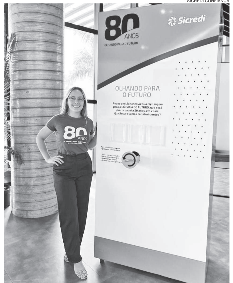
Na cápsula do tempo, associados podem registrar suas memórias, sonhos e expectativas para as próximas décadas. Recipiente será aberto em 2046, ano em que a cooperativa completa 100 anos