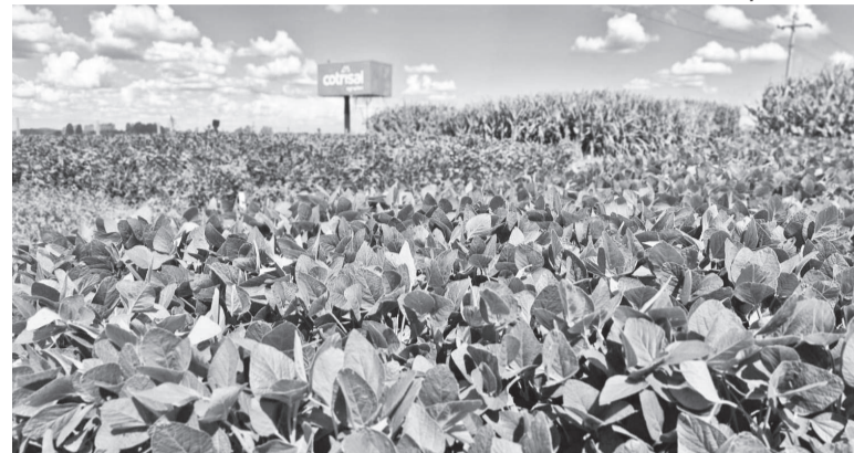
Campo Experimental da Cotrisal apresentará soluções testadas, validadas e comprovadas aos associados da cooperativa

O investimento em infraestrutura de ponta, como a nova unidade de armazenagem na região noroeste, complementa o tripé que sustenta o melhor retorno financeiro do setor: ciência aplicada + gestão sólida + estrutura estratégica.