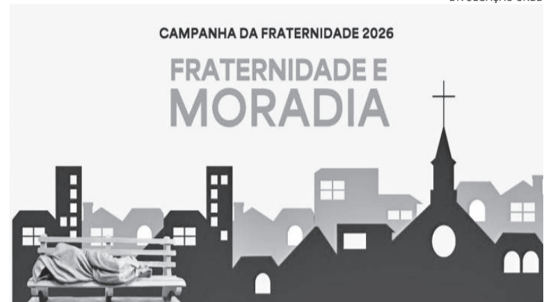
Campanha convida cristãos a refletirem sobre a realidade habitacional no país

Conforme a Conferência Nacional dos Bispos do Brasil (CNBB), a proposta convida os cristãos a refletirem sobre a realidade habitacional do país. Embora a moradia digna seja um direito garantido pela Constitui-