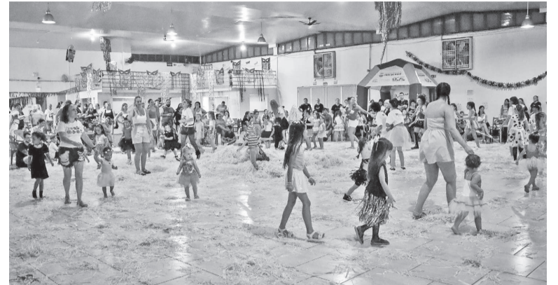
Carnaval Infantil voltou a ser realizado no ano passado

O evento terá a escolha da rainha com inscrições gratuitas para crianças fantasiadas. O desfile poderá ocorrer de forma individual, em duplas ou em pequenos grupos. A avaliação levará em conta critérios como simpatia, criatividade e