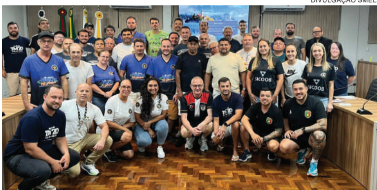
Formação reuniu cerca de 50 profissionais da área