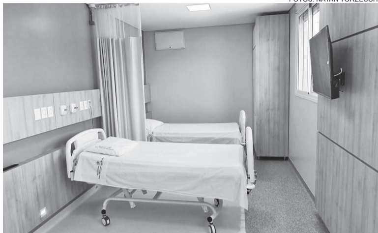
Primeiros quartos foram inaugurados na semana passada

Segundo Gehwer, as doze reformas demandam de R$ 866 mil. O HSVP já alcançou quase R$ 300 mil. “Nesta semana iniciam as obras de mais duas reformas. Temos uma empresa que já aderiu