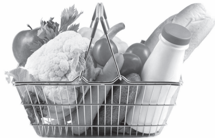
Alimentos da cesta básica, como aves e ovos, cereais e leguminosas, laticínios e frutas, tiveram a maior redução de preços durante o ano passado

As hortaliças também tiveram leve alta no período. Em contrapartida, houve recuo expressivo