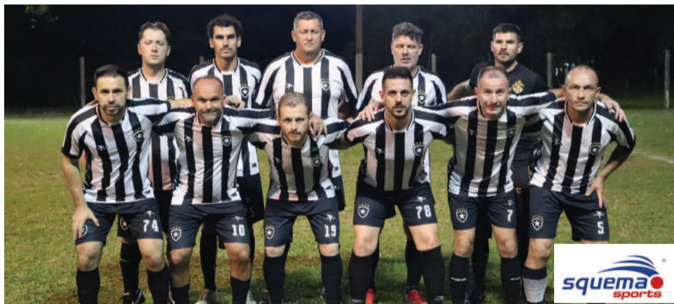
Equipe de Veteranos do Botafogo que disputa o campeonato