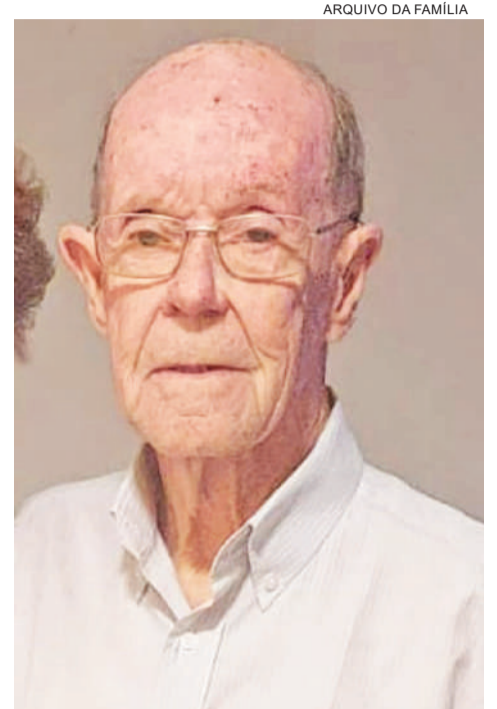
ARQUIVO DA FAMÍLIA