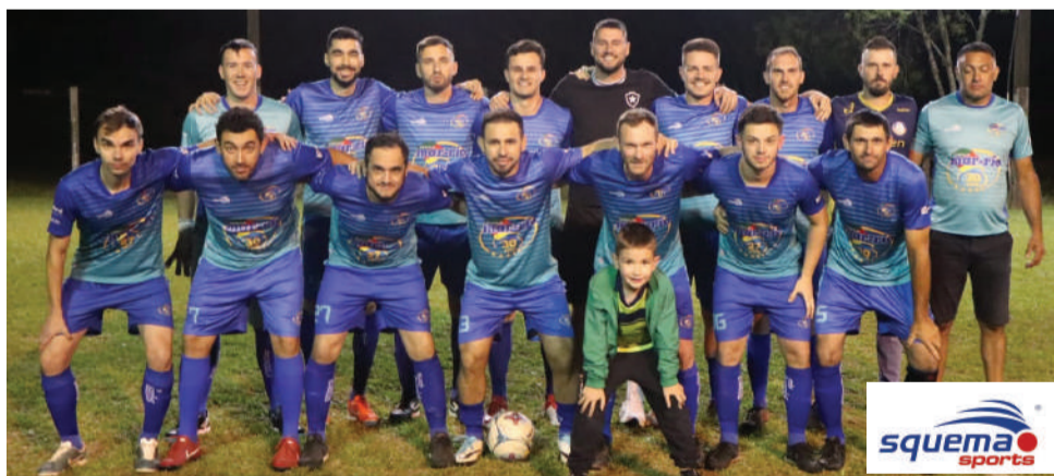
Mar-Rio/Invencíveis/Crednor vai em busca do título na noite desta sexta-feira