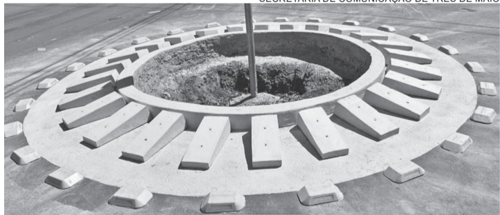
SECRETARIA DE COMUNICAÇÃO DE TRÊS DE MAIO

NOVA RÓTULA – Foi ajustada a rótula no cruzamento da Avenida Pasqualini com a Avenida Buricá, em Três de Maio. O trânsito ficou mais organizado e com maior fluidez. A visibilidade para motoristas aumentou, as conversões ficaram mais seguras e os pontos de risco foram reduzidos, também beneficiando pedestres e ciclistas. Outras mudanças estão no radar da Secretaria de Gestão Urbana e Meio Ambiente.