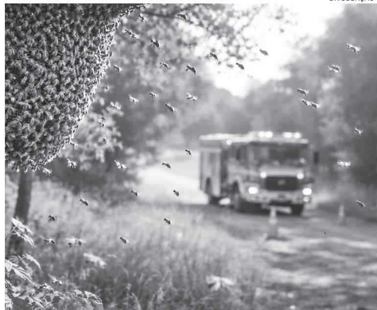
Em 2026 já foram registradas quase 30% das ocorrências envolvendo abelhas, vespas, e marimbondos do ano anterior em Três de Maio

O CIT também presta informações específicas à comunidade leiga em relação à prevenção, primeiros socorros e medidas ou manobras que possam minimizar o efeito de qualquer exposição a um agente tóxico, até o atendimento de um profissional de saúde pelo telefone: 0800.721.300, com plantão 24 horas/dia.