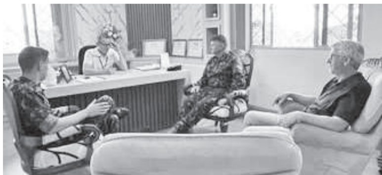
Encontro ocorreu no Gabinete do Prefeito