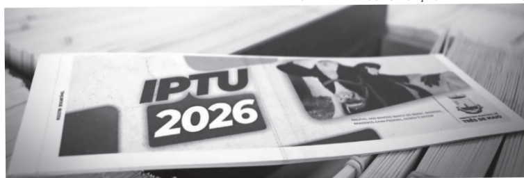
SECRETARIA DE COMUNICAÇÃO DE TRÊS DE MAIO

Outros prazos de vencimentos, confira na última página desta edição.