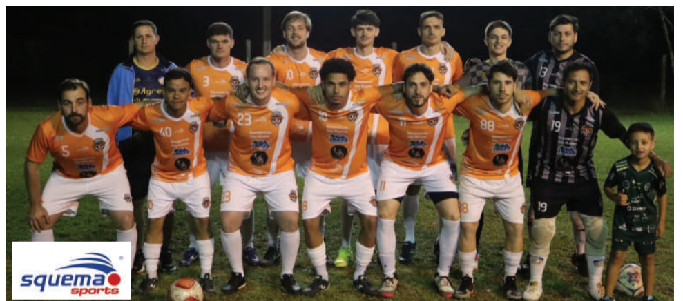
Turma dos Sábados/Sultrucks é a atual bicampeã da categoria Livre