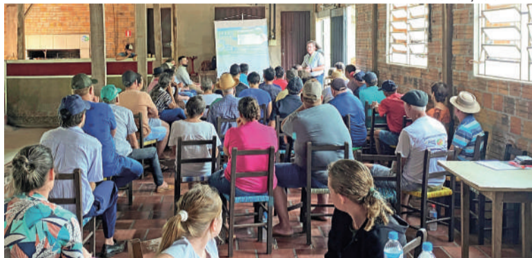
Associados poderão participar de encontros para compartilhar opiniões e tirar dúvidas

A Certhil inicia suas Pré-Assembleias no dia 18 de fevereiro, com encontros que ocorrerão até 6 de março, em 21 localidades espalhadas por 11 municípios da região Noroeste do Estado. Este é o momento em que os cooperados têm a oportunidade de participar ativamente, compartilhar suas opiniões e tirar dúvidas.