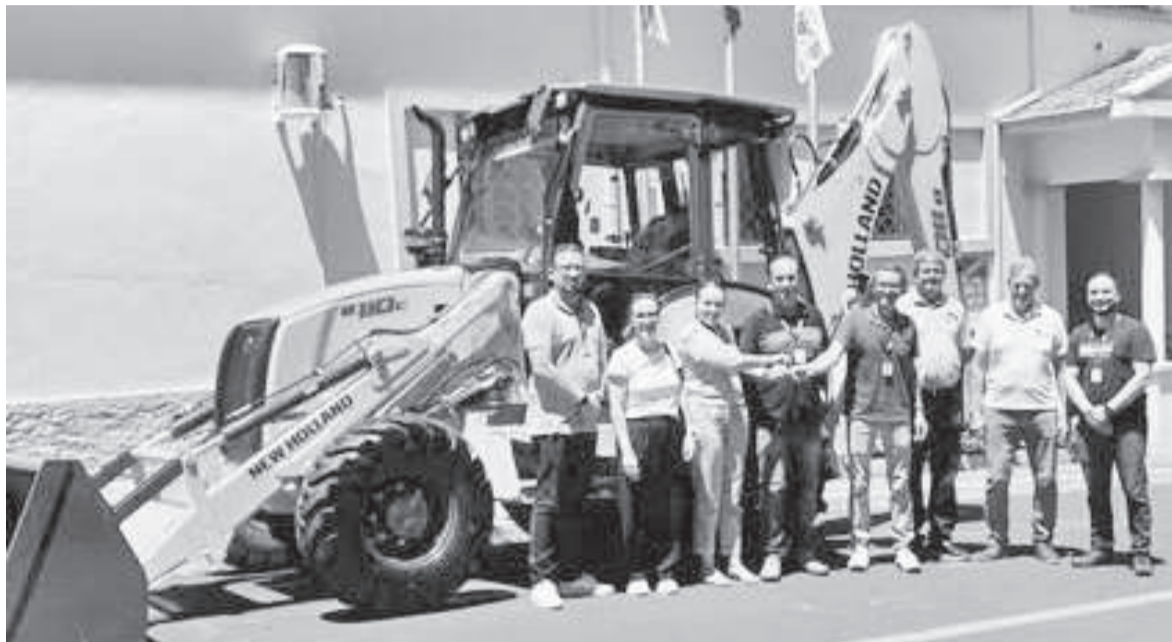
Retroescavadeira foi adquirida pelo valor de R$ 439 mil e está disponível para uso desde o dia 22 de janeiro