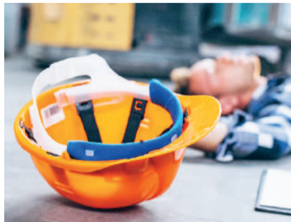
É o segundo ano consecutivo de queda de acidentes de trabalho em Três de Maio

Em nível de Brasil, mais de 4,12 milhões de trabalhadores tiveram que se afastar temporariamente de suas funções, no Brasil, em 2025, por motivos de saúde. Contabilizado