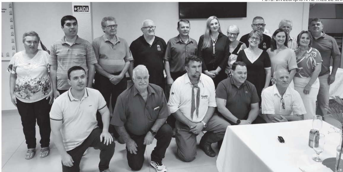
Diretoria da APAE de Três de Maio empossada para 2026/2028