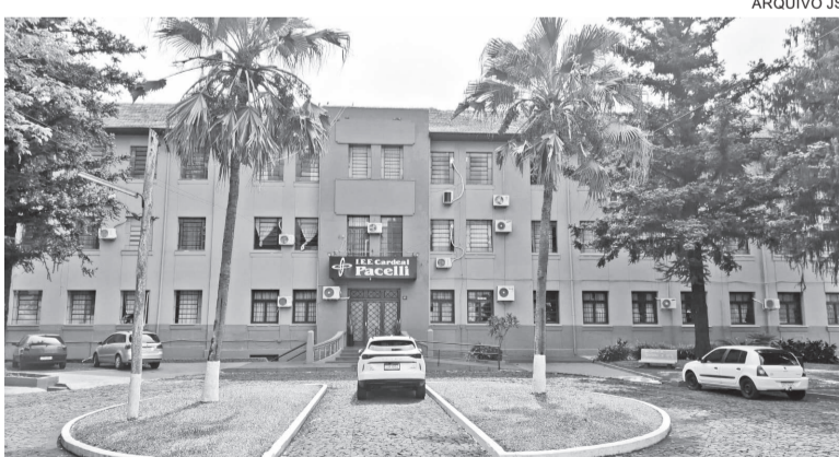
Núcleo de Inovação para o Trabalho do IEE Cardeal Pacelli está há mais de três anos promovendo cursos para qualificação no mercado de trabalho

As formações integram o Núcleo de Inovação para o Trabalho (NIT), iniciativa do Governo do Estado, implantada no IEE Cardeal Pacelli há mais de três anos, com foco na promoção da inserção qualificada no mercado de trabalho. Ao longo desse período, os cursos