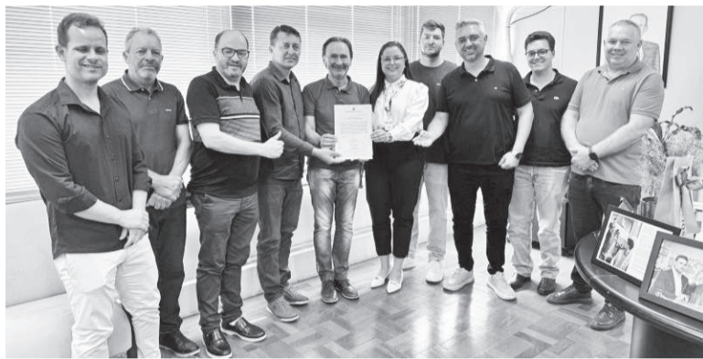
Representantes do projeto de Alegria compareceram à sede da Selt

governo estadual que busca fortalecer a malha viária por meio de parcerias com a iniciativa privada, que