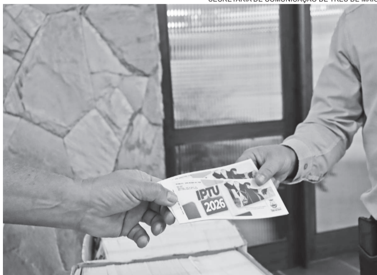
Comunidade pode retirar os carnês impressos do IPTU na prefeitura