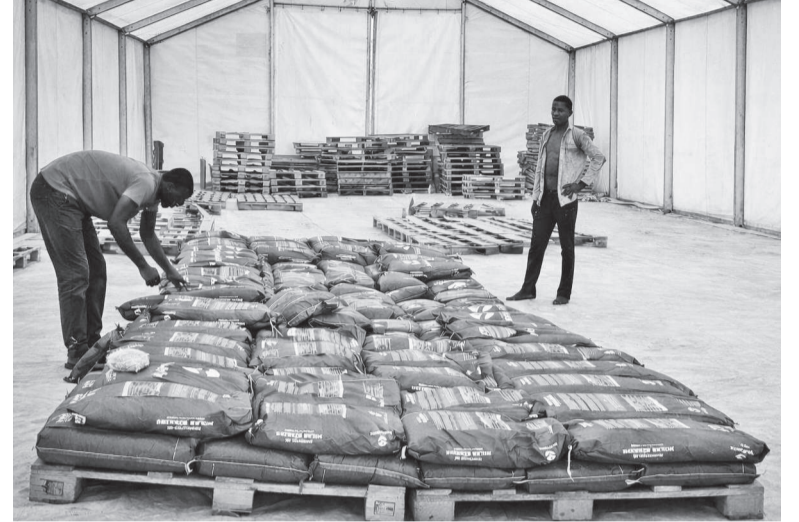
Empresa é voltada à exportação de rações e sementes de milho

A empresa FarmFeed Company Exportação e Importação LTDA, que pertence ao Grupo Farm, realizou sua primeira exportação internacional direta para a Angola. Conforme informações da Secretaria de Comunicação, o Grupo Farm foi selecionado pelo Governo Municipal de Três de Maio, por meio da Secretaria de Desenvolvimento Econômico, via Chamamento Público nº 046/2025, para a cessão de uso de um pavilhão municipal localizado no Parque Empresarial II. O espaço é destinado à incubação de empresas, conforme a Lei de Incentivo nº 2.937/2016, com foco na promoção do desenvolvimento econômico e na geração de novas oportunidades de negócios no município.