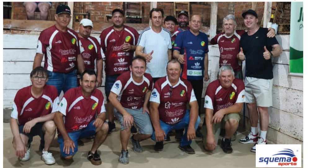
Equipe de Esquina Bado na competição