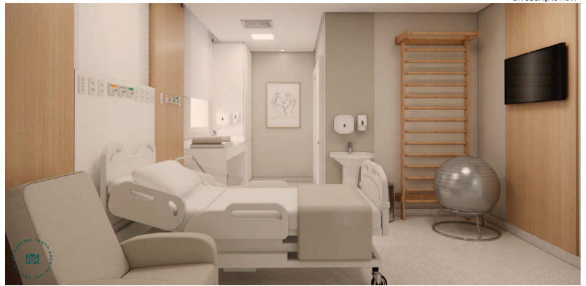
Quarto da maternidade

Com o recurso do Mãos Dadas, o hospital irá adquirir mobiliário e equipamentos humanizados, entre eles, banheiras para parto humanizado, poltronas de amamentação, camas hospitalares, berços, armários e cadeiras de espera, com objetivo de transformar o ambiente da maternidade, garantindo às gestantes dignidade, acolhimento e conforto durante o parto e nascimento.