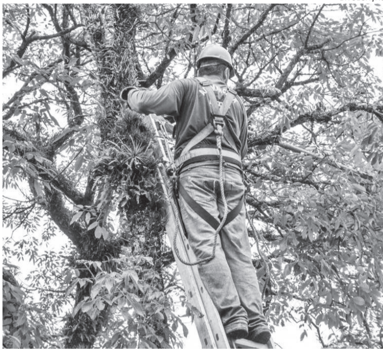
Cronograma de podas está sendo organizado pela Secretaria de Gestão Urbana e Meio Ambiente e deve ser divulgado depois do fim de março

Foi publicada no Diário Oficial da União de terça-feira (23) uma lei que autoriza a poda ou o corte de árvores, em locais públicos ou em propriedades privadas, se o órgão ambiental não atender ao pedido de retirada de vegetação por risco de acidentes. A Lei 15.299 permite, nesses casos, a contratação de profissional habilitado para a execução do serviço.