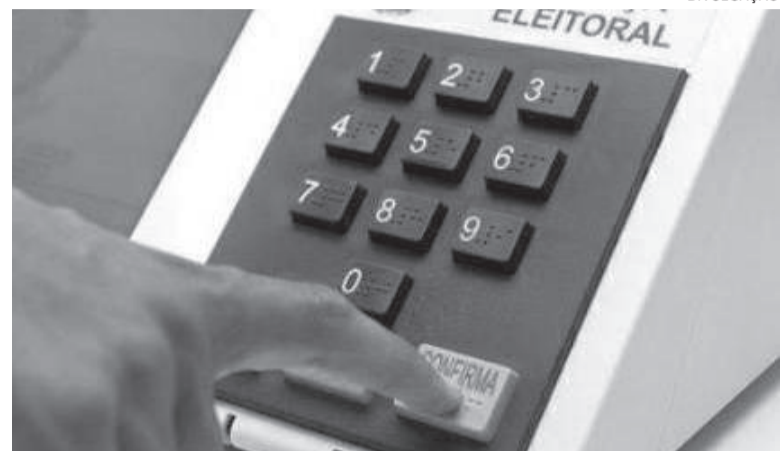
Calendário eleitoral traz série de prazos que devem ser observados por eleitores, partidos e possíveis candidatos ao longo de 2026

Eleitor votará para escolher deputado estadual e federal, dois senadores, governador e presidente da República