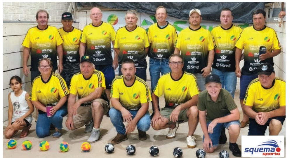
Equipe de São Roque no campeonato