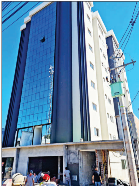
Edifício Mariana - Horizontina