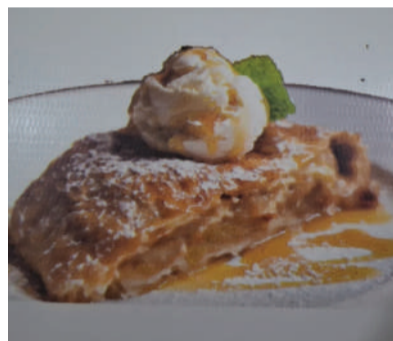
O strudel (torta de maçã) é servido com sorvete