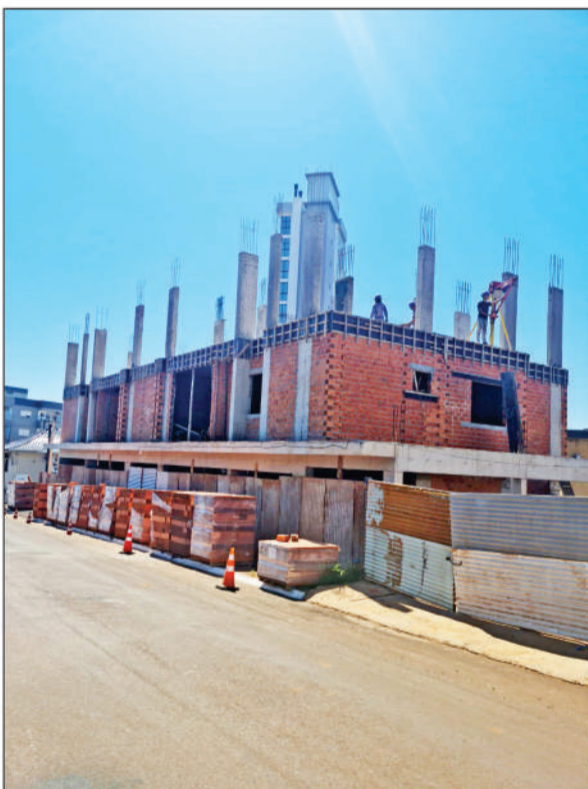
Edifício Martins - Três de Maio