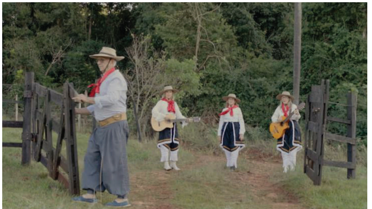
Um dos cenários da gravação do clipe musical Voltei pra Querência

Apesar de a família do pai ser vinculada à música, havia uma resistência para Marli estar no