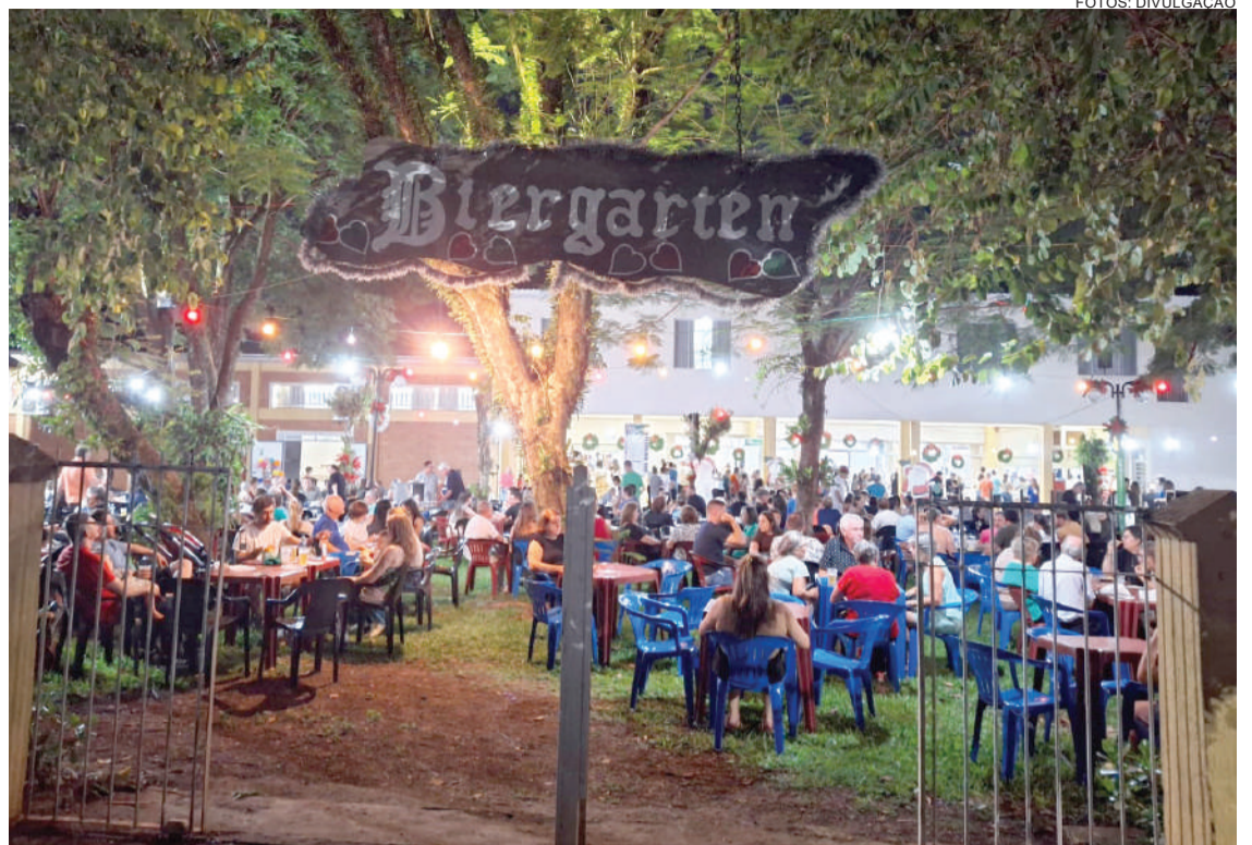
Anualmente, o Jardim da Cerveja recebe um grande público de Três de Maio e região, que vem para degustar os pratos típicos da gastronomia alemã