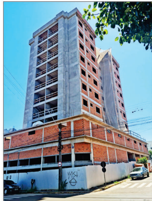
Edifício Cauna - Três de Maio