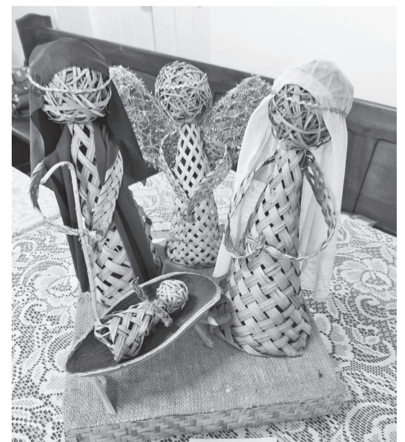
Outro presépio que chamou a atenção foi confeccionado por Neiva da Rosa, de Giruá. As peças foram produzidas com palha de butiá, com técnica de trançado