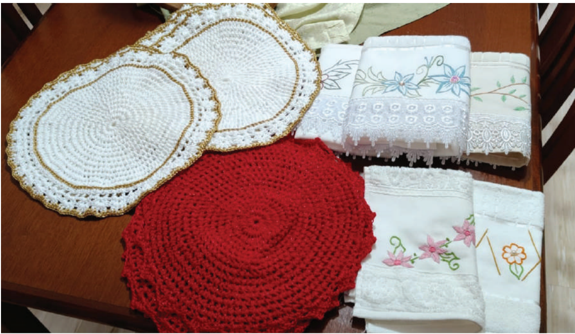
Gertrudes usa toda a sua criatividade em seus bordados e peças de crochê