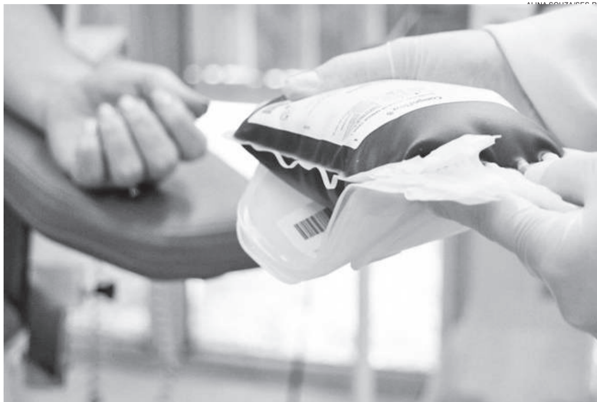
Doação regular de sangue é fundamental para que os hemocentros mantenham seus estoques. Época de festas de fim de ano e férias, o número de doadores diminui e a demanda aumenta