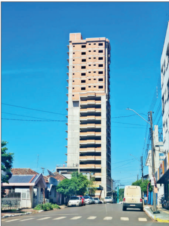
Edifício Dockhorn - Três de Maio