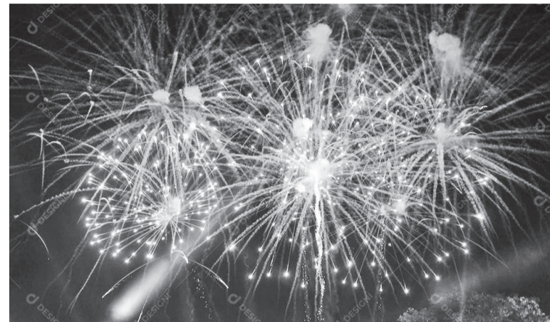
Legislação limita o uso de artefatos ruidosos com no máximo 25 centigramas de pólvora

As celebrações de fim de ano, marcadas por shows pirotécnicos, podem ser sinônimo de sofrimento para parte da população e para muitos animais. Os fogos de artifício com estampido causam sérios danos a animais domésticos e pessoas com alta sensibilidade auditiva, como autistas e outras condições sensoriais. Além de desconforto, o ruído pode provocar acidentes, convulsões e até mortes.