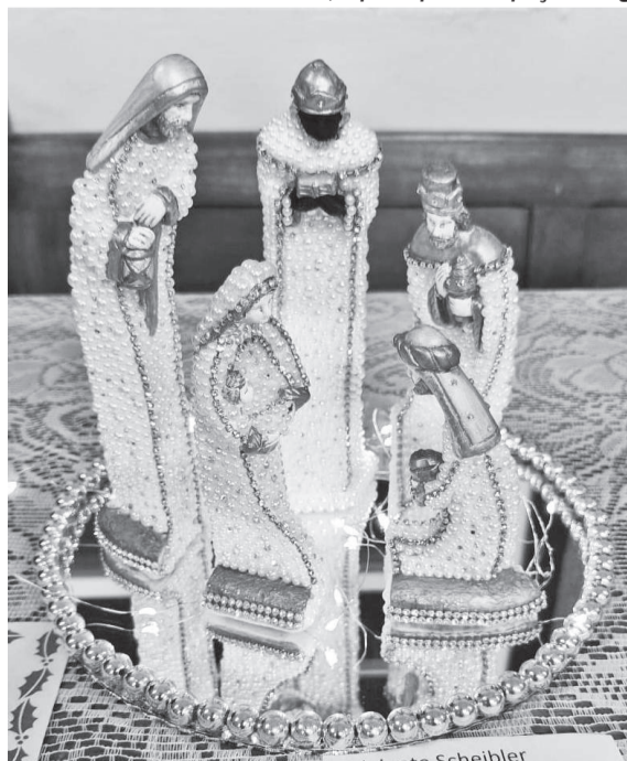
Presépio da artesã Jainete Scheibler com peças em gesso decoradas com pérolas