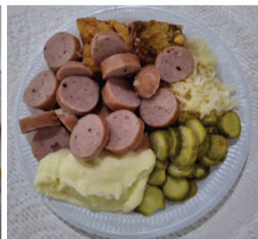
Bockwurst é um prato típico com salsichão e acompanhamentos