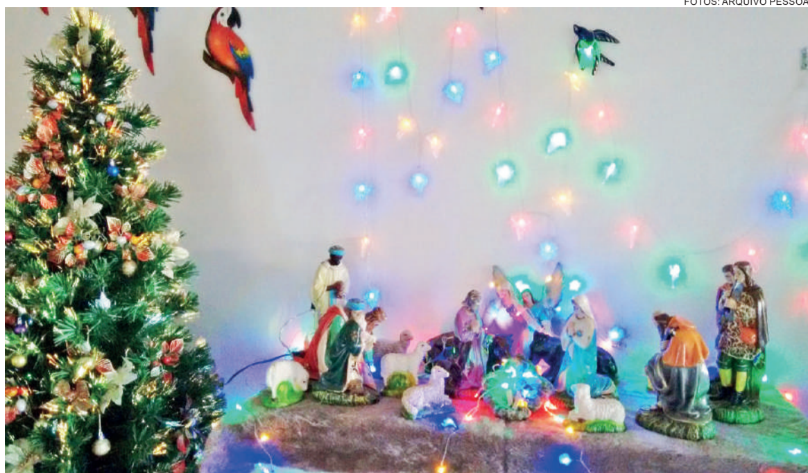
No Natal de 2016, as peças ganharam a companhia de luzes e aves