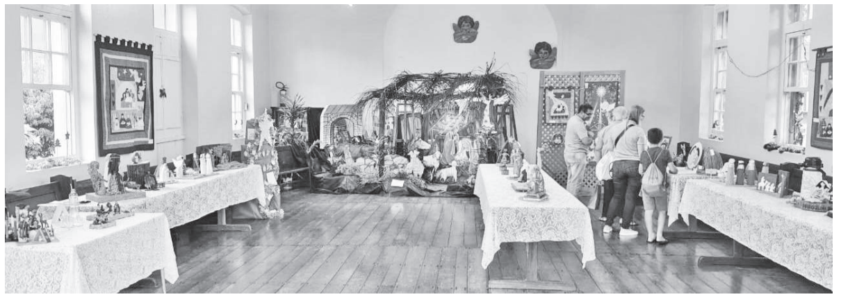
Primeira Mostra contou com a participação de 23 expositores e um total de 63 presépios

A ministra reforçou que o objetivo era propiciar a reflexão sobre o verdadeiro sentido do Natal. “Foi um incentivo para que as pessoas buscassem e revivessem os princípios de Jesus, que estão ligados ao respeito, ao amor, a paz e a justiça. Também buscamos incentivar a criatividade e o envolvimento das pessoas nessa data importante do calendário cristão, resgatando memórias afetivas e práticas muitas vezes esquecidas”, conclui.