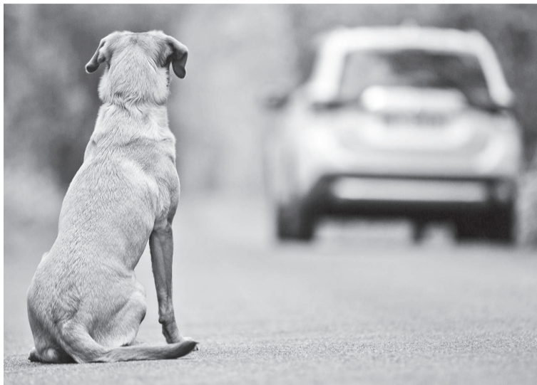
Pena para abandono de animais pode chegar a cinco anos

A legislação nacional prevê punições para casos de abandono e maus-tratos de animais. A Lei 14.064/2020 (Lei Sansão) aumentou as penas para quem comete abuso, maus-tratos, ferimento ou mutilação. O crime passa a ser punido com prisão de dois a cinco anos, multa e proi-