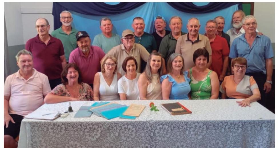
No último sábado (20), em Vila Progresso, interior de Três de Maio, ocorreu o encontro da primeira turma de formandos da 8ª Série da Escola Estadual de Ensino Fundamental Progresso, formada em 1975. O evento reuniu 21 ex-alunos para relembrar histórias e os tempos vividos juntos na infância após 50 anos da formatura. Parabéns pela iniciativa.