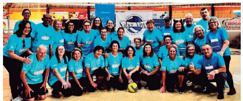
Para agradecer o ano de 2025 pelas conquistas, amizades e união do grupo, a Associação de Câmbio Saber Viver de Três de Maio realizou uma confraternização no último dia 18. Que 2026 venham mais conquistas e laços ainda mais fortalecidos!