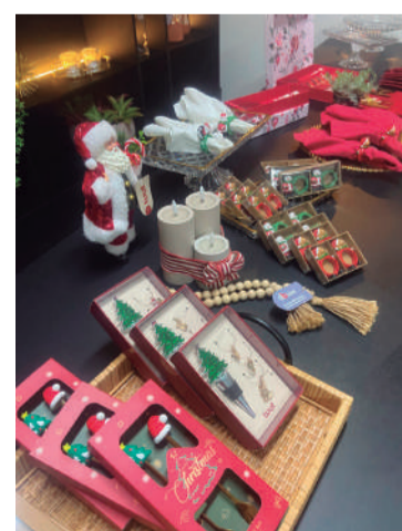
A DB Lare Móveis Planejados finda mais um ano com belíssimas sugestões de presente para o Natal, além de uma linda mesa, explorando requinte, estilo e bom gosto!