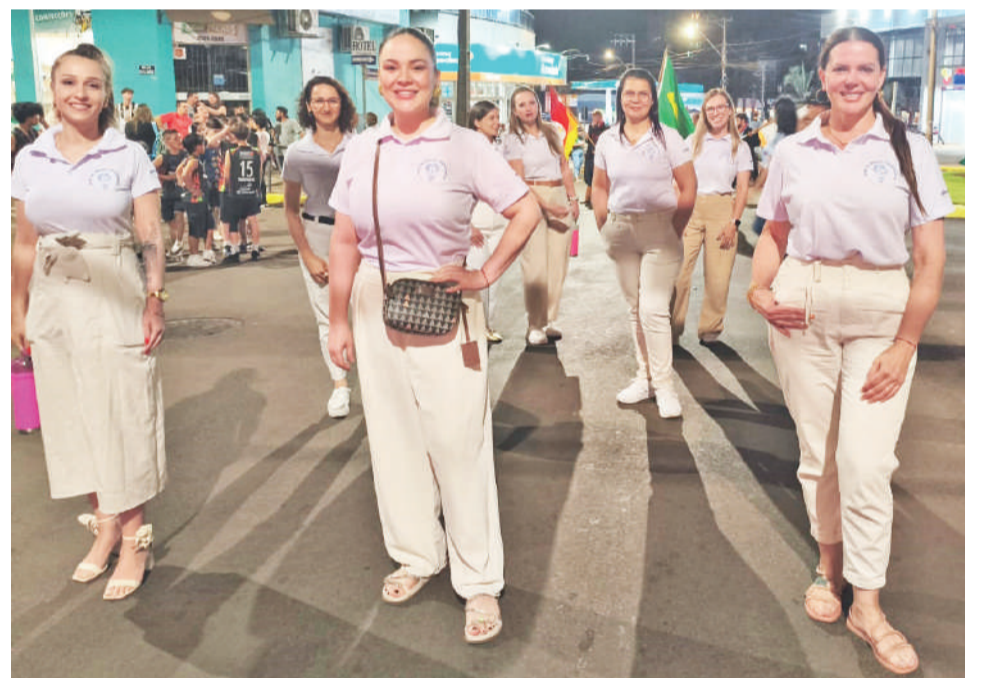
Integrantes do Núcleo de Mulheres Empreendedoras de Três de Maio marcaram presença no desfile natalino, em comemoração aos 70 anos de Três de Maio