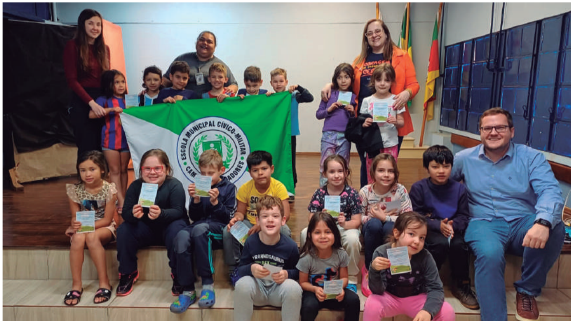
Participaram do projeto alunos da rede municipal e estadual, entre 6 e 12 anos de Três de Maio

tela e menos tempo ao ar livre, maior o risco e a velocidade do aumento do grau. Estudos mostram que crianças que utilizam telas por mais de seis horas por dia têm até três vezes mais chance de desenvolver alta miopia.”