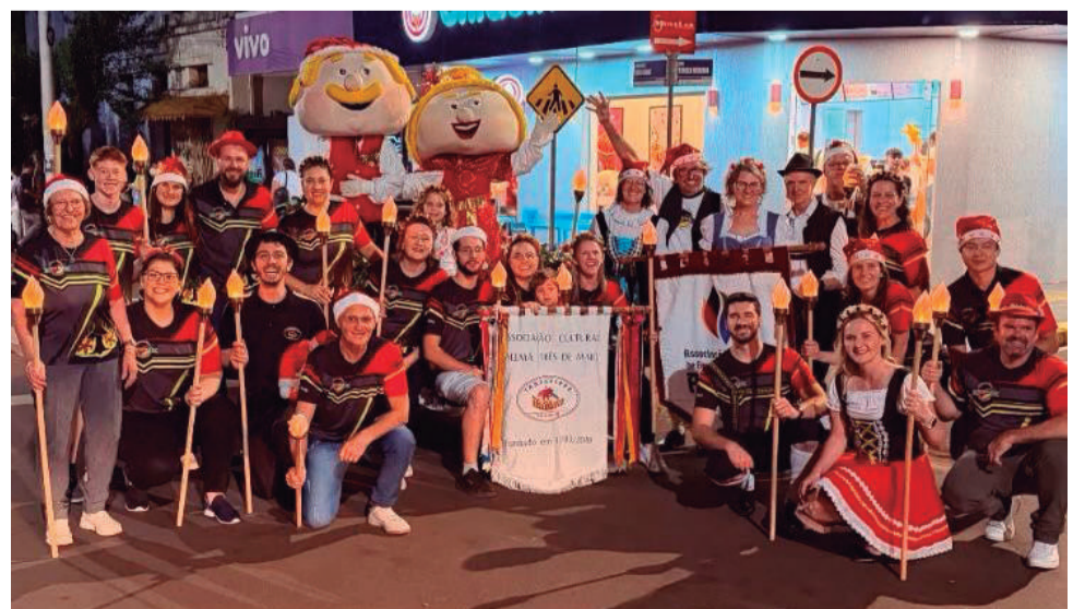
Membros da etnia alemã também estiveram participando do Desfile Natalino