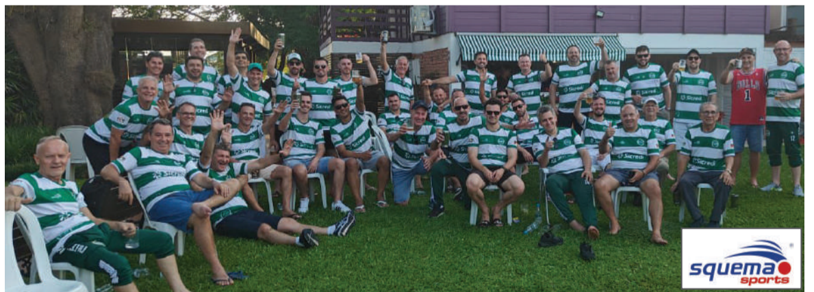
Integrantes do Oriental durante a confraternização