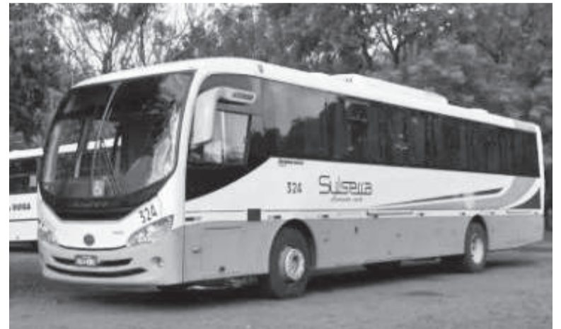
Empresa atuou por 57 anos na região Noroeste

O passageiros que utilizam linhas de transporte rodoviário com a empresa Sulsera foram pegos de surpresa no último dia 5. Uma decisão judicial decretou a falência da empresa de ônibus e, em consequência, o fechamento e a lacração da empresa, com a suspensão de todas linhas. Um comunicado fixado na rodoviária de Três de Maio, encaminhado à reportagem por um usuário da empresa, constava: ‘horários com a empresa Sulsera suspensos até segunda ordem’.