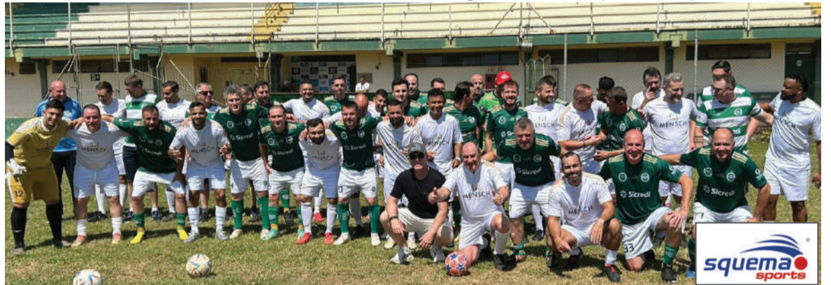
Jogadores das duas equipes na partida realizada no sábado