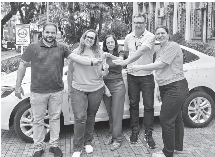
Veículo foi entregue na última terça-feira

Conforme informações do diretório municipal da sigla, o veículo custou R$ 127,8 mil, sendo R$ 27,8 mil como contrapartida do município de Três de Maio.