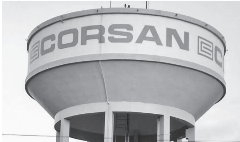
Falta de água ocorreu em dois dias seguidos. Alguns pontos da cidade permaneceram com problemas de abastecimento por três dias na semana passada

Quanto a falta de abastecimento de água relatados por clientes de alguns bairros da cidade durante três dias, a empresa respondeu que há relação às interrupções anteriores. “Mesmo após a normalização da captação, o sistema precisa de um período para recuperar os ní-