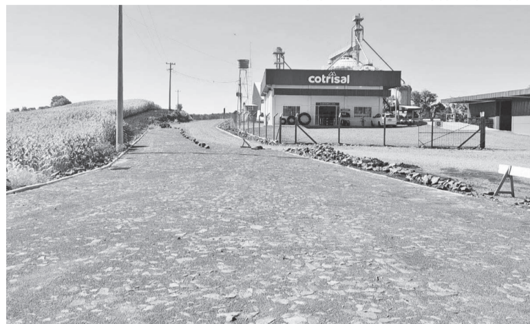
Trecho de calçamento em Linha da Barra está liberado ao trânsito

O investimento, articulado pelos membros do Partido dos Trabalhadores de São José do Inhacorá, foi viabilizado por meio de uma emenda especial do deputado federal Elvino Bohn Gass (PT), com recurso total de R$ 250 mil. Como o valor licitado foi de R$ 229,5 mil, a sobra de recurso possibilitará a am-