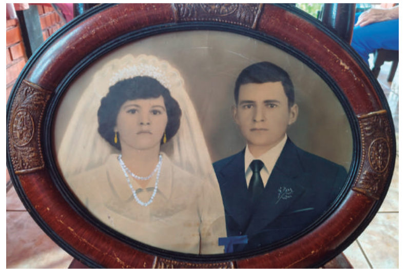
A foto do casamento no ano de 1955 está na parede da sala da casa do casal