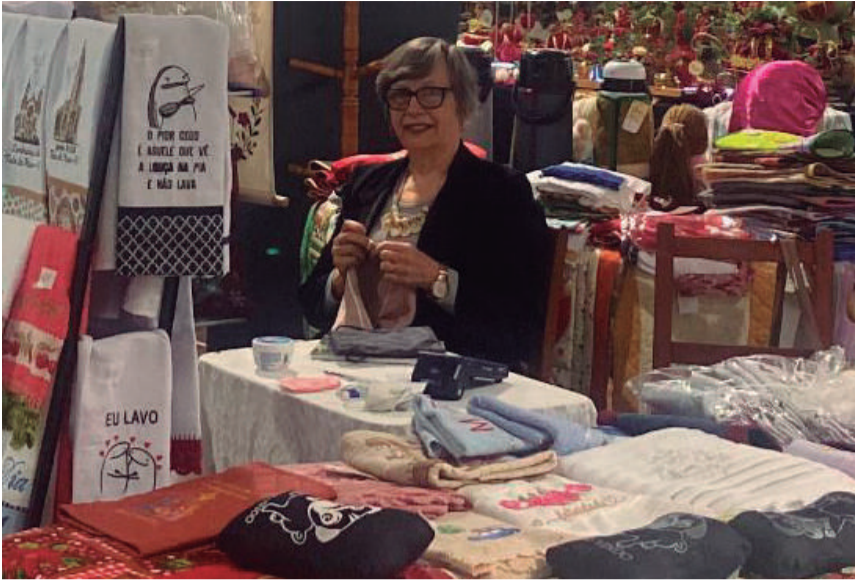
Meus aplausos de admiração a todos os artesãos que participaram da XV Feirarte, que aconteceu de 6 a 8 de novembro no Clube Buricá, em Três de Maio. Trabalhos lindíssimos, com muita arte, criatividade e talento. Parabéns a todos os envolvidos!