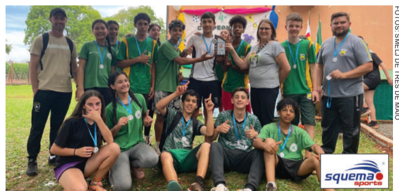
Equipe da EMCM Caminhos Inovadores, campeã da categoria 8º e 9º anos

Categoria 6º/7º anos Campeão: EMEF Frederico Lenz Vice-campeão: EMCM Caminhos Inovadores