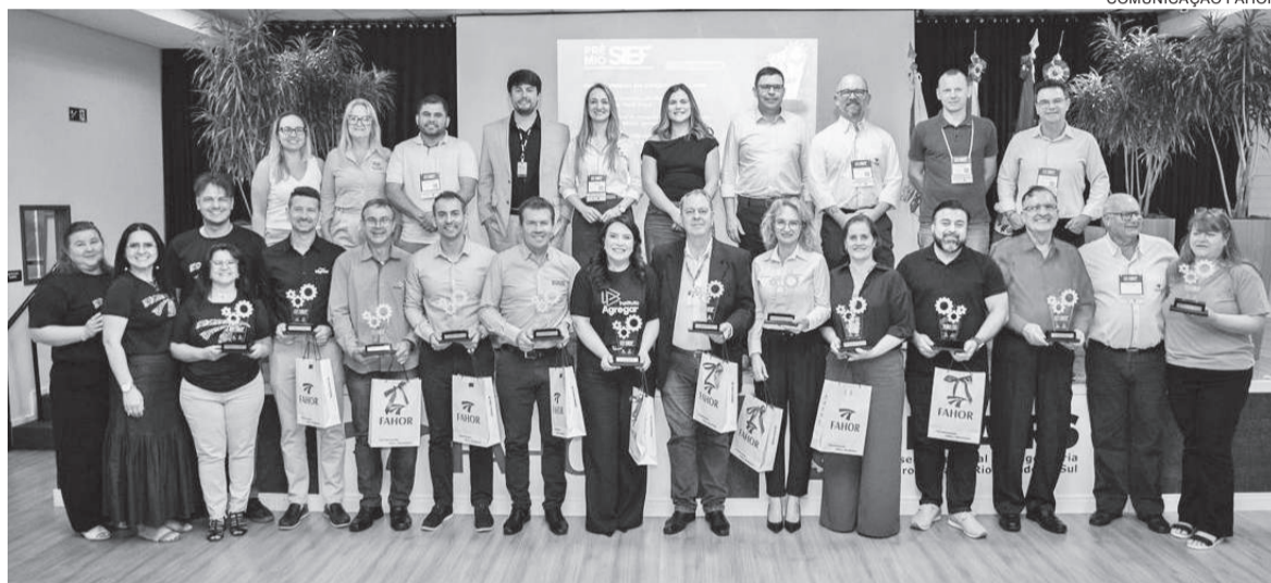
Ganhadores do Prêmio SIEF de Empreendedorismo e Inovação e direção da FAHOR

foi a cerimônia de premiação, marcada por conexão e reconhecimento. O destaque especial foi a homenagem ao Grupo SLC, celebrado como Pioneiro em Inovação e Empreendedorismo, em alusão aos 60 anos da fabricação da primeira colheitadeira automotriz brasileira, a SLC 65-A — símbolo do espírito inovador de Horizontina.