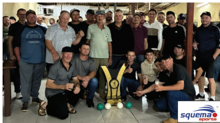
Equipe Santo Antônio B, campeã do Campeonato de Bochas