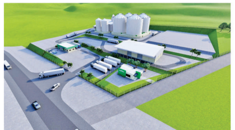
2025: Está em andamento um investimento de R$ 30 milhões na construção da nova e estratégica unidade de Humaitá, polo de armazenagem para Tiradentes do Sul, Crissiumal e Sede Nova

No mês de outubro, a Cotrisal promoveu em Três de Maio, o Programa Mulheres Cooperativistas. Mais de 800 mulheres já participaram. Em Três de Maio, foi a terceira turma