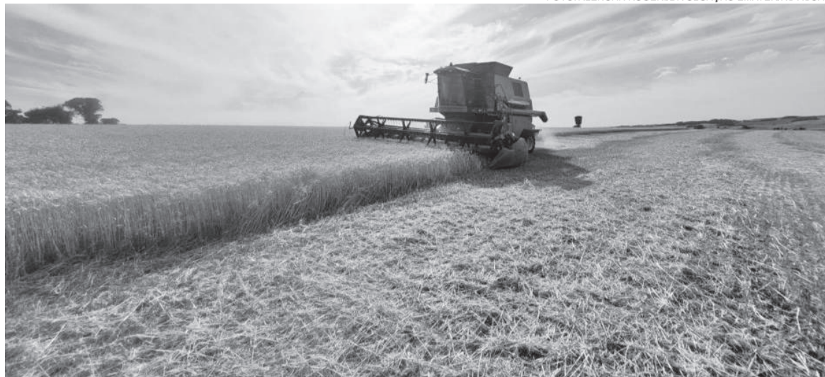
No Estado, a colheita do trigo ainda não atingiu 50% da área cultivada. Em Três de Maio, produtores já finalizaram a colheita do cereal