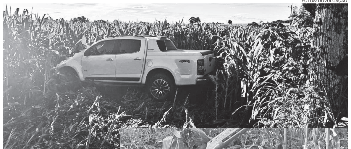
Colisão entre caminhonete S10 e moto causou a 18ª morte no trecho de 9,5 quilômetros da ERS-342, em Três de Maio

No cenário estadual, a ERS-342 aparece como a 12ª rodovia