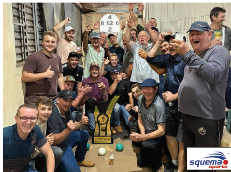
No Campeonato de 48, Cinco Barulhos foi a equipe campeã