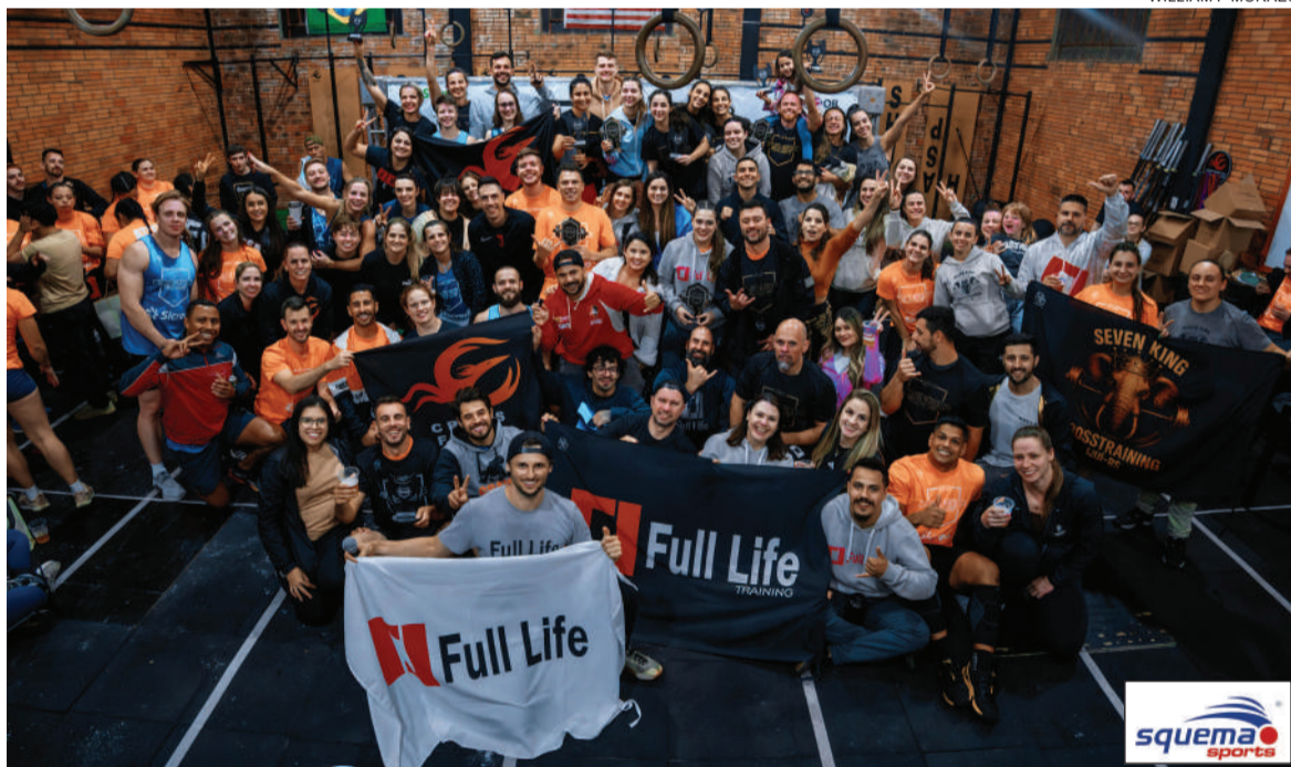
A terceira etapa do circuito, realizada em Três de Maio, contou com atletas de diversas cidades da região Noroeste

A equipe Cross Fênix TM conquistou o troféu de mais pódios no Circuito Noroeste Crosstraining. A classificação final foi divulgada após a terceira e última etapa, realizada no último sábado, 8, em Três de Maio. As primeiras etapas ocorreram em Santo Ângelo e Ijuí.