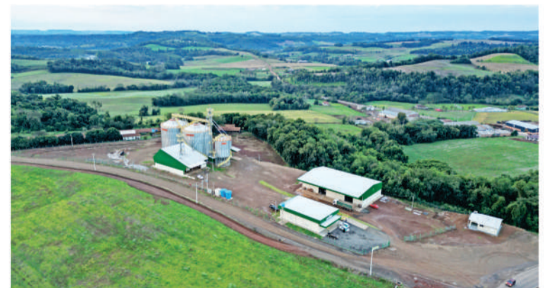
2024: Inaugurou nova unidade em São José do Inhacorá