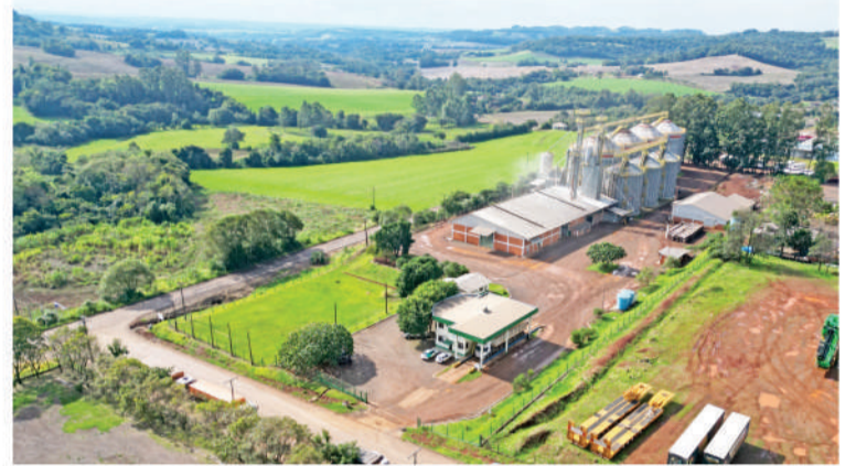
2021: Aquisição da unidade de grãos, em Horizontina. No ano seguinte foram iniciados investimentos na construção de quatro silos, aumentando a capacidade estática em 380 mil sacas de grãos

No mês de outubro, a Cotrisal promoveu em Três de Maio, o Programa Mulheres Cooperativistas. Mais de 800 mulheres já participaram. Em Três de Maio, foi a terceira turma