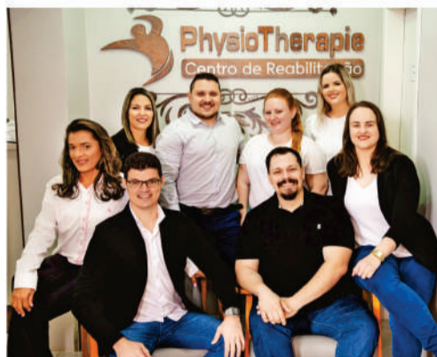
Equipe de profissionais da PhysioTherapie

Mais do que um selo, é a prova de que na PhysioTherapie , você está em boas mãos.