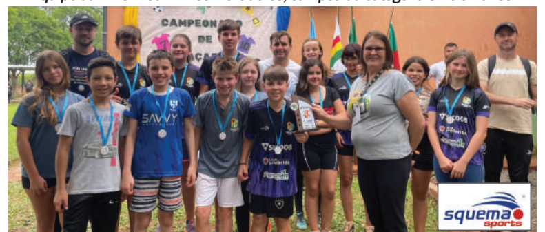
Equipe da EMEF Frederico Lenz, campeã da categoria 6º e 7º anos