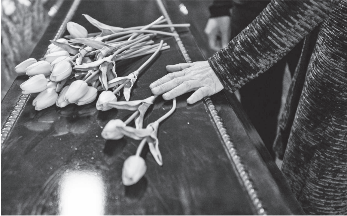
Os rituais de passagem, como o velório, o sepultamento ou a cremação, representam o fechamento de um ciclo e o início de outro. Eles ajudam a amenizar a dor das pessoas enlutadas, ajudando-os a lidar de uma forma mais leve com a ausência do ente querido