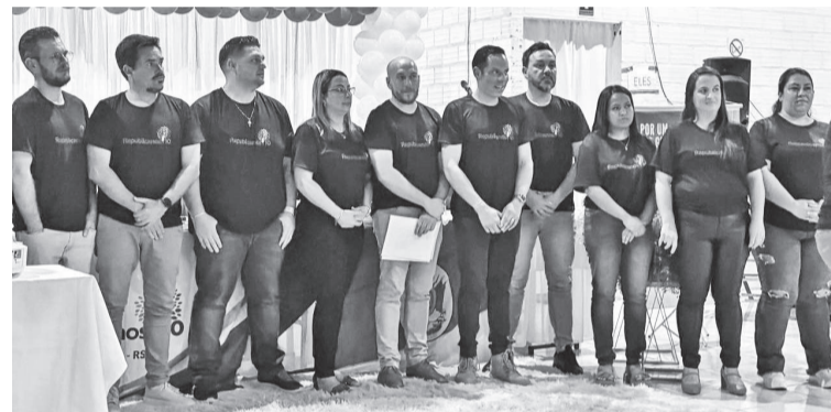
Lideranças do Republicanos de Três de Maio