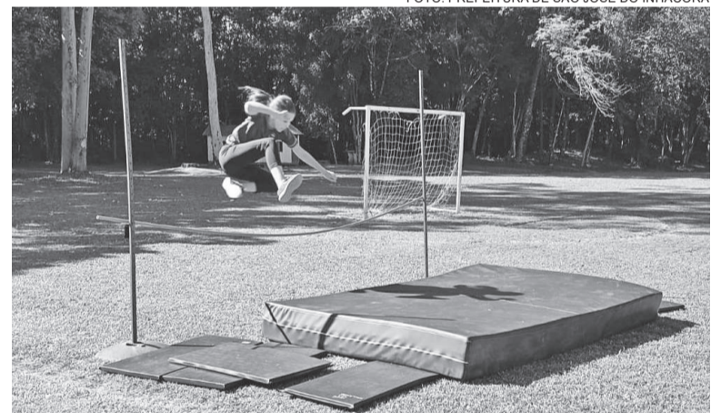
Salto em altura foi uma das modalidades do festival