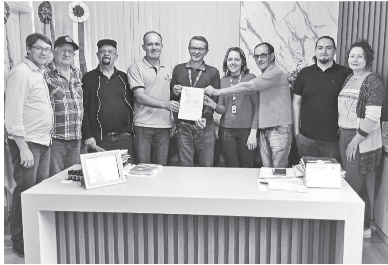
Comitiva do Partido dos Trabalhadores realizou a entrega de uma emenda parlamentar no Gabinete do Prefeito

O Executivo Municipal de São José do Inhacorá recebeu nesta semana uma comitiva do Diretório Municipal do Partido dos Trabalhadores (PT) para a entrega oficial do Ofício nº 170/2025, do Gabinete do deputado federal Paulo Pimenta (PT). O documento formaliza a indicação de uma emenda parlamentar no valor de R$ 250 mil destinada à aquisição de um trator de 110 CV.