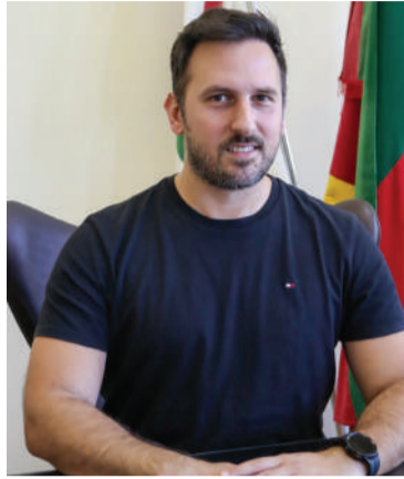
Prefeito Marcos Corso diz que são necessários estudos técnicos prévios, planejamento orçamentário e análise de viabilidade para garantir a efetividade e a sustentabilidade das iniciativas

Apesar das decisões administrativas quanto às matérias, o prefeito reforça que os vetos não significam desinteresse sobre a pauta. “A Secretaria está conduzindo um processo de estruturação e fortalecimento do turismo rural em parceria com Sebrae, Senar, Sicredi e Sindicato Rural e propriedades. O reconhecimento sem critério derruba a confiança do visitante e afasta investimentos. Com os mecanismos certos, qualquer propriedade/localidade poderá se candi-