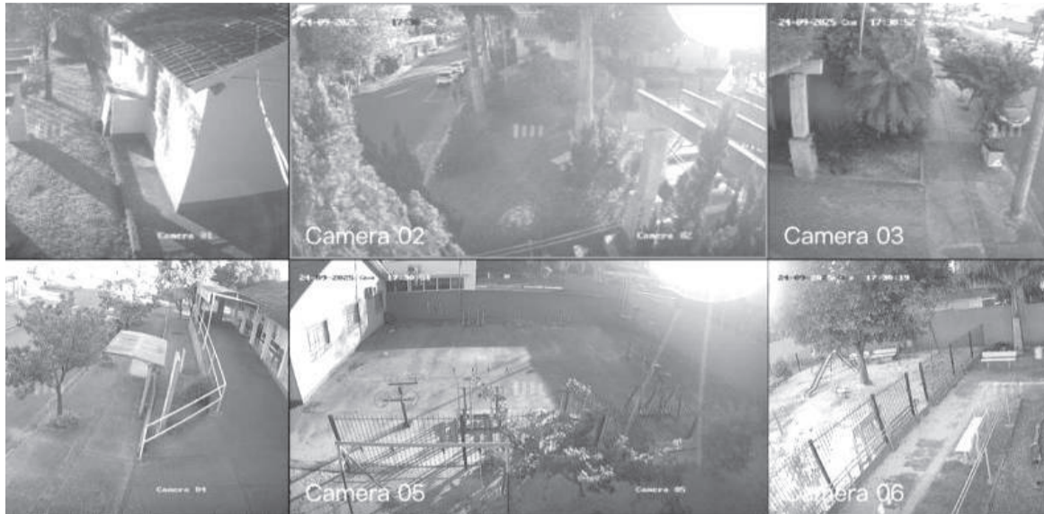
Foram investidos R$ 7,7 mil para a instalação de 8 câmeras de segurança com DVR em cada praça

SECRETARIA DE COMUNICAÇÃO DE TRÊS DE MAIO