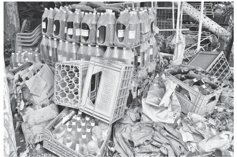
Entre as apreensões estão vinhos e cervejas sem procedência, vencidos ou com rótulos adulterados

O promotor Alcindo Luz Bastos da Silva Filho, da Promotoria de Defesa do Consumidor de Por-