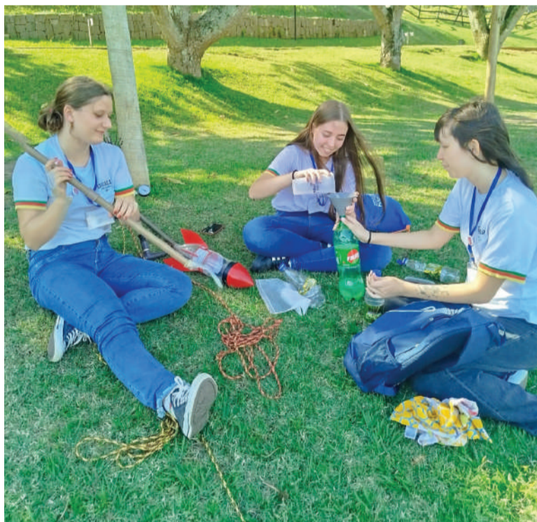
A classificação para participar da Jornada dos Foguetes a nível nacional veio por meio do excelente desempenho das estudantes na fase escolar, quando o foguete alcançou 299 metros. Os foguetes foram feitos com garrafas PETS