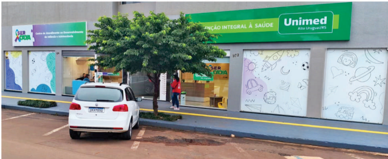
Os serviços de fisioterapia vão funcionar na Avenida Santa Rosa, 970, em Três de Maio

A Unimed de Três de Maio lança seu mais novo serviço de fisioterapia, oferecendo à comunidade uma estrutura moderna, acolhedora e completa para o cuidado com a saúde e o bem-estar. O serviço está disponível não apenas para clientes do plano de saúde, mas também para pacientes particulares, ampliando o acesso à fisioterapia de qualidade.