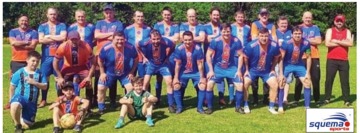
Jogadores dos Amigos da Bola. Equipe enfrenta o Rocinha fora de casa neste sábado