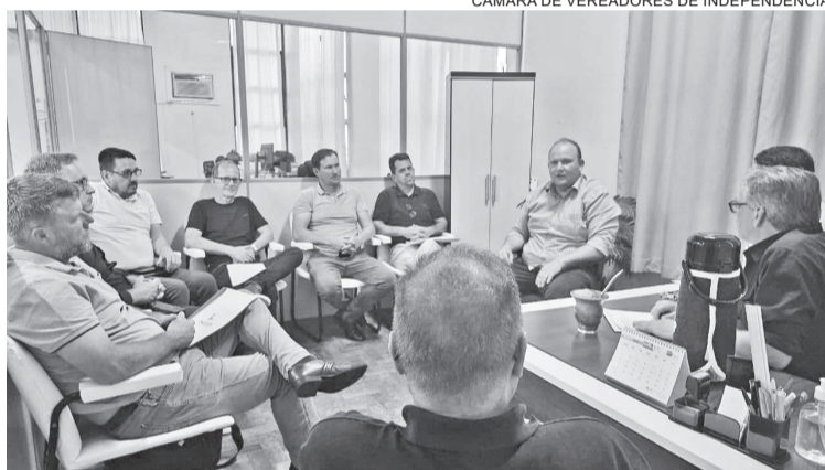
Reunião realizada na Câmara de Vereadores contou com a participação dos vereadores e do prefeito de Independência

Para a Câmara o resultado de dez meses é fruto de diálogo e união, que são a base para o progresso. Os recursos, conquistados pelo Executivo e Legislativo juntos, irão impulsionar todas as áreas de Independência.