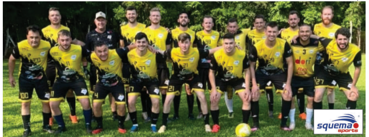
Equipe do Rocinha recebe os Amigos da Bola em clássico três-maiense

TURMA DOS SÁBADOS X AMM . Local: Horizontina.