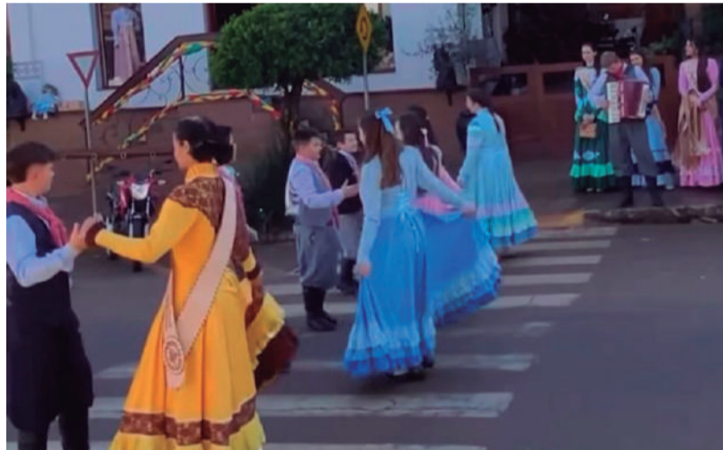
Invernada artística também fez apresentações nas ruas da cidade. O registro é em frente à loja SAN Steban