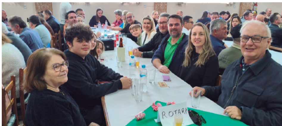
Rotary Club de Três de Maio e familiares também presentes no almoço dos Italianos