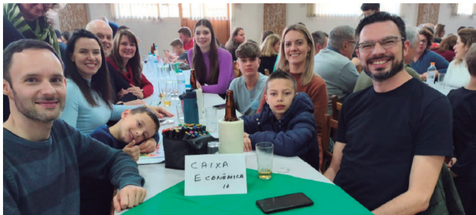
Colaboradores da CAIXA - agência de Três de Maio - com seus familiares no almoço dos Italianos, realizado recentemente