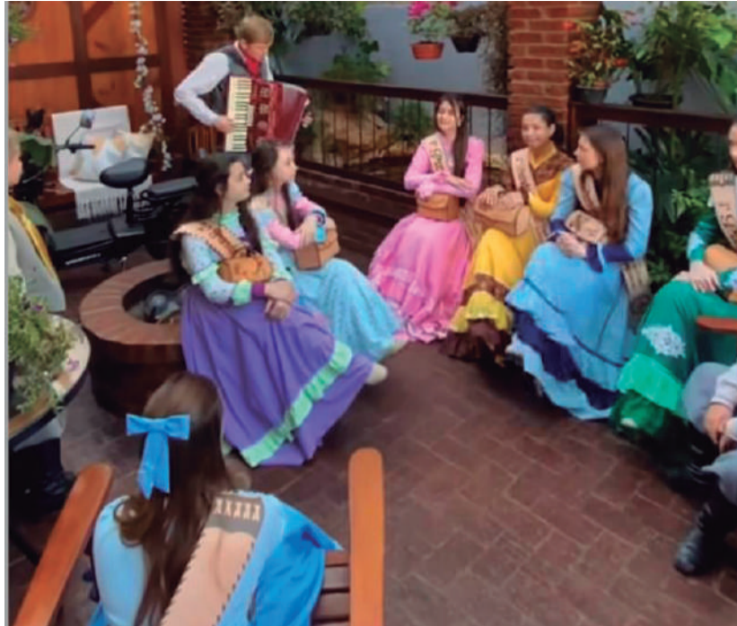
Parabéns ao CTG Tropeiros do Buricá e a invernada artística pelas belíssimas apresentações de danças e pelo projeto que executam junto às escolas. Parabéns também pela iniciativa de levar a dança e as tradições gaúchas ao comércio local. É lindo demais! Vocês são incríveis!