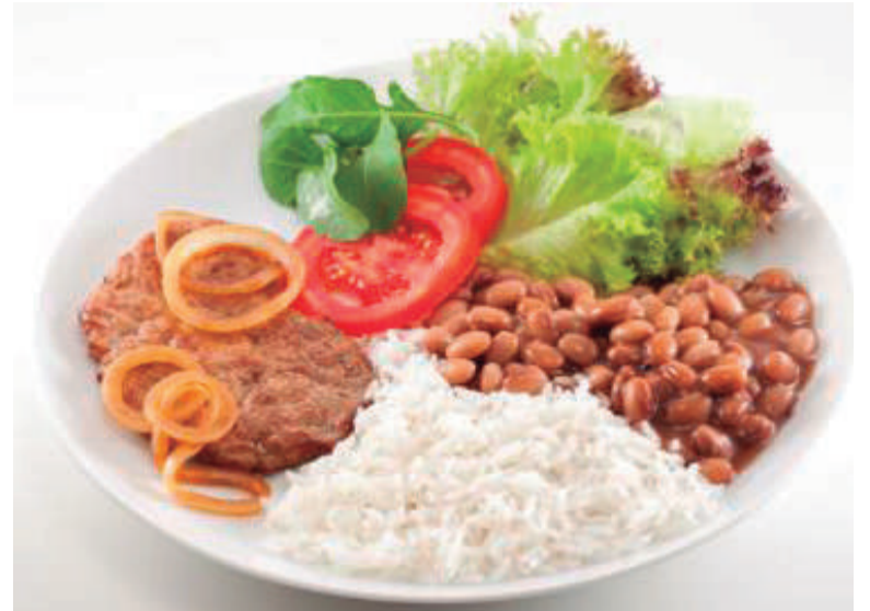
Hábitos alimentares saudáveis desde cedo, como comida caseira, podem facilitar que as crianças mantenham uma alimentação adequada, evitando sobrepeso. Tradicional prato de arroz, feijão, verduras e uma proteína é uma excelente opção