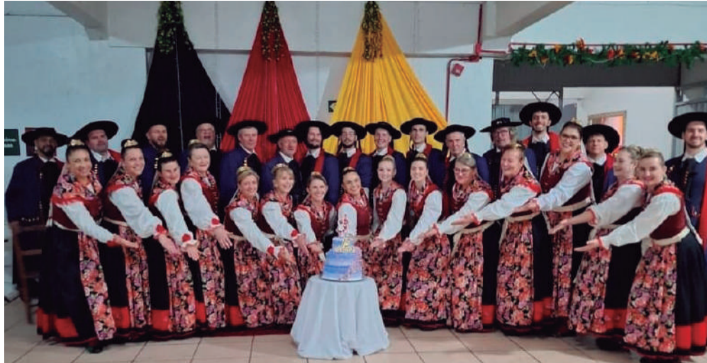
Para comemorar os 15 anos do grupo de dança Tanzgruppe Maiblume - referência em todo o Estado - a Associação Cultural Alemã de Três de Maio promoveu, no último sábado, 13, o Baile do Chopp no Clube Buricá. O evento foi de integração e muita dança e teve a presença de 15 grupos de danças da regional Parabéns com muita dança!