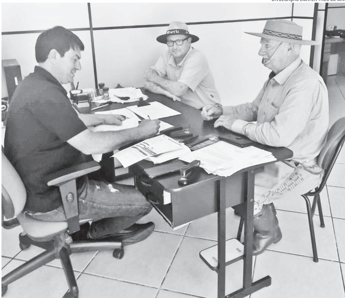
Produtores rurais três-maienses têm que ir presencialmente no escritório da Emater para se inscrever no programa

Os recursos serão liberados por meio do Cartão Cidadão do Banrisul, com execução em etapas, acompanhamento técnico e prestação de contas.