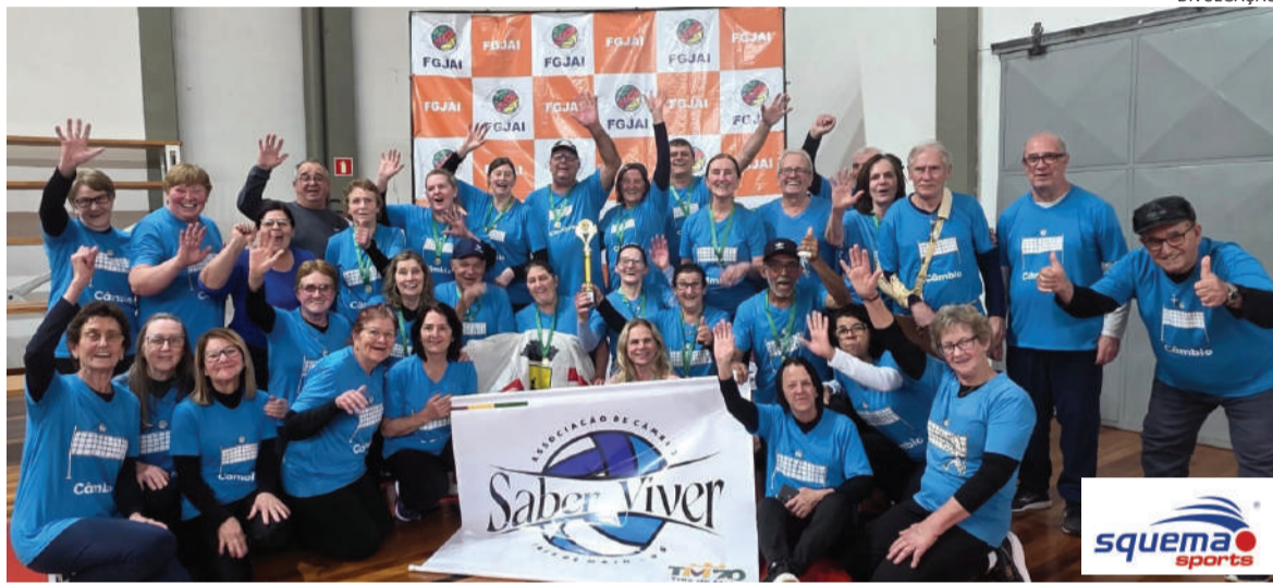
Grupo de Câmbio Saber Viver de Três de Maio é formado com atletas com 60 anos ou mais