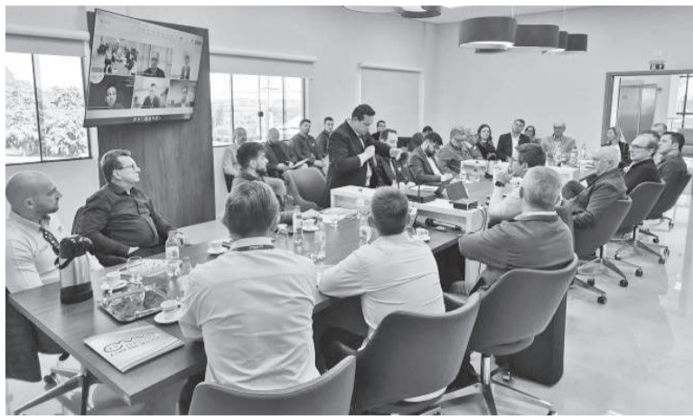
Reunião ocorreu na sede da Cermissões, em Caibaté

O debate teve como principal foco a preocupação com o crescimento do consumo de energia nos últimos anos, impulsionado especialmente pela irrigação e pelo avanço da armazenagem de grãos.