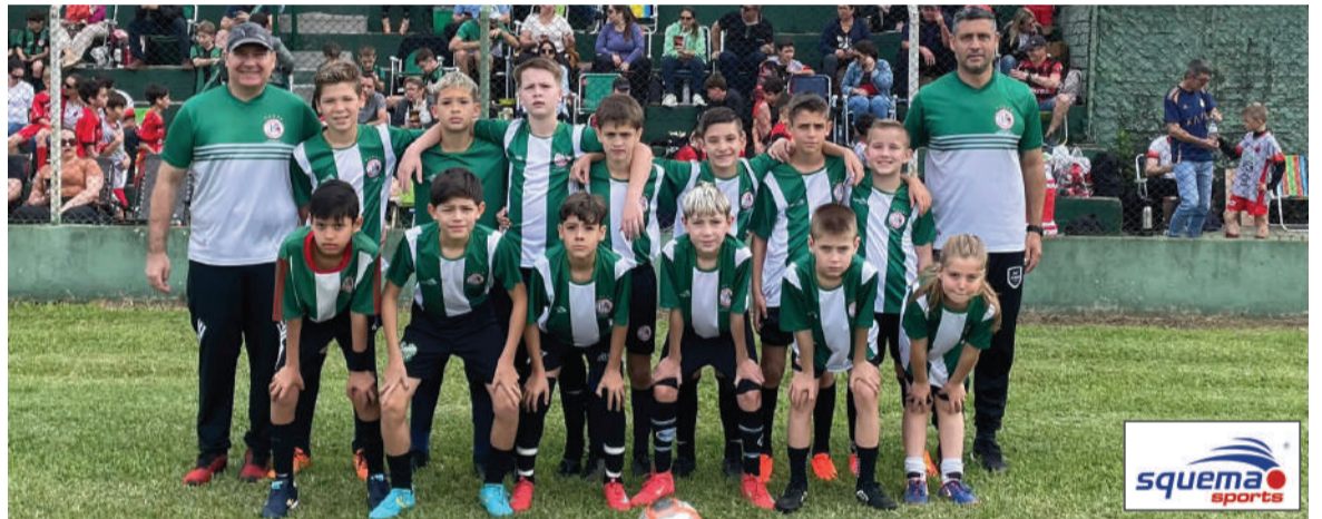
Jogadores da equipe Sub-11 do Guarany de Consolata

As finais serão em duas datas: dia 28 de setembro serão com as finais das categorias Sub-7, 9 e 11, em Nova Candelária, e no dia 5 de outubro nas finais das categorias Sub-13 e Sub-15, em Boa Vista do Buricá.