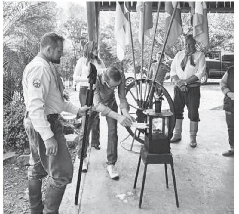
Com a chegada da Chama Crioula foram iniciados oficialmente os festejos farroupilha

As festividades farroupilhas do CTG terão seu ponto alto hoje, dia 19 de setembro, com missa crioula as 19 horas.