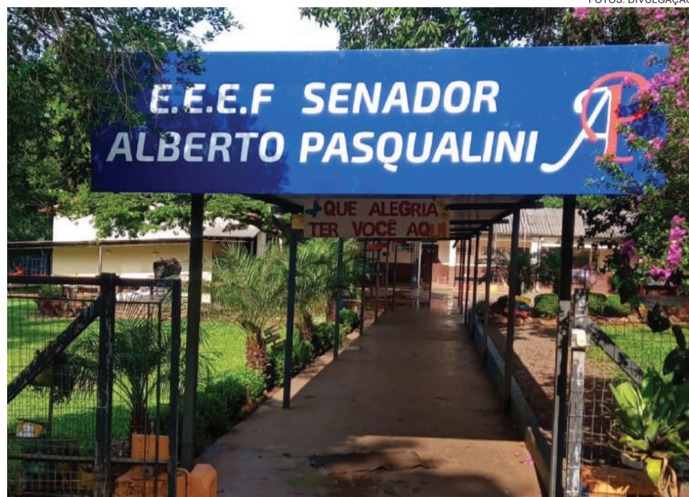
Desde 2018 a escola oferece Ensino em Tempo Integral em todos os anos do Ensino Fundamental

Para celebrar a data, no dia 9 de agosto, a escola comemorou a data com um jantar dançante com homenagem aos ex-formandos dos anos 1991 até 2005.