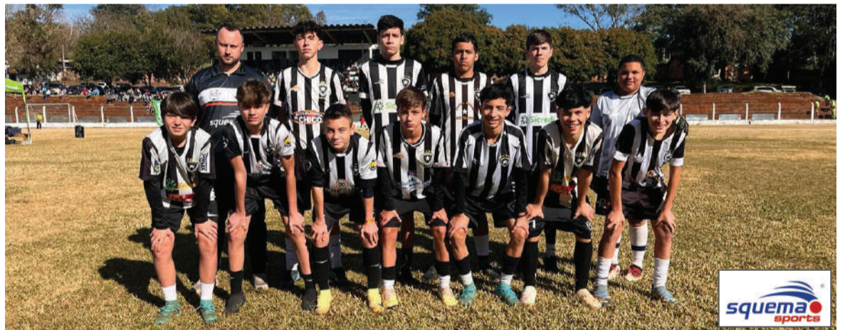
Jogadores da categoria Sub-15 do Botafogo