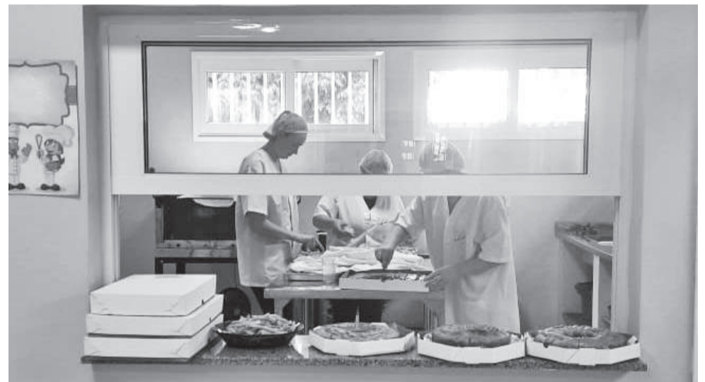
Refeitório e cozinha são amplos e modernos