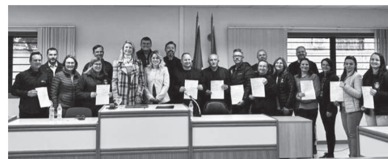
Representantes das entidades contempladas com os recursos e através do convênio

Recursos são oriundos de aplicação de penas alternativas da Vara de Execuções Criminais