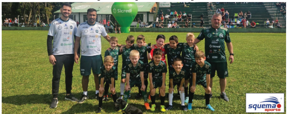
Oriental Futebol Clube se classificou na categoria Sub-7