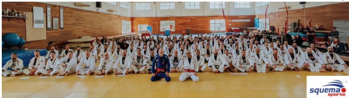
Evento reuniu atletas de todo Estado

Evento também celebrou os 40 anos da Union Team