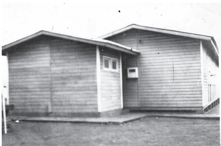
Um dos primeiros prédios da escola