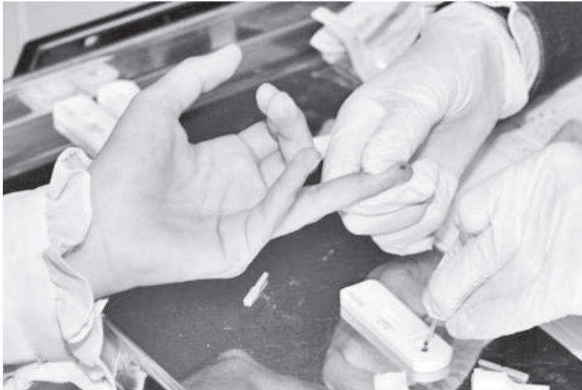
Testes rápidos para diagnóstico de HIV, sífilis e hepatites são oferecidos gratuitamente em todos os postos de saúde de Três de Maio

Diagnósticos de sífilis em gestantes também já é o mesmo que do ano passado