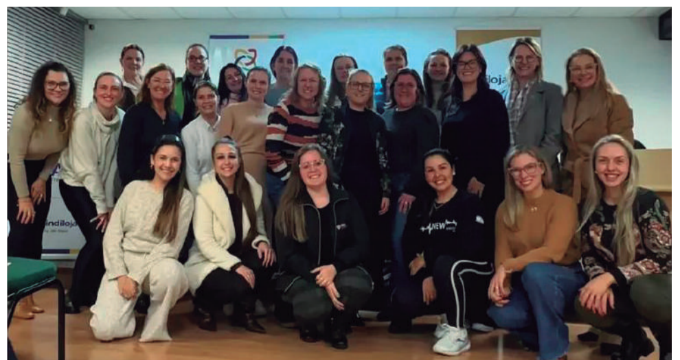
Integrantes do Núcleo de Mulheres Empreendedoras de Três de Maio, da ACI/Sindilojas, reunidas para planejamento, estratégias e novas ações.

Ele é um aliado poderoso para quem busca rejuvenescer a pele, melhorar a textura, clarear manchas e estimular a produção natural de colágeno. QUANDO: quinta-feira, dia 18/09. ONDE: Espaço DL, com a profissional Fisioterapeuta Dermatofuncional Daniela Manjabosco Lorenzoni BENEFÍCIOS: - Resultados visíveis na mesma hora; - Procedimento rápido e seguro; - Indicado para diferentes tipos de pele.