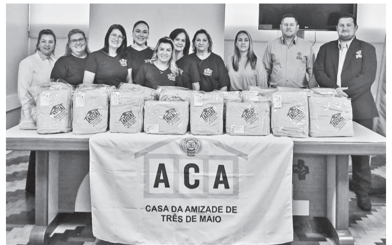
Integrantes da Casa da Amizade com representantes do HSVP

Casa da Amizade entrega 50 mantas ao Hospital São Vicente de Paulo