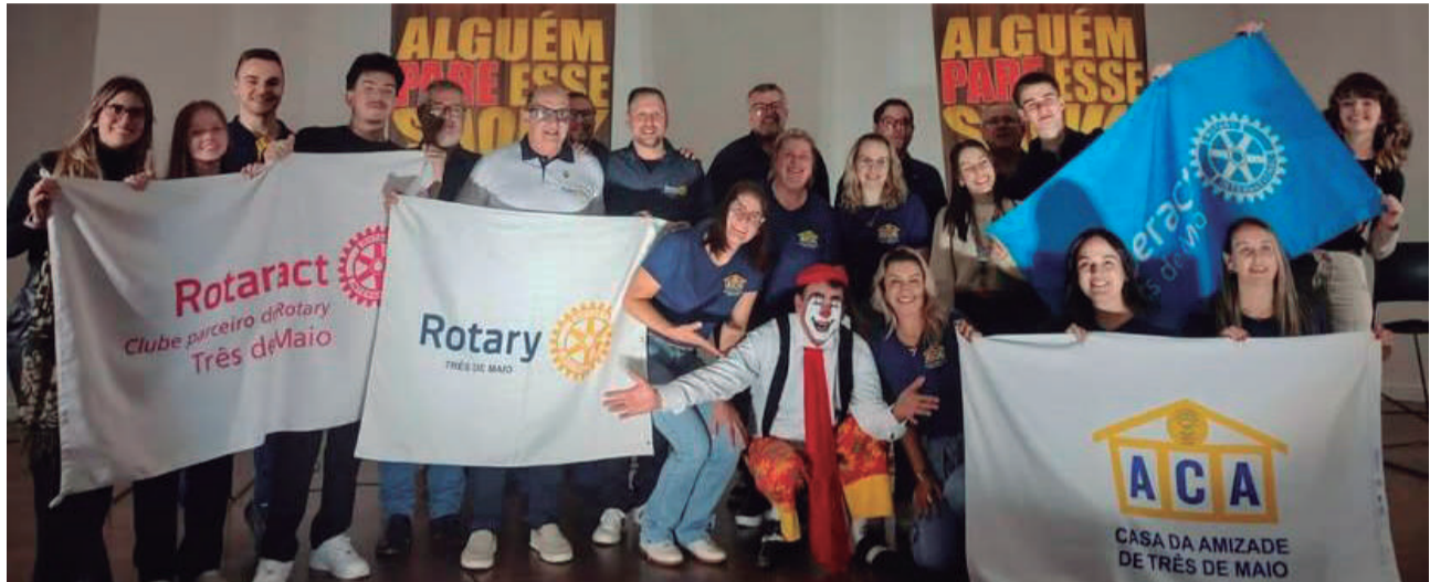
A grande Família Rotária promoveu nos dias 26 e 27 de agosto, no auditório do Sicredi, a "Terapia do Riso", com o artista do Teatro Serelepe. Duas noites de muitas risadas e solidariedade. O lucro será revertido em ações assistidas pela família rotária.