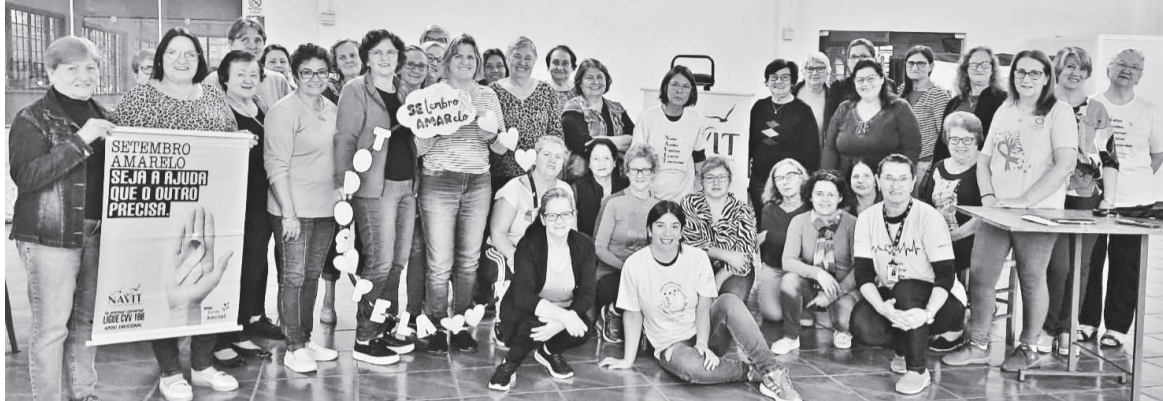
Atividade realizada na sede do Oriental FC no dia 1º

Desde o dia 28 de agosto, o Núcleo de Apoio à Vida de Três de Maio (Navit) está realizando atividades de prevenção ao suicídio em grupos na cidade e no interior. As ações são alusivas a campanha do Setembro Amarelo, mês dedicado à conscientização sobre a valorização da vida e a prevenção ao suicídio.