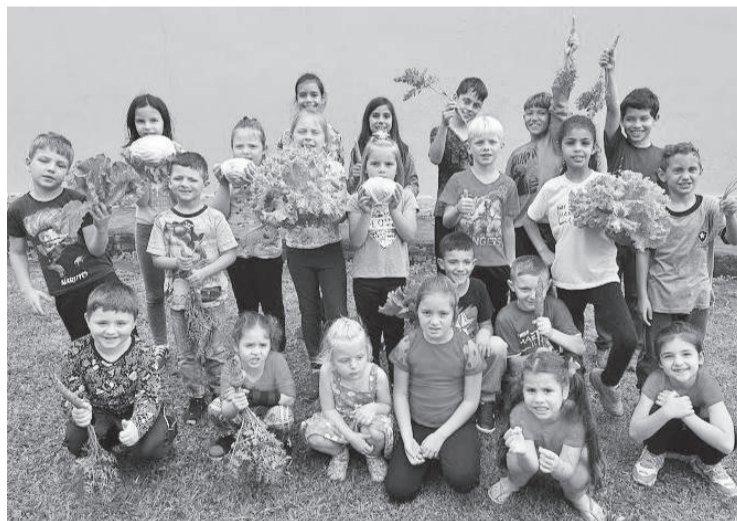
Projeto realizado com estudantes até o quarto ano une cidadania e meio ambiente