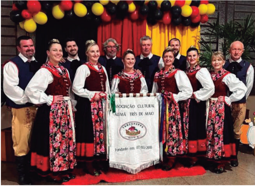
Um registro de alguns dos integrantes do grupo de dança Tanzgruppe Mainblume. No último fim de semana, o grupo esteve no município de São Martinho, em uma belíssima apresentação.