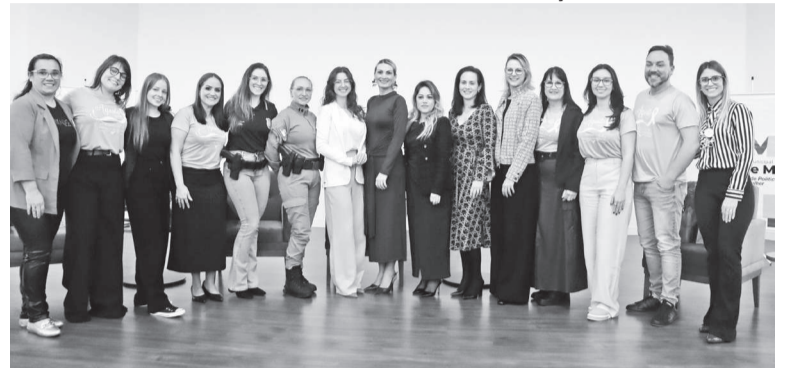
Representantes de instituições que integram a Rede de Proteção a Mulher