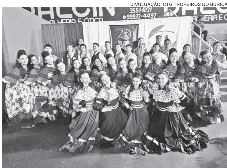
Invernada Juvenil do CTG Tropeiros do Buricá

Além das apresentações das invernadas artísticas, ocorreram apresentações de solistas e dança de salão