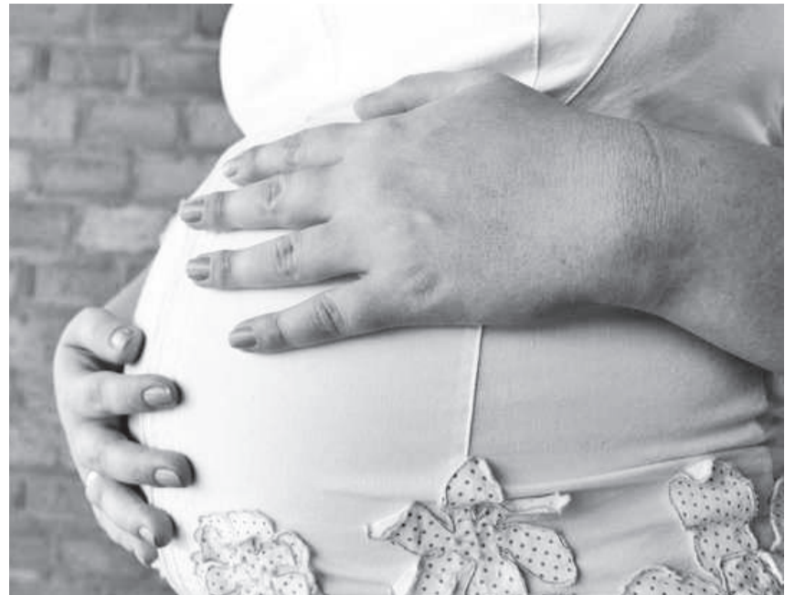
Taxa de nascimento aumentou 19% em Três de Maio

Na faixa etária entre 40 e 44 anos, a redução foi de 31% no período. De 35 nascimentos em 2010, caíram para 24. A menor variação ocorreu nas mães de 39 a 40 anos, que caiu de 52 para 51 nascimentos.