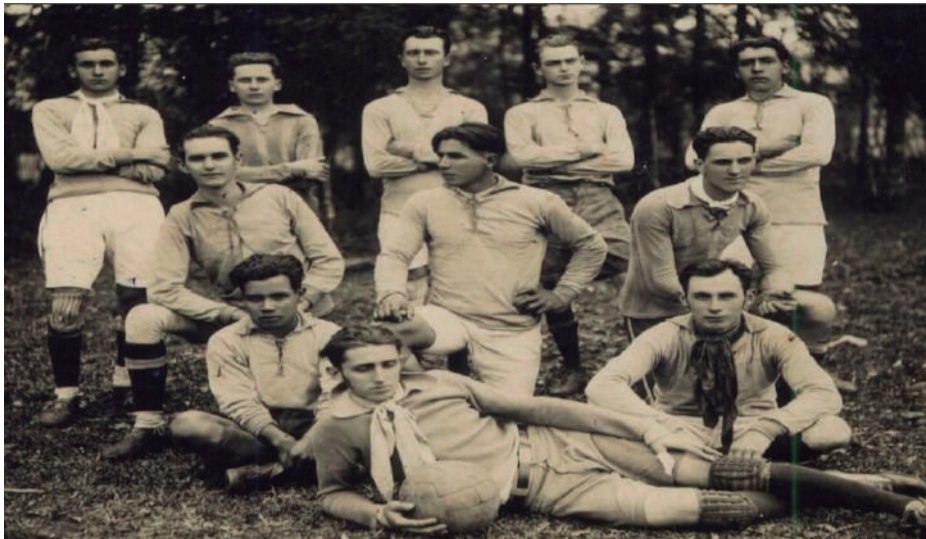
Uma das fotos mais antigas do time do Oriental, tirada por volta do início da década de 1930