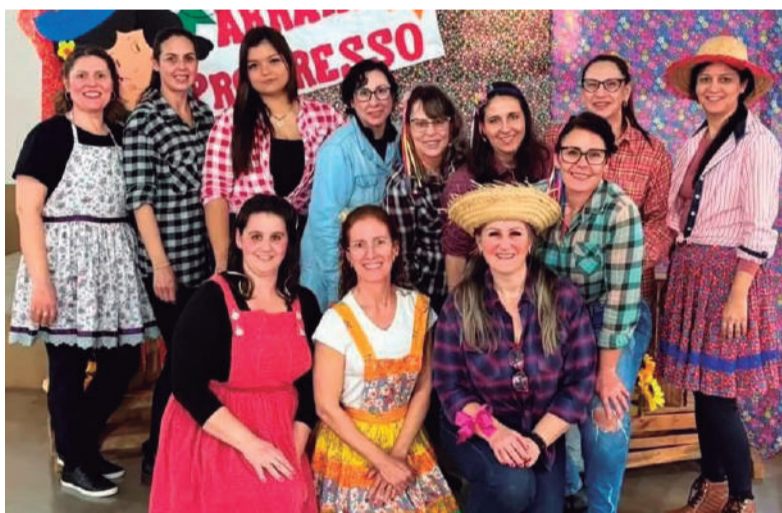
Professoras e direção da Escola Estadual de Ensino Fundamental Progresso, da Vila Progresso. O registro foi no último sábado, 12, na tradicional festa julina da escola. Animação, alegria e muitos quitutes!