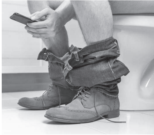
Levar o celular ao usar o banheiro, pode abrir portas para bactérias, causar hemorroidas e até ampliar problemas de ansiedade associados ao dispositivo

Infectologista alerta para os perigos invisíveis do hábito, que pode comprometer sua saúde intestinal, expor o corpo a infecções e aumentar a dependência do celular