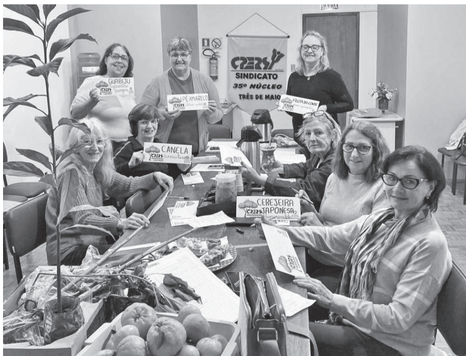
Cada árvore plantada recebe uma plaquinha - confeccionada pelas professoras aposentadas -, com a identificação da espécie