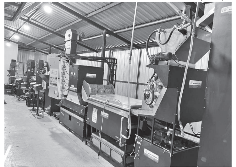
Fábrica em Santa Rosa é equipada com 15 máquinas

Com 15 máquinas automatizadas, entrou em operação na última semana a Terra de Pecã, uma indústria de beneficiamento de nozes-pecã. O empreendimento está instalado em Santa Rosa, às margens da BR-472, próximo ao posto Fenasoja.