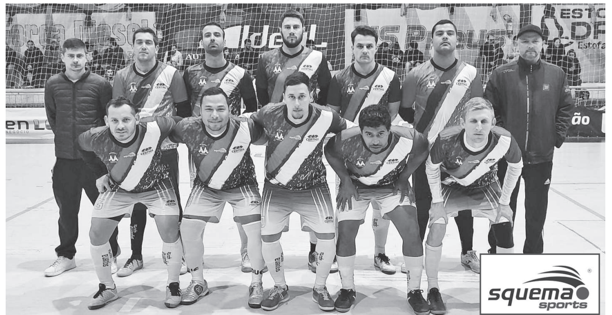
Jogadores da Certhil/Agrosol. Equipe foi a campeã da competição na edição de 2024