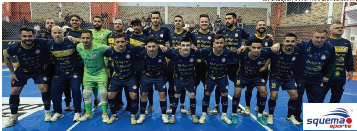
Equipe e comissão técnica do União Três-Maiense/Agren na partida disputada em Rodeio Bonito

Pentacolor fez 6X4, tem 9 pontos e é líder do grupo B