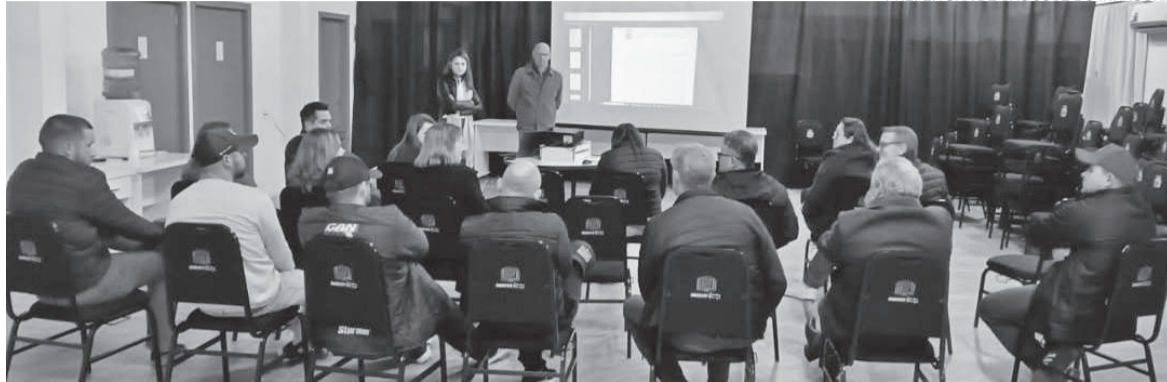
PREFEITURA DE SÃO JOSÉ DO INHACORÁ

Com a presença de representantes do Sebrae, foram abordadas questões sobre licitações, microcrédito e funcionamento da Sala do Empreendedor