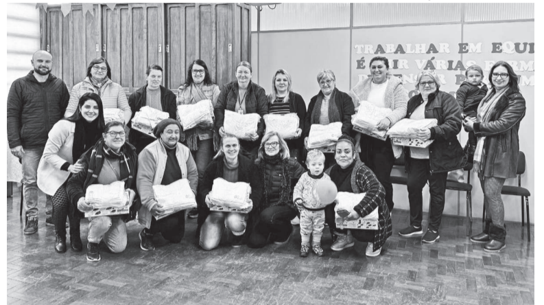
Profissionais receberam jalecos, camisetas, calças e um par de calçados

SECRETARIA DE COMUNICAÇÃO DE TRÊS DE MAIO