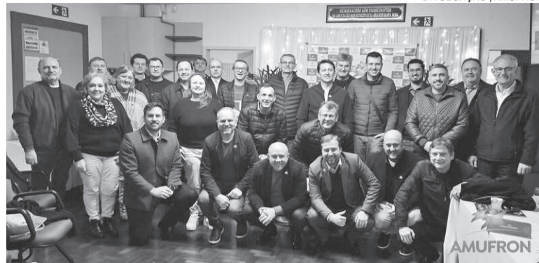
Assembleia reuniu prefeitos, vice-prefeitos e convidados na sede da AMUFRON

A Associação dos Municípios da Fronteira Noroeste (AMUFRON) realizou na segunda-feira, 30, uma Assembleia Geral Ordinária em caráter comemorativo, marcando os 61 anos de fundação da entidade. O encontro reuniu prefeitos, vice-prefeitos e convidados especiais, reafirmando o compromisso da associação com o desenvolvimento regional.