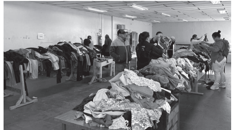
Já foram distribuídas mais de 200 mantas e aproximadamente duas mil peças de roupas pela Secretaria de Assistência Social de Três de Maio neste inverno

As baixas temperaturas registradas em Três de Maio nesta semana, com termômetros marcando zero grau na última terça-feira, 24, e a formação de geada em vários pontos da cidade, levaram a Secretaria Municipal de Assistência Social e Habitação a intensificar o atendimento às pessoas em situação de vulnerabilidade.