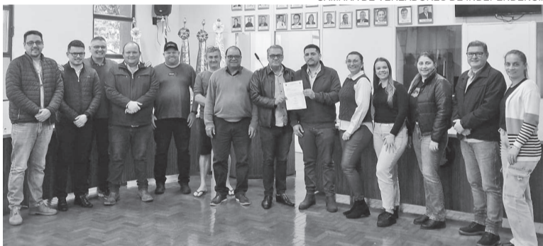
Integrantes da Comissão Organizadora da 7ª ExpoInde receberam a confirmação de recursos do Poder Legislativo na semana passada

“O montante é fruto da economia promovida pela Casa Legislativa ao longo do exercício e de sua parceria com a organização da feira em Independência”, destacou o presidente da Câmara.