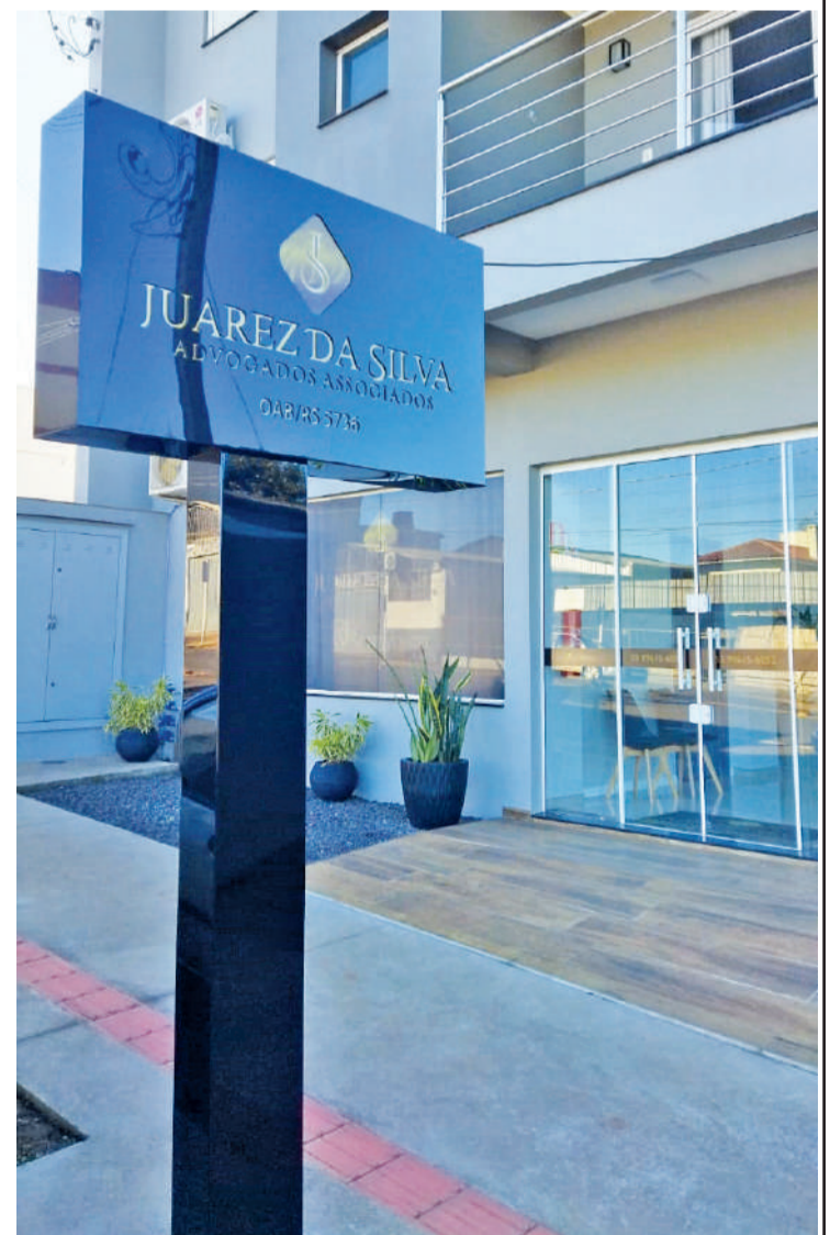
Em Horizontina, o escritório está localizado na Rua Arnoldo Schneider, 537