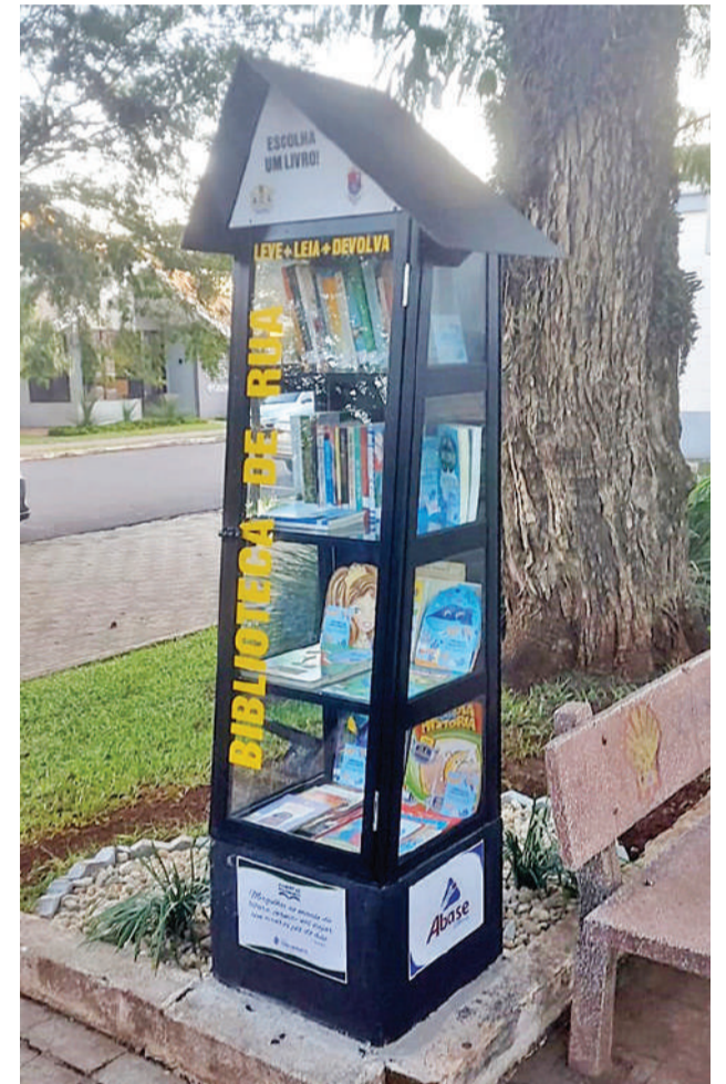
A terceira Biblioteca de Rua está localizada na Praça da Igreja Matriz Católica de Três de Maio. Aberta em todos os dias da semana, os leitores encontram nela livros de literatura infantil, infanto-juvenil, juvenil e adulta

A segunda, foi inaugurada em março de 2023, em parceria da Setrem, e fica no Espaço Jesus de Maria Gonçalves da Silva. O projeto conta com o apoio do Poder Público Municipal, que cede espaço da Biblioteca Pública para guardar o acervo de livros doados pela comunidade.