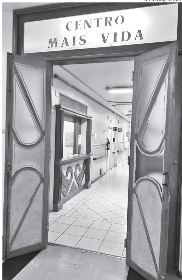
O Centro de Especialidades do HSVP irá funcionar no espaço onde era o Centro Mais Vida

O HSVP também oferece pacotes cirúrgicos com valores acessíveis e condições facilitadas de pagamento, bem como os pacotes de check-up , que oferecem uma alternativa prática e econômica para quem busca cuidados preventivos. “Todas essas iniciativas integram o projeto de fortalecimento da estrutura hospitalar e buscam ampliar o acesso à serviços especializados, diagnósticos e procedimentos cirúrgicos, oferecendo mais soluções de saúde para a população de Três de Maio e região”, conclui Ghewer.