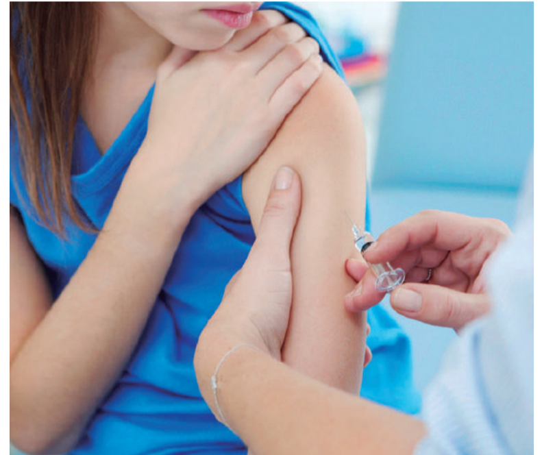
Vacinação contra HPV é voltada para jovens de 15 a 19 anos. Até semana passada, apenas 2,2% do público alvo havia procurado a imunização

Passados 50 dias desde o início da campanha de vacinação contra o HPV voltada para jovens de 15 a 19 anos, a procura pelo imunizante em Três de Maio segue muito abaixo do esperado. Conforme dados da Secretaria Municipal de Saúde, dos 724 adolescentes que integram esse público, apenas 16 (2,2%) receberam a vacina até o momento.