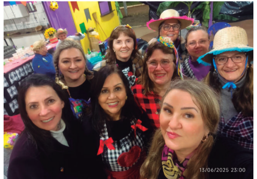
Festa Junina do Lions Clube: no registro, algumas das domadoras presentes