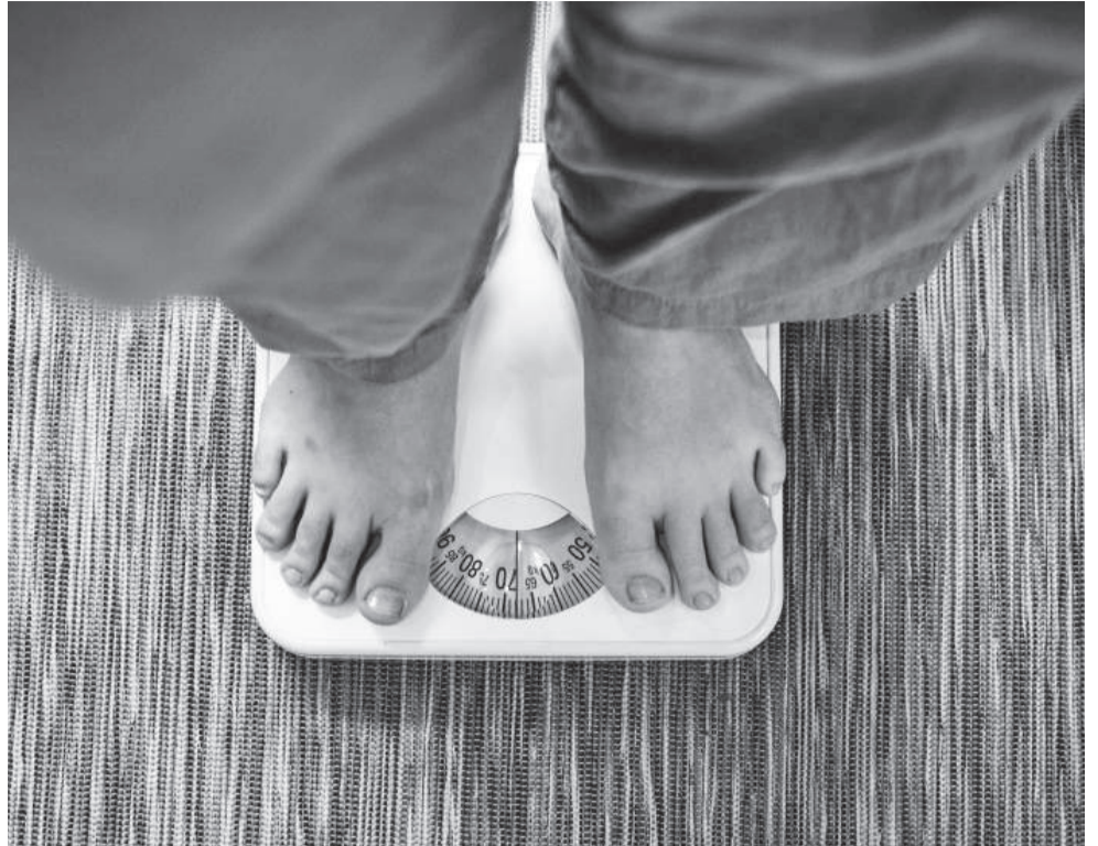
Mais de 4,4 mil moradores de Três de Maio estão com sobrepeso, conforme dados do Sistema de Vigilância Alimentar e Nutricional (SISVAN)

Para auxiliar os municípios a alcançar as metas, foram elaborados planos de ação específicos. Esses documentos orientam os gestores na ampliação do registro do consumo de ultraprocessados e no incentivo à alimentação baseada em alimentos in natura e minimamente processados.