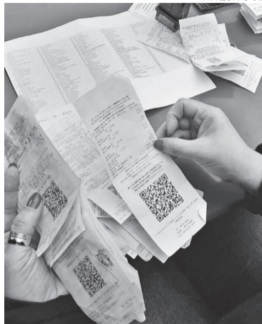
Notas fiscais de compras realizadas entre 28 de maio e 21 de junho podem ser trocadas

O sorteio acontece no dia 24 de junho, no auditório do Centro Empresarial Sicredi/ACI/Sindilojas. Além da Tenda da Sorte, o Promocional sorteará os vales da campanha de Dia dos Namorados, que totalizaram R$ 21,8 mil em vales-compra.