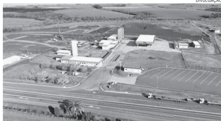
Fábrica transformará soro de leite em proteína concentrada e soro em pó

A fábrica já possui 30 trabalhadores e deve chegar a 50 em dois meses. A partir da operação máxima, prevista para meados de 2026, devem ser 150 empregos diretos.