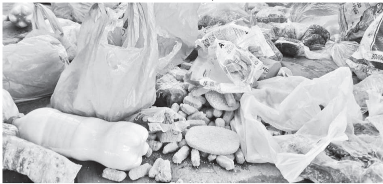
Diversos produtos foram apreendidos pela Força-Tarefa do Programa Segurança dos Alimentos