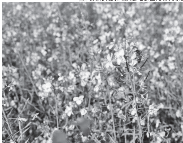
Em torno de 80% da área projetada para canola em Três de Maio, já foi plantada

A cultura é muito utilizada na produção de óleo e como existe empresa compradora, o produtor tem uma alternativa para diversificar a sua produção, se tornando uma alternativa para cultivo de inverno. “É uma cultura que demanda conhecimento técnico de cultivo, porque necessita de máquinas para realizar o plantio por ser uma semente mais miúda, além de má-