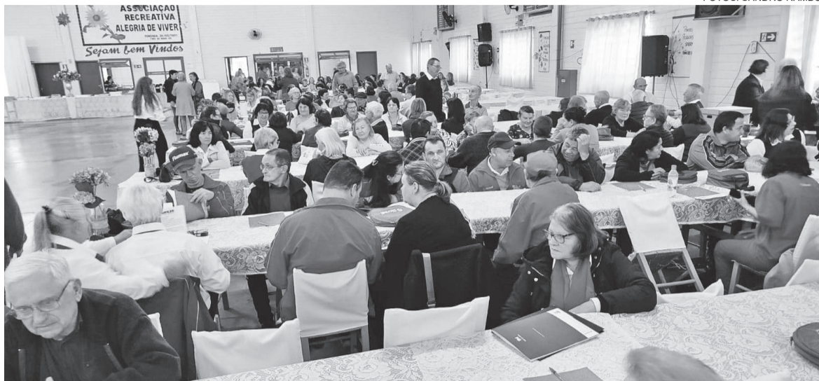
Conferência Regional da Pessoa Idosa reuniu idosos de sete municípios

Na última terça-feira, dia 17, ocorreu a 1ª Conferência Regional da Pessoa Idosa, realizada no Salão do Grupo de Idosos Alegria de Viver, em Três de Maio. O evento reuniu idosos, gestores públicos e especialistas representando sete municípios: Três de Maio, Boa Vista do Buricá, Independência, Nova Candelária, São José do Inhacorá, Senador Salgado Filho e Tucunduva.