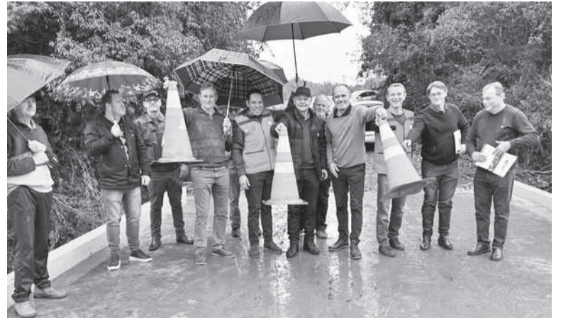
Autoridades regionais participaram da inauguração da ponte sobre o Rio Buricá, em Barra Seca

Investimento é de R$ 264,5 mil, com recursos do Ministério do Desenvolvimento Regional