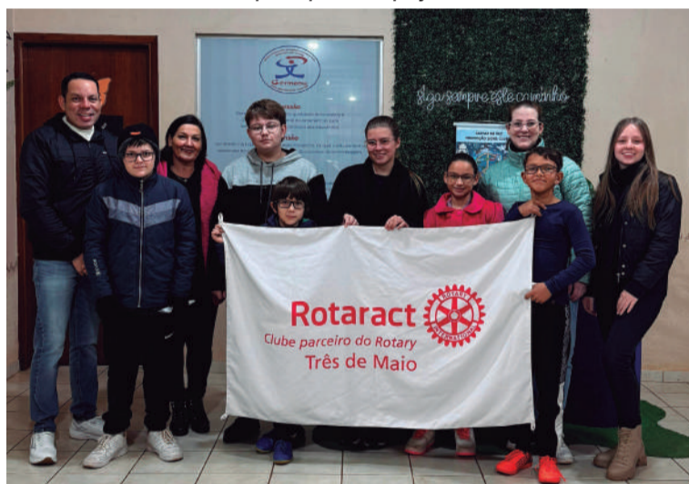
Projeto do Rotaract também beneficiou alunos da Germano Dockhorn

feita nas escolas. Professores relataram melhorias no rendimento escolar e na participação dos alunos em sala de aula.