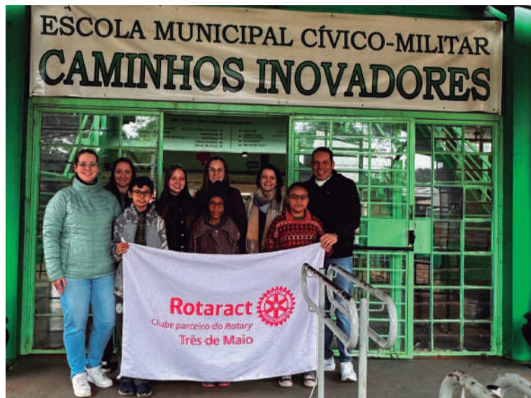
Estudantes da Escola Municipal Cívico-Militar Caminhos Inovadores participaram do projeto