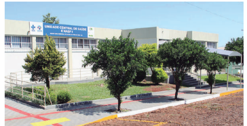
Unidade Central estará aberta aos sábados nos meses de junho e julho

Medida reforça atendimento no período de maior circulação de síndromes respiratórias