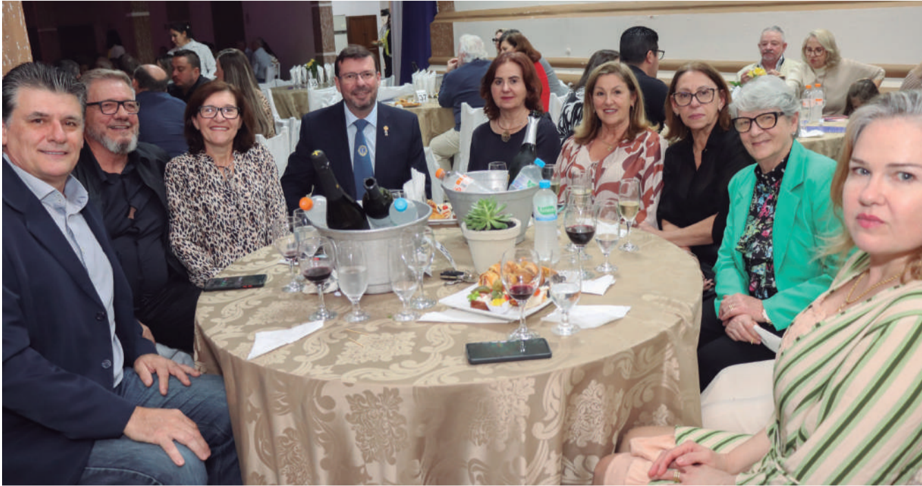
Integrantes da direção e colaboradores da APAE de Três de Maio em um dia dedicado à agenda social