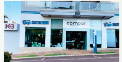
BOA VISTA DO BURICÁ