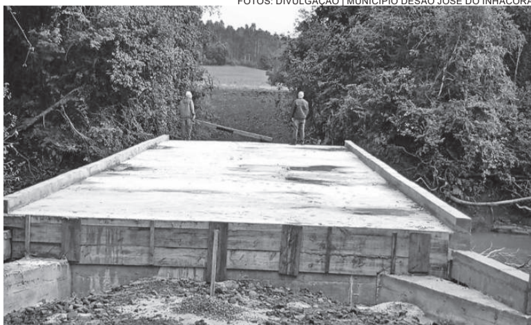
Obra foi viabilizada com recursos da Secretaria Nacional de Proteção e Defesa Civil

A infraestrutura foi viabilizada com recursos do Ministério do Desenvolvimento Regional, por meio da Secretaria Nacional de Proteção e Defesa Civil, totalizando um investimento de R$ 264,5 mil. “A nova ponte representa um grande avanço para