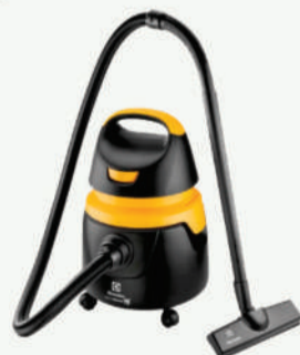
Aspirador de Pó