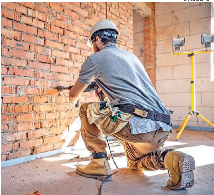
Diversidade de ramos de negócios contribuem para o alto índice no Firjan

O Índice Firjan de Desenvolvimento Municipal (IFDM), divulgado anualmente, mede o progresso socioeconômico de mais de 5,5 mil cidades brasileiras, nas áreas de Emprego & Renda, Saúde e Educação. No levantamento referente ao ano de 2023, Três de Maio alcançou destaque na dimensão Emprego & Renda, com índice de 0,9208, posicionando-se entre os 20% dos municípios brasileiros com melhor desempenho - classificação que representa alto desenvolvimento. No índice geral, a cidade registrou 0,7568, mantendo-se na faixa de desenvolvimento moderado. Com esse resultado, Três de Maio ocupa a 94ª posição entre os 497 municípios do Estado e na 626ª no ranking nacional/5