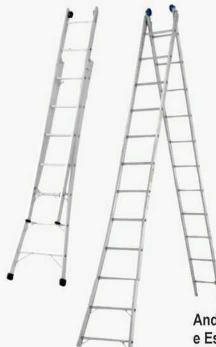
Andaimes e Escadas