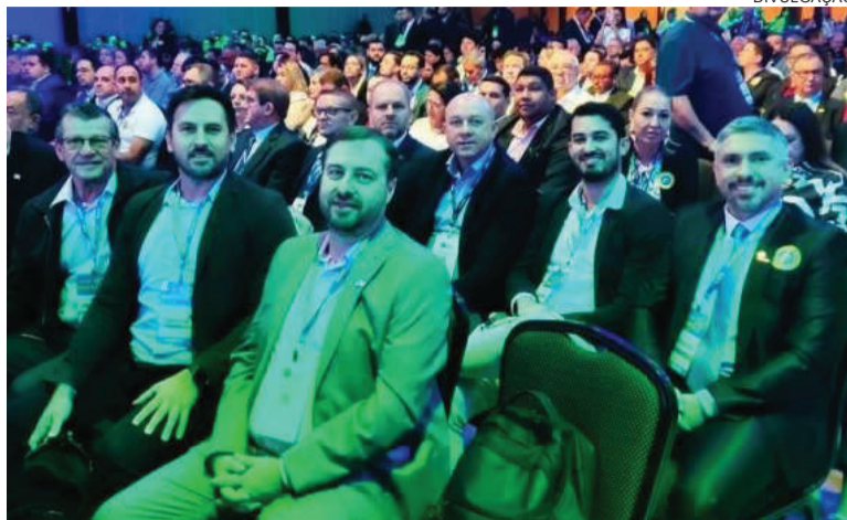
Prefeitos da região Fronteira Noroeste participaram da marcha em Brasília

Ao Semanal, Sehnem explicou que a marcha discute pautas que impactam diretamente na vida dos municípios, como reforma tributária e legislações que interferem especialmente nas finanças municipais. “Uma das pautas é a PEC 66, que está em tramitação, referente à questão do RPPS (Regime Próprio de Previdência Social), onde a legislação federal abrange-