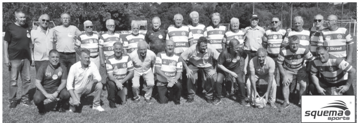
No registro, alguns dos ex-atletas do Oriental presentes no evento