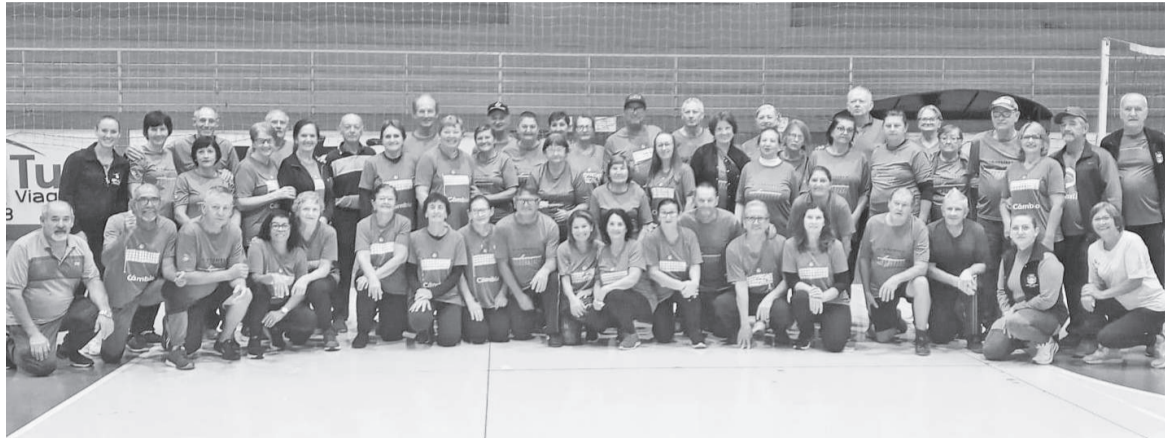
Grupo de Câmbio Saber Viver é a primeira associação da modalidade esportiva de Três de Maio. A integração com outros grupos da região são frequentes (foto)

Uma modalidade esportiva adaptada tem conquistado cada vez mais espaço em Três de Maio e em toda a região: o câmbio. Derivado do vôlei, o esporte é disputado na mesma quadra, com a mesma bola e rede, mas com uma regra diferenciada — permite que os jogadores segurem a bola antes de repassá-la. A alteração torna o jogo mais acessível para pessoas com mais de 50 anos, incentivando a prática esportiva e a socialização.