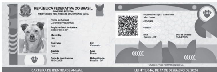
Carteirinha emitida pelo SinPatinhas para os animais de estimação

O SinPatinhas funciona como um banco de dados nacional, como um instrumento para