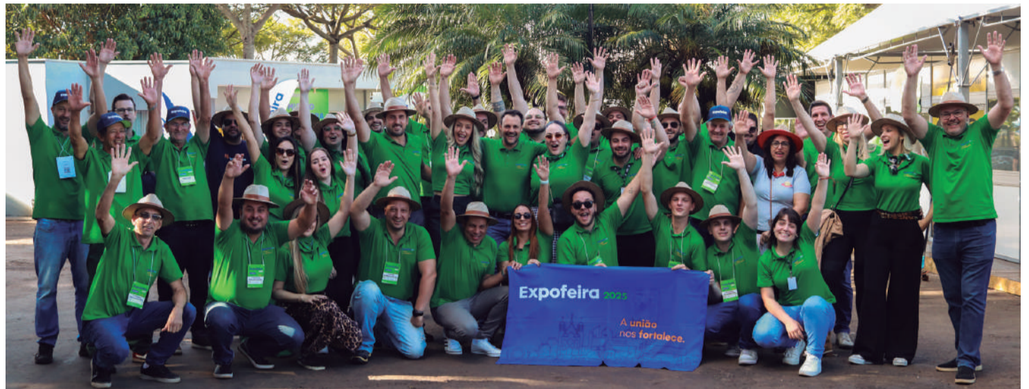
Grupo de voluntários que fez a feira acontecer e ser um sucesso