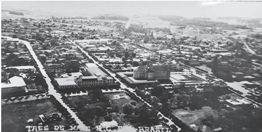
A emancipação de Três de Maio foi alcançada em 1953, a Lei criando o município foi assinada em 15 de dezembro de 1954 e o município foi oficialmente instalado no dia 28 de fevereiro de 1955

Os protestos da população começaram novamente a serem percebidos por todos os lados, até que finalmente,