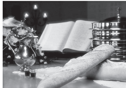
Pão e o Vinho: simbolizam o corpo e o sangue de Cristo

Todos os símbolos da Páscoa indicam direta ou indiretamente a ressurreição de Jesus e a sua vitória sobre a morte. A Páscoa é a data mais importante para os cristãos.