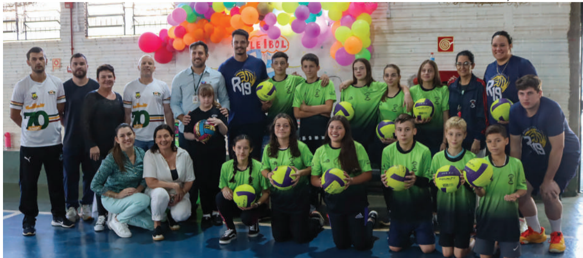
Projeto piloto será desenvolvido na Escola Municipal Germano Dockhorn, com alunos de 10 e 12 anos

SECRETARIA DE COMUNICAÇÃO DE TRÊS DE MAIO