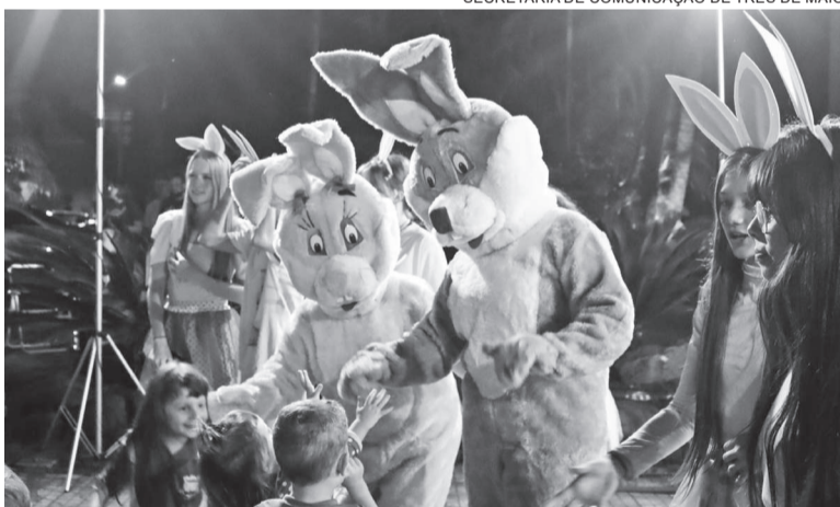
Brique na Praça, show gospel e atrações alusivas a Páscoa ocorreram na segunda-feira, em frente ao Palácio Municipal Walter Ullmann