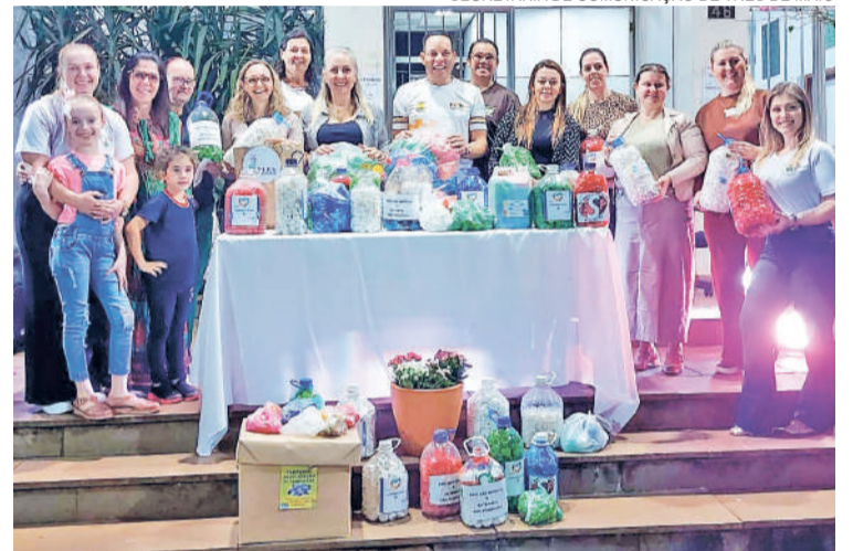
O Culto Ecumênico, que abriu a programação de Páscoa do município, marcou o início da campanha de Coleta de Tampinhas PET

SECRETARIA DE COMUNICAÇÃO DE TRÊS DE MAIO