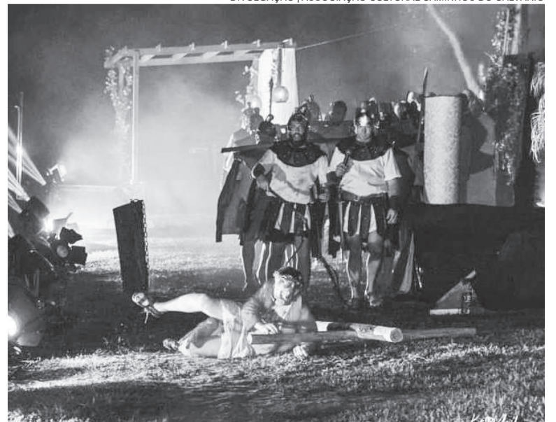
Encenação da paixão, morte e ressurreição Cristo