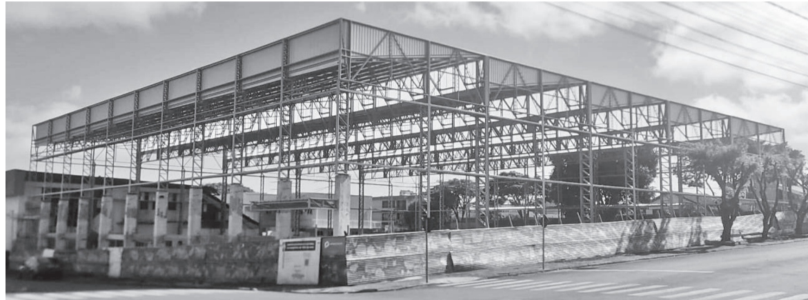
Obras do CEC-TM iniciaram em maio de 2024

O Governo Municipal de Três de Maio está licitando a Fase 2 do Centro Esportivo e Cultural de Três de Maio (CEC-TM). De acordo com a Secretaria de Esporte, Lazer e Juventude, que coordena o processo, a etapa prevê a execução de diversos serviços que envolvem o fechamento e acabamento do ambiente. “A Fase 2 do CEC-TM prevê a instalação de esquadrias, impermeabilização, revestimentos,