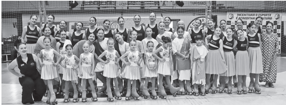
SECRETARIA DE COMUNICAÇÃO DE TRÊS DE MAIO

Evento realizado no ginásio da AABB integrou programação de Páscoa do município