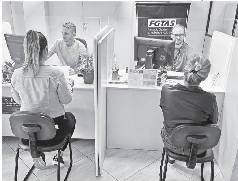
Três de Maio fechou 2024 com 133 trabalhadores estrangeiros atendidos

Segundo ela, nem todos conseguem iniciar o processo de integração ao mercado por falta de documentação legal. “Sem o protocolo de autorização de permanência emitido pela Polícia Fede-