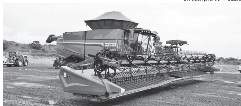
Colheitadeira possibilitará a automação preditiva de velocidade