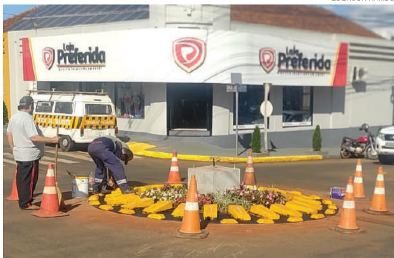
Rotatória foi modificada para melhor organizar o trânsito

O plano será executado por etapas, contemplando melhorias na sinalização horizontal e vertical, adequações paisagísticas e insta-