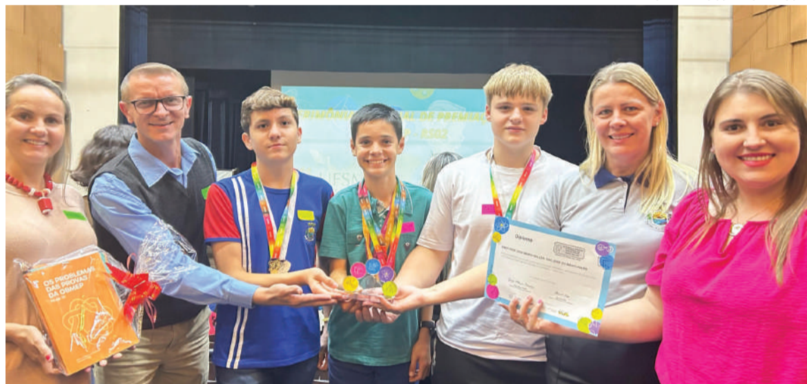
PREFEITURA DE SÃO JOSÉ DO INHACORÁ