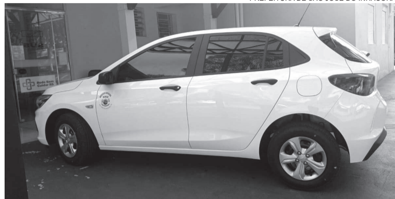
Automóvel Onyx irá atender demandas da Secretaria de Saúde