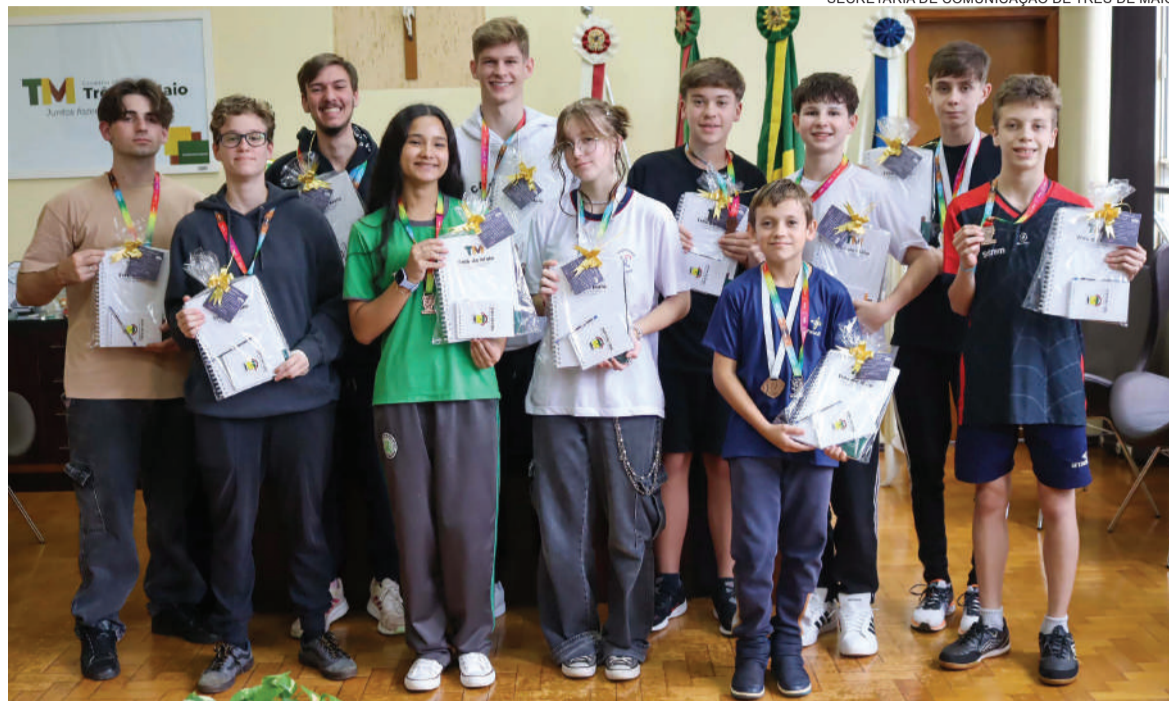
SECRETARIA DE COMUNICAÇÃO DE TRÊS DE MAIO

Quatorze estudantes três-maienses foram premiados durante a cerimônia realizada em Santa Maria. De São José do Inhacorá, outros seis alunos