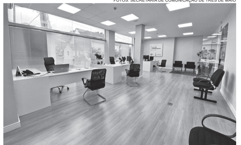
O novo espaço da Secretaria de Desenvolvimento Econômico é mais amplo e moderno

Em 2025 a secretaria planeja o lançamento do programa Juro Zero, uma iniciativa que visa facilitar o acesso a crédito para pequenos e médios empresários que precisam de recursos financeiros para expandir seus negócios. No último ano o programa Juro Zero injetou na economia do município mais de R$ 1,2 milhão.