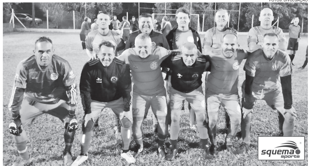
Equipe dos Amigos da Bola disputa hoje uma vaga na final do Campeonato Regional Master Cinquentão de Dr. Maurício Cardoso

Segundo a comissão, os primeiros treinos iniciam com um foco direcionado ao condicionamento físico dos atletas. “Isso para que os jogadores estejam preparados física e taticamente para o calendário e os desafios da temporada,