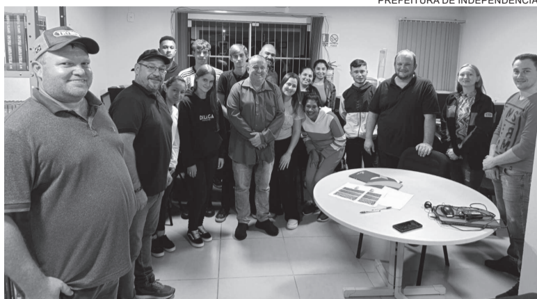
Cursos do programa Qualifica RS iniciaram nessa semana em Independência

ofertados para quem está desempregado ou subempregado. As aulas são ministradas por professores do Senai e Sesc, garantindo uma certificação reconhecida nacionalmente.