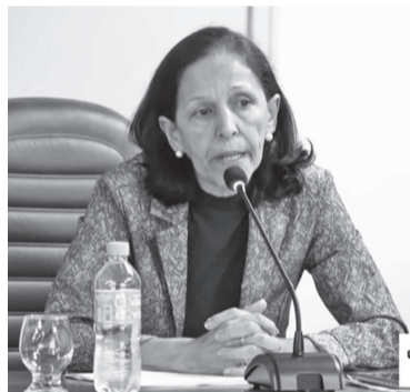
Secretária da Saúde Jacira Taborda