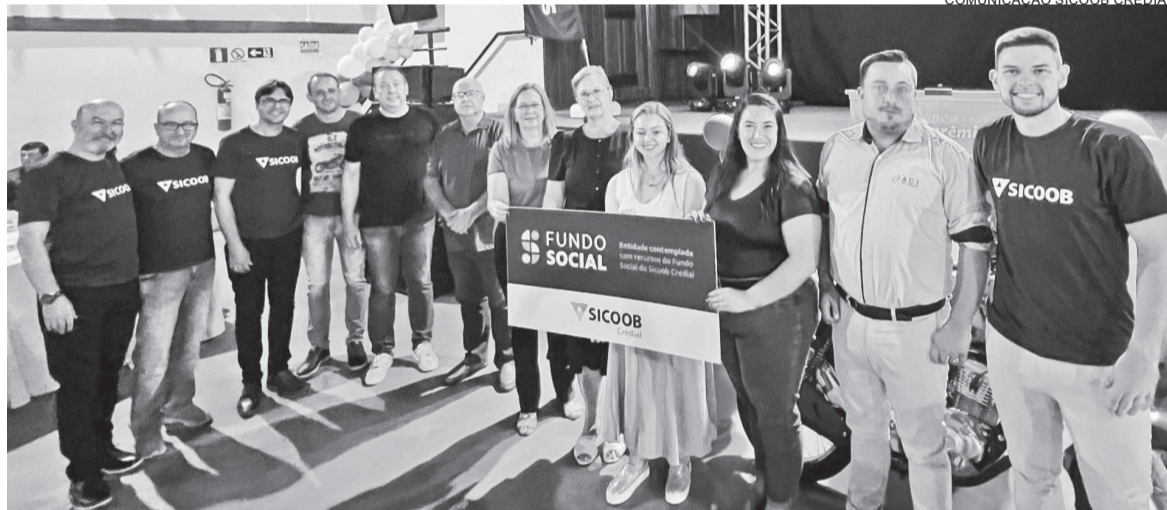
Representantes das entidades contempladas com o Fundo Social Sicoob

Na assembleia de quarta-feira, o presidente fez o lançamento da nova campanha de integralização ProCap Sicoob Credial, que vai sortear 106 prêmios, sendo dois veículos novos.