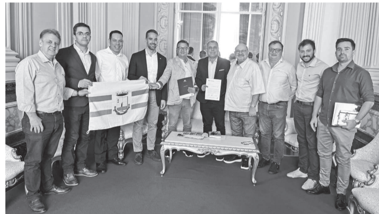
Governador Eduardo Leite recebeu comitiva três-maiense no Palácio Piratini

Representantes do município estiveram com o governador Eduardo Leite nesta semana