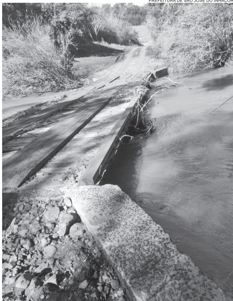
PREFEITURA DE SÃO JOSÉ DO INHACORÁ

O governo municipal reforça que a construção da ponte seguirá os prazos estabelecidos por lei e, assim que concluída, garantirá mais segurança e qualidade de tráfego para toda a comunidade.