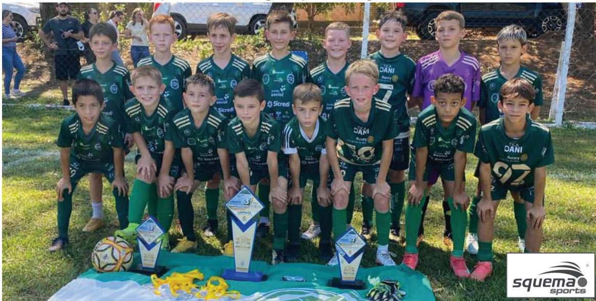
Atletas do Oriental campeões da Série Ouro categoria Sub-10 da Copa Porto Mauá