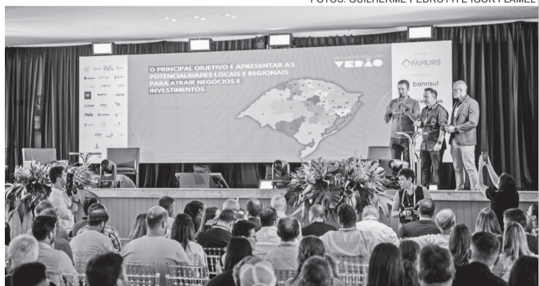
Famurs lançou o Sistema Oportuniza Municípios durante Assembleia de Verão, realizada em fevereiro, em Xangri-lá

O grupo reforçou a necessidade urgente da recuperação da rodovia, que há anos enfrenta problemas de infraestrutura, dificultando o transporte e impactando a economia da região. Agora, a demanda aguarda a análise do governo estadual para a viabilização dos recursos e início das obras.