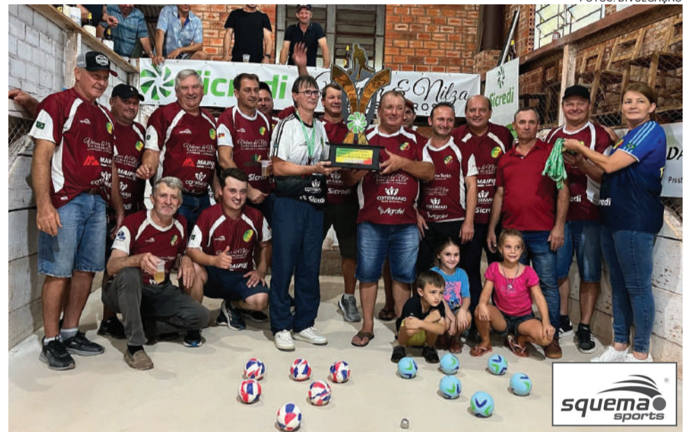
Equipe da comunidade de Esquina Bado recebeu o troféu de campeã do Campeonato de Bochas