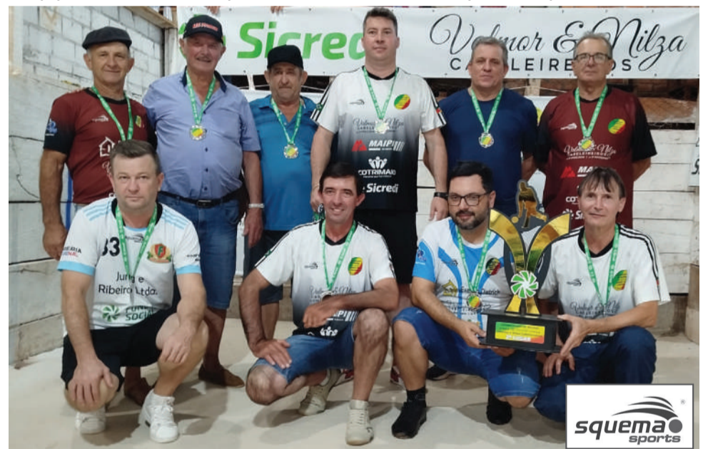
Equipe da comunidade de Santo Antônio, vice-campeã do Campeonato de Bochas