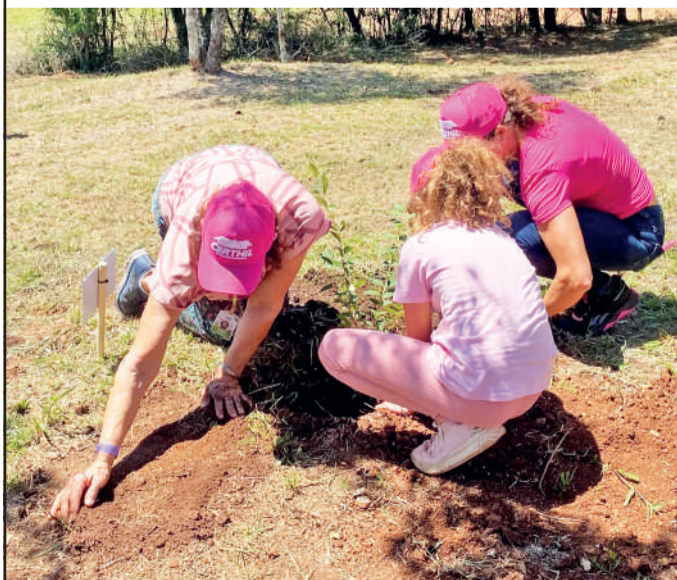
Associadas plantaram árvores próximo ao quiosque da cooperativa

Na última sexta, dia 21, a Certhil realizou o 4º Encontro das Associadas, um evento especial que reuniu cerca de 200 mulheres para estreitar os laços entre a cooperativa e suas associadas. A programação teve como destaque a visita à Usina CGH Buricá, situada na divisa entre Independência e Inhacorá.