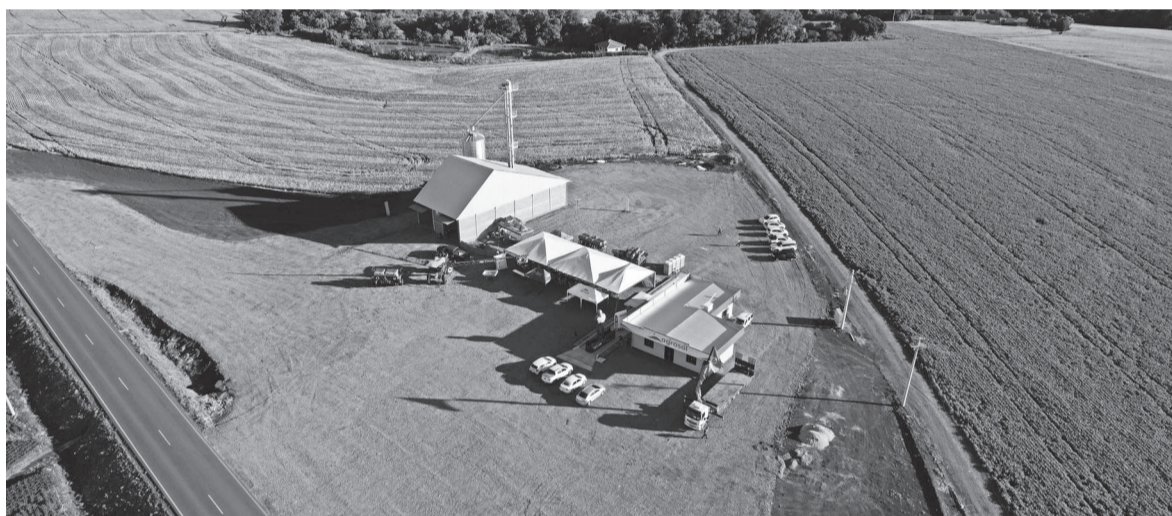
Nova unidade da Agrosol, localizada em Esquina Tunas, interior de Horizontina