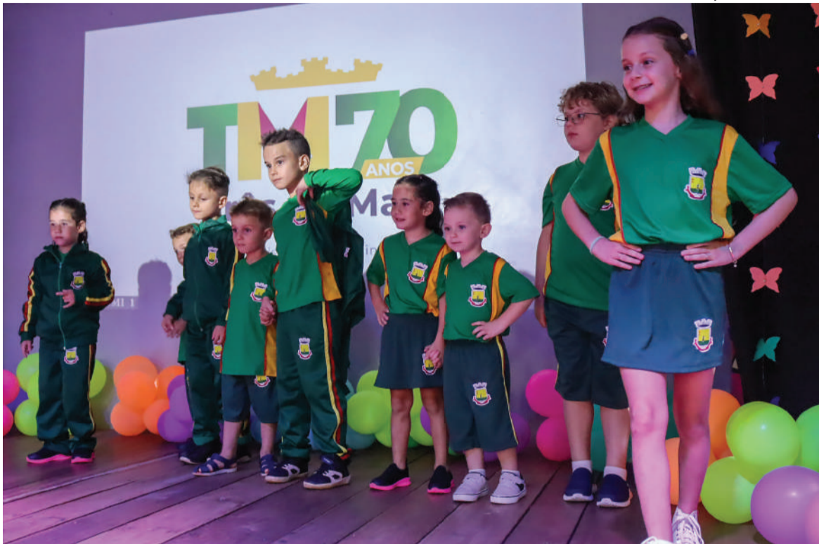
Distribuição de uniformes ocorre ao longo do mês de março. Projeto foi apresentado à comunidade escolar no começo do ano letivo de 2025

Kits foram distribuídos a todos os estudantes das escolas do município, totalizando 2.595 unidades