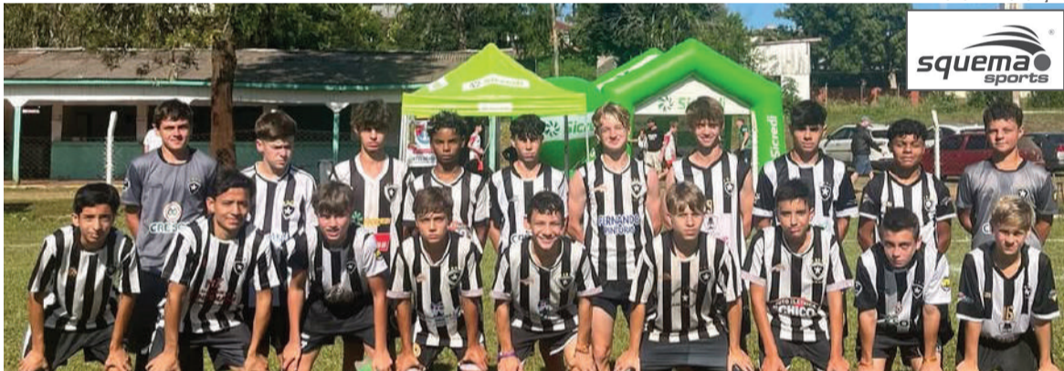
Botafogo campeão da Série Ouro na categoria Sub-14 da Copa Porto Mauá