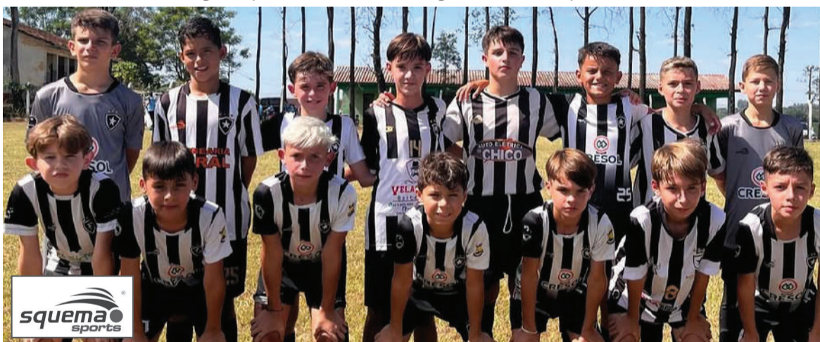
Equipe Sub-12 do Botafogo campeão da categoria na Série Ouro