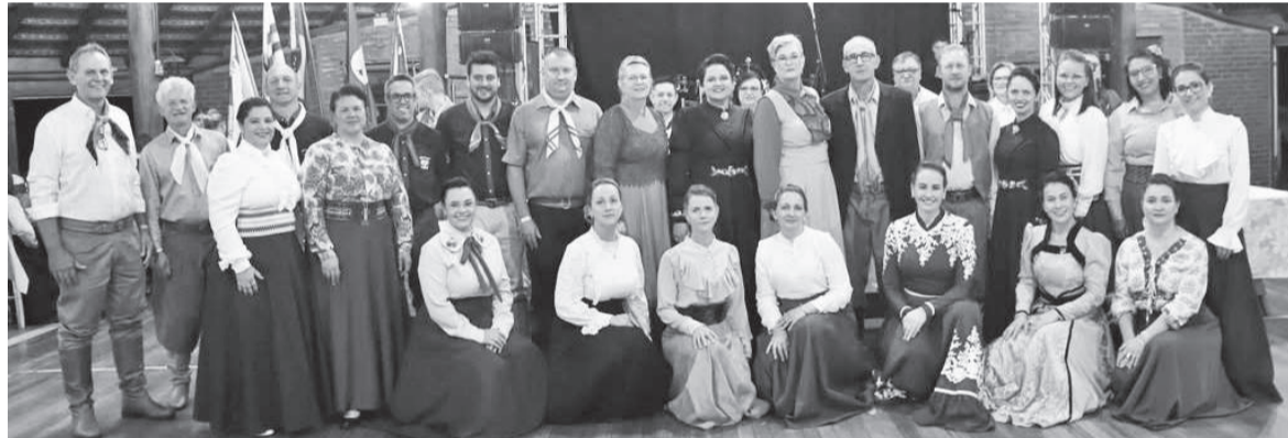
Patronagem 2025/2026 que tomou posse no último sábado