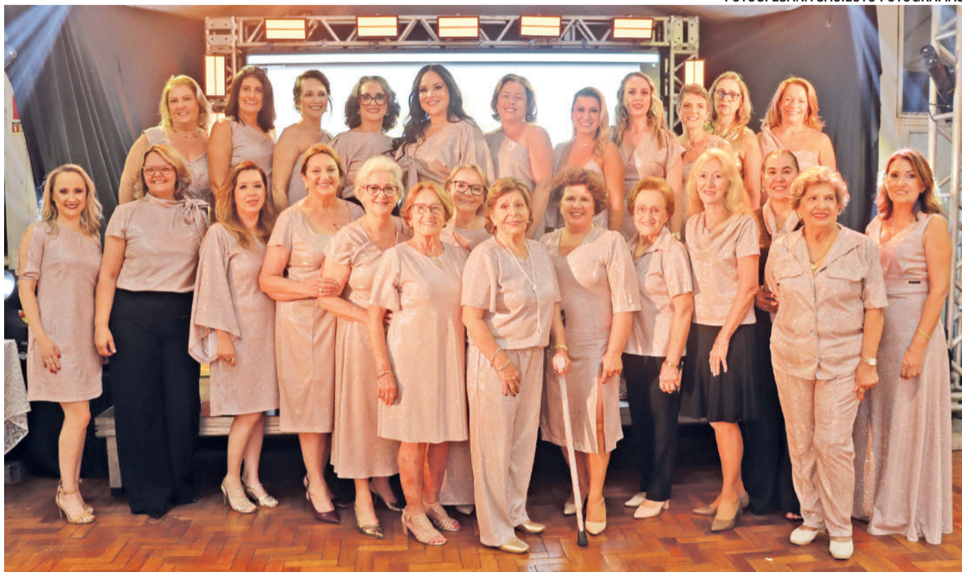
Integrantes da Casa da Amizade no ano do cinquentenário do clube de serviço