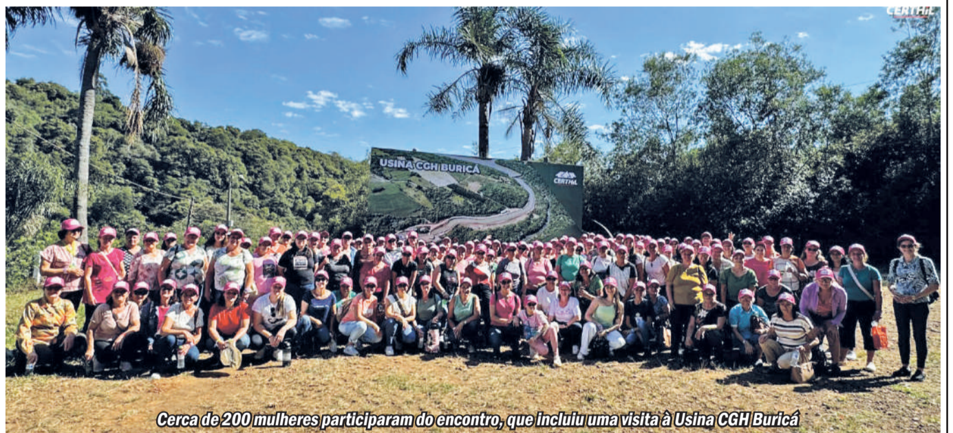
Cerca de 200 mulheres participaram do encontro, que incluiu uma visita à Usina CGH Buricá

Associadas visitaram a Usina CGH Buricá, localizada na divisa de Independência e Inhacorá