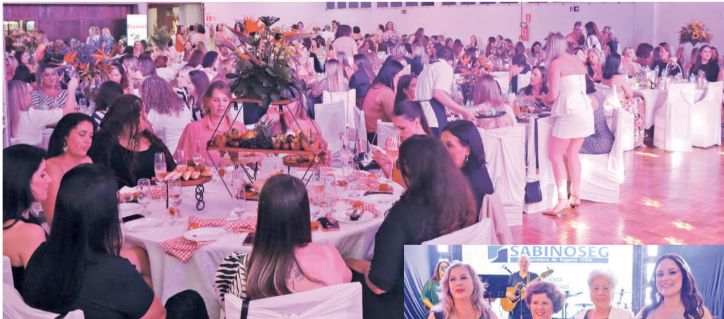
O evento de 2025 contou com 20 patronesses que, junto com suas convidadas, brindaram a vida, a amizade e a solidariedade