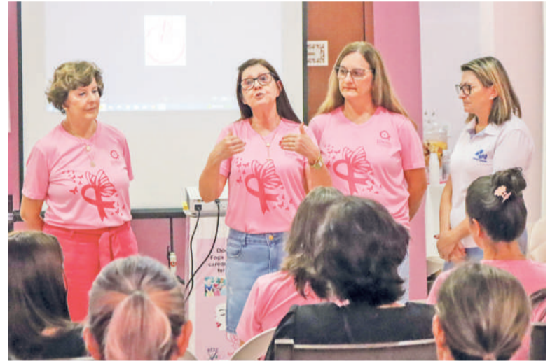
Coordenadoras e voluntárias do IAMAMA reforçaram a importância da entidade no apoio à mulheres que estão em tratamento contra o câncer de mama

SECRETARIA DE COMUNICAÇÃO DE TRÊS DE MAIO