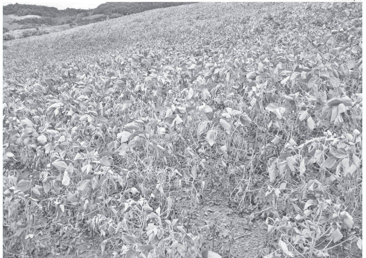
Estimativa da Emater indicam que perdas nas lavouras de soja chegarão a 30%, podendo, inclusive, variar de uma localidade para outra dentro do município

O Decreto Municipal de Emergência foi assinado em 11 de fevereiro.