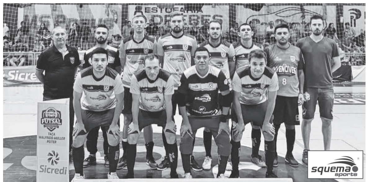
Em busca do bicampeonato, Os Invencíveis tem o melhor ataque com 29 gols marcados e 100% de aproveitamento