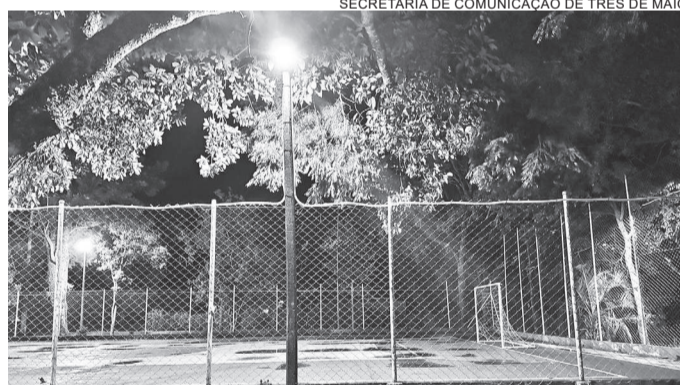
Praça recebeu obras de reforma e revitalização

Urbana e Meio Ambiente destacou que a nova iluminação traz mais segurança e tranquilidade para a prática de atividades físicas e recreativas no período noturno, contribuindo para a qualidade de vida da população.