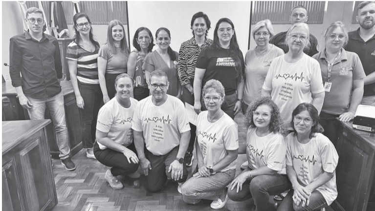
Representantes de diversas entidades estiveram reunidos para a criação do Comitê de Prevenção do Suicídio e Valorização da Vida de Três de Maio

Foi dado o pontapé para a criação do Comitê de Prevenção do Suicídio e Valorização da Vida de Três de Maio. Na última quarta-feira, 12, representantes de entidades reuniram-se na Câmara de Vereadores para a primeira reunião de trabalho.