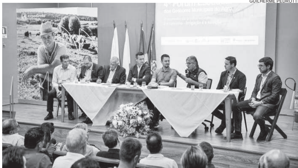
Representantes de entidades gaúchas reforçaram a necessidade de ações para enfrentamento de situações climáticas como estiagens

Polo informou ainda que a SDE tem trabalhado para criar um ambiente de negócios mais favorável no Estado, com programas de apoio e incentivo, visando aprimorar os serviços prestados e fortalecer o setor.