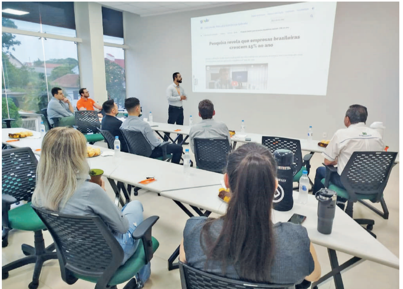
Encontro com Associados ocorreu no dia 13, no auditório da Cresol, em Três de Maio