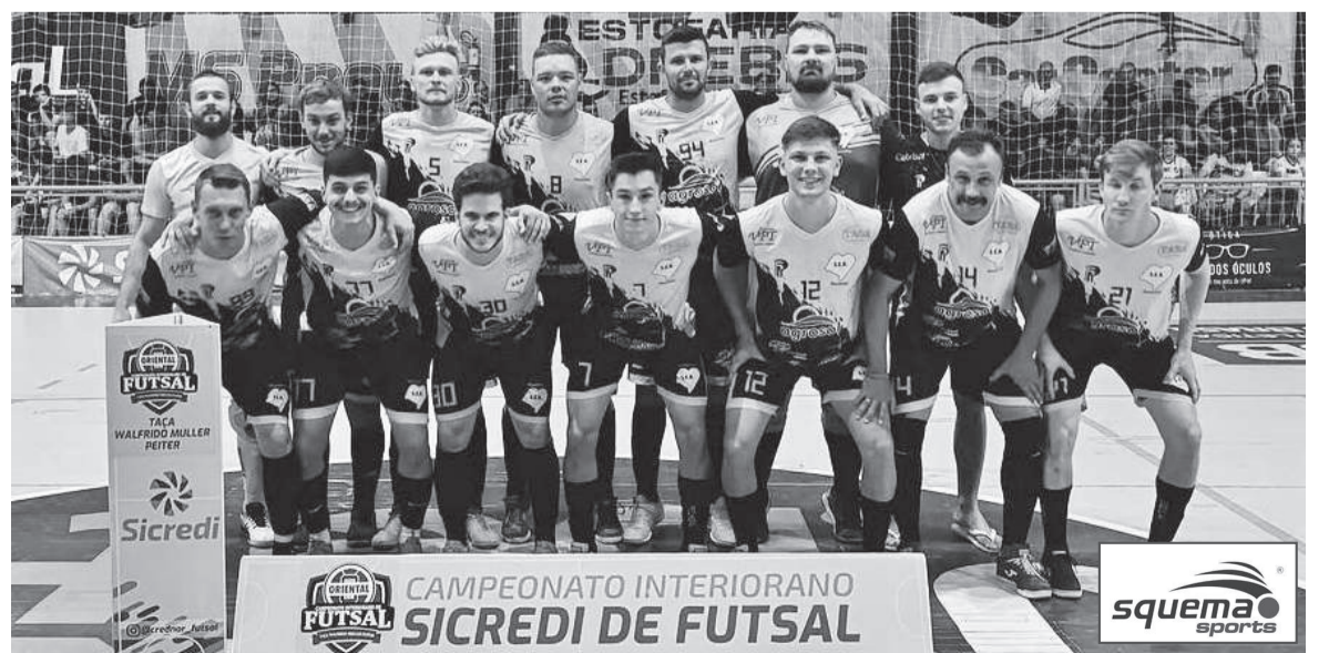
Rocinha tem a melhor defesa da competição com três gols sofridos e também tem 100% de aproveitamento