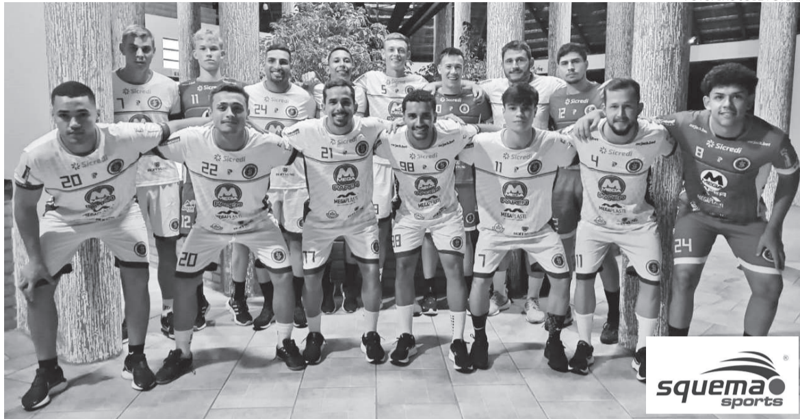
Jogadores do São José Futsal durante a apresentação para a pré-temporada 2025

O São José Futsal apresentou o grupo de jogadores para a temporada de 2025. Desde o dia 3 de março a equipe inhacorense, juntamente com a comissão técnica, realiza a pré-temporada visando as competições que disputará ao longo do ano: a Taça Farroupilha Alto Uruguai e o Campeonato Gaúcho de Futsal da Série B da Liga Gaúcha.