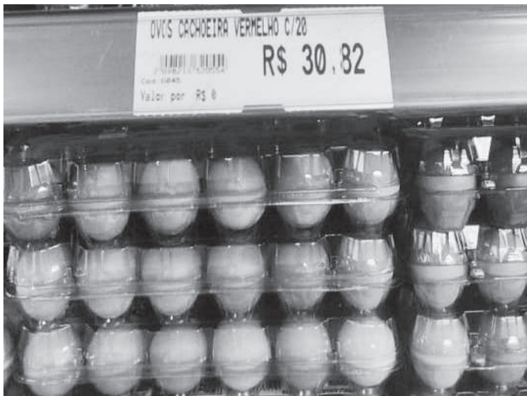
Em Três de Maio, bandeja com 20 unidades de ovos é encontrada a R$ 30,82

Entre os principais destinos das exportações brasileiras de ovos estão os Emirados Árabes