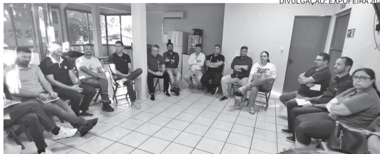
Reunião contou com representantes das comissões da feira

Os integrantes das comissões organizadoras da Expofeira 2025 se reuniram na última semana para ajustar os detalhes do evento, que ocorrerá de 3 a 11 de maio no Parque de Exposições Germano Dockhorn, em Três de Maio.